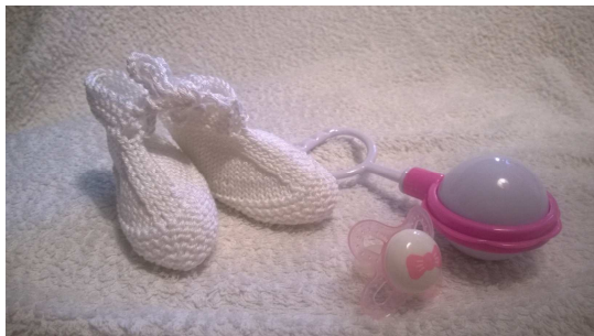
Csendélet csörgővel, cumival és horgolt cipőcskével

Jó szándékú, kedves, segítőkész nagypapa, nagymama, testvérek és távoli rokonok tartoznak ide. Külön figyelmet szentelnék gyermekeim apjának, akitől a legnagyobb segítséget kapom a mindennapok során. Éjjel, amikor már mindenki alszik, és a Hold sem süt be az ablakon át, a férjem átveszi anyai teendőimet: berohan a gyerekekhez, ha sírnak vagy csak pisilni kell. Ez idő alatt én hallókészülékem nélkül nyugodtan alhatok reggelig. Szerintem ennél nagyobb segítséget egy technika sem tudna nyújtani.