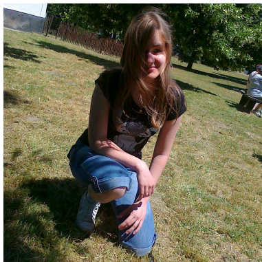
Gabi a szabadban

– Az, hogy nagyon sokrétű, sok-sok feladat van. Ami hozzám közel állt már akkor is, és most is, a hát-