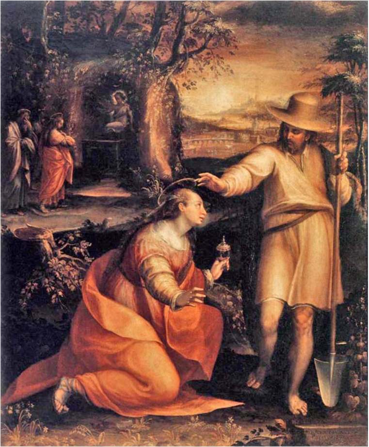
4. kép: Lavina Fontana (1581)