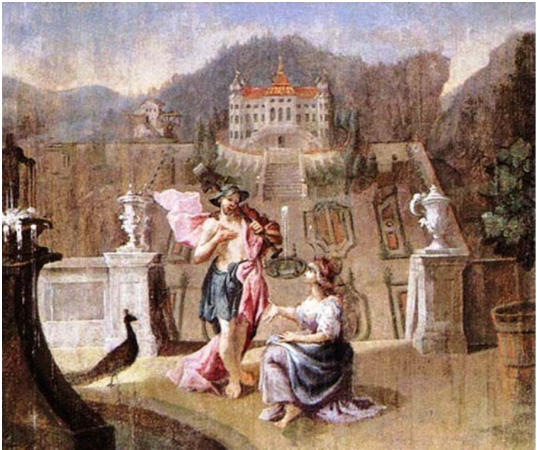
6. kép: Lucan Huetter (1753)