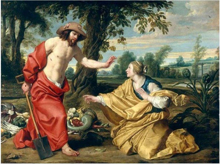
5. kép: Janssens-Wildens (1620)