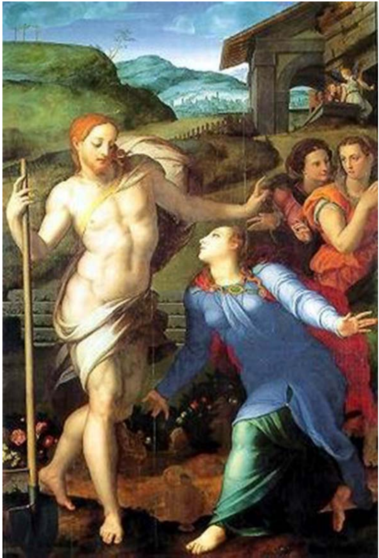
3. kép: Bronzino