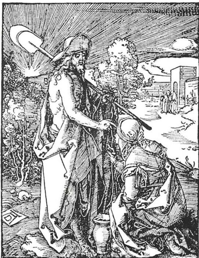
2. kép: Dürer