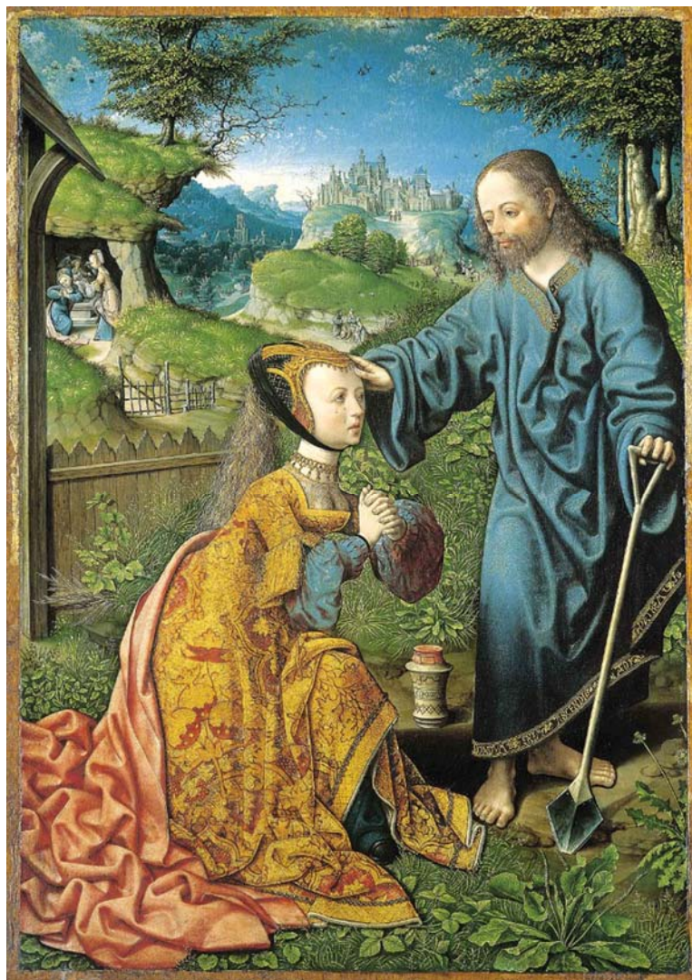
1. kép: van Oostsanen (1533)

ta: „Aki meg se halt még, minek azt siratni, / Mikor a halott sem fog halott maradni! ” (Toldi VI/16)