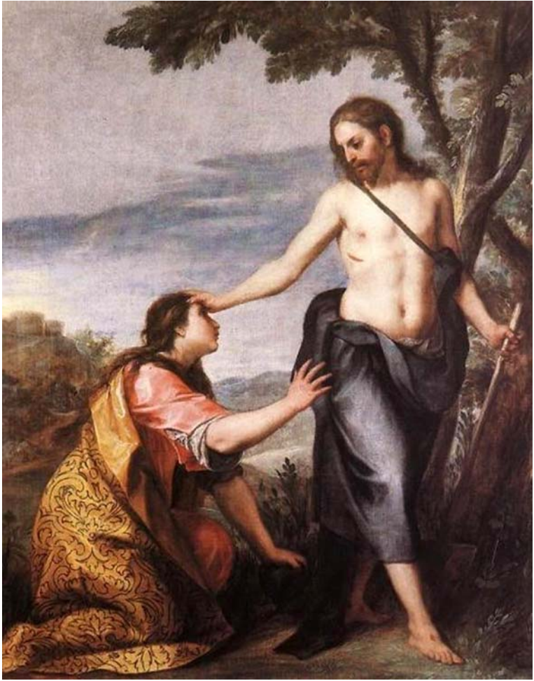
7. kép: Alonso Cano (kb. 1640)