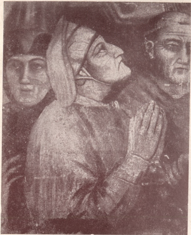
Dante (Orcagna freskója után)