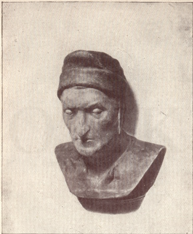
Dante halotti maszkja (Flórenc, Uffizi)