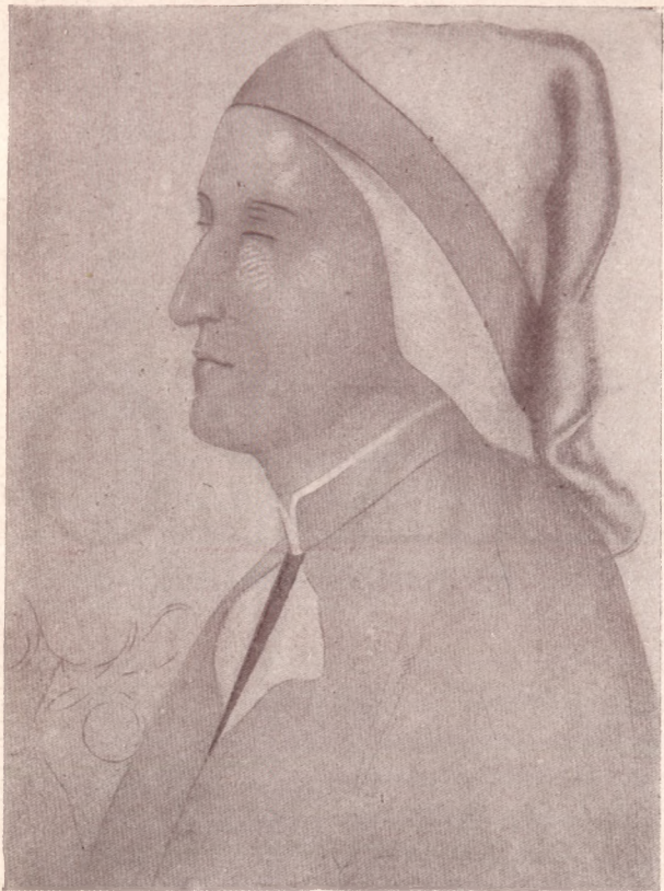
Giotto: Dante-arckép a flórenci Bargello freskójáról (Seymour Kirkupnak a kép restaurálása előtt készült rajza után)