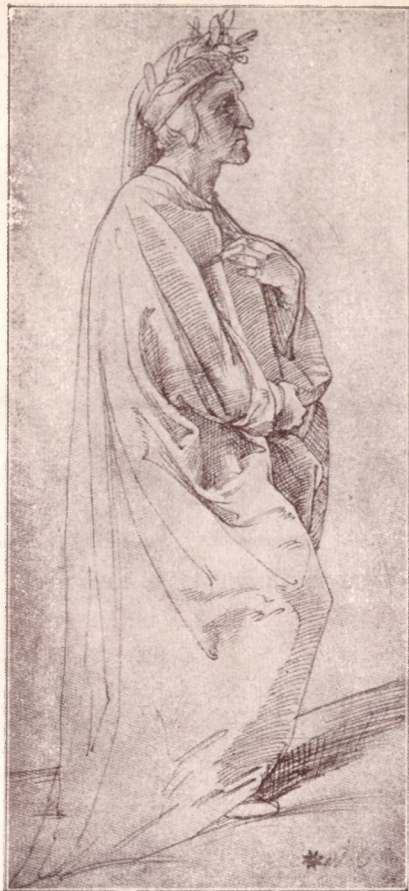
Dante (Rafael rajza után)