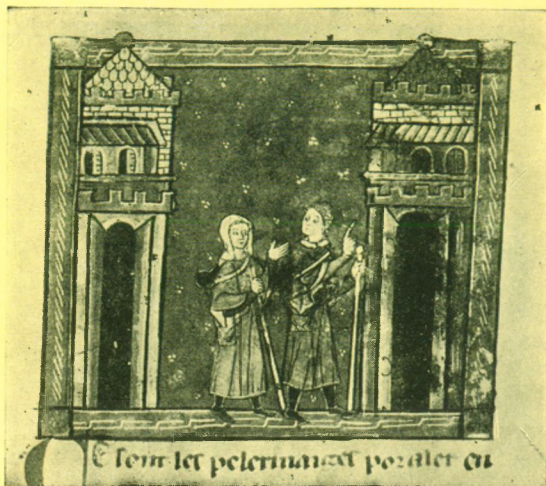
ZARÁNDOKOK, ÚTBAN JERUZSÁLEM FELÉ Francia miniatúra a XIV. század elejéről Bécs, Nationalbibliothek, 2590.