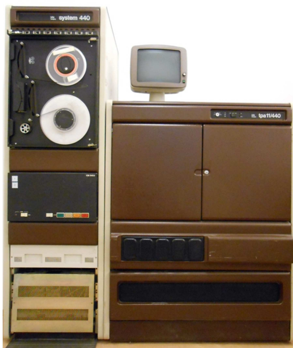
TPA 11/440 központi egység bolgár mágnes-szalagos és lemezes perifériával (PTE TTK informatika gyűjtemény)