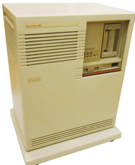
MicroVAX 3500 (PTE TTK informatika gyűjtemény)

A gépekhez – kis számuk miatt – inkább csak az oktatók fértek hozzá tanulási, kutatási, szemléltetési céllal. A kari Számítástechnikai és Automatizálási Bizottság 1987-es beszámolója [12] kizárólag ilyen jellegű alkalmazásokat említ.