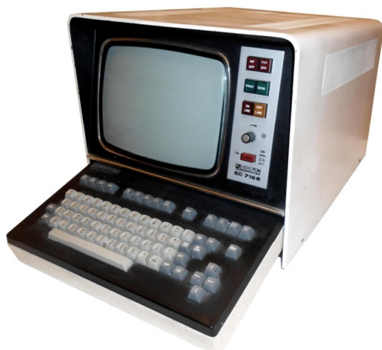
VT-340 (EC-7168)

1986-ban a Tudományszervezési és Informatikai Intézet az „Automatizált Műszaki Tervezés”-sel kapcsolatos kutatások és fejlesztések céljából egy szovjet gyártmányú SZM-4 számítógépet biztosított a számítóközpontnak. 1988-ban pedig egy használt TPA-1140 típusú számítógép (14 terminállal) beszerzésére és telepítésére került sor. 16