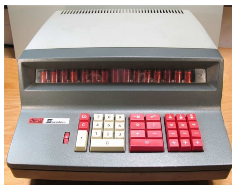
Soemtron ETR 220 Calculator

( itf.njst.hu/23r4r23r/uploads/Rendszerek/EMG%20HUNOR.doc )