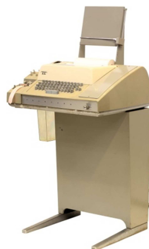
Teletype 33 ASR

Újabb projekt indult országos hálózat fejlesztésére, intelligens terminálok kiépítésével. Kezdetben egy DEC LSI 24-es mikrogépet javasoltunk, de végül a KFKI-nál már előrehaladott fejlesztési állapotban lévő TPA 11/40-es laborszámítógép 10 lett telepítve, melynek kapacitása