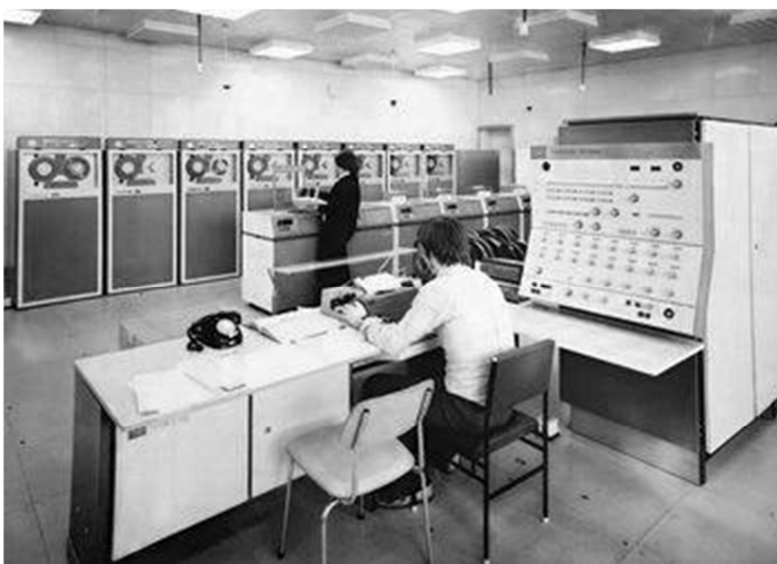
R-40 (EC-1040) konfiguráció

1983-ban az OM szervezésében, a minőségi szolgáltatás érdekében megkezdődött a felsőoktatási intézmények között az addig használt erőforrások cseréje. A PMMF a csereprogram keretén belül a Szegedi Tudományegyetem Kibernetikai Laboratóriumának R-40 típusú gépét kapta meg, a pécsi R-22 számítógép a Dunaújvárosi Főiskolára került. Az R-40-es gép telepítését követően kialakítottak egy OS-CRJE alapú távadat-feldolgozó hálózatot is, ami lehetővé tette 16 db VT-340, illetve VT-56100 munkaállomással üzemelő termináletterem kialakítását, ahol órarendszerű oktatás is történt. Ha a két műszakban üzemelő termináletterem szabad volt, akkor az oktatók és hallgatók rendelkezésére állt. Emellett minden pécsi, illetve kaposvári felsőoktatási társintézményben terminálokat helyeztek ki, amelyeken (bérelt telefonvonalon keresztül) elérhetők voltak az R-40 gép szolgáltatásai.