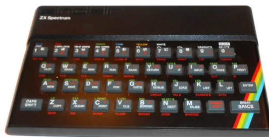
ZX Spectrum (PTE TTK informatika gyűjtemény)

A személyi számítógépek megjelenése a számítógépes kultúra ugrásszerű fejlődését eredményezte a POTE-n, hiszen a programokat zömében orvoskollégák fejlesztették.