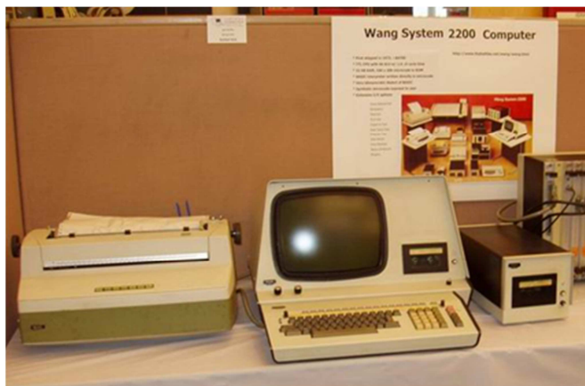
Wang 2200 munkahely ( http://www.vintage-computer.com/images/DE_VCF6/PA120013.JPG )

A kar 1986-os számítástechnikai koncepciójának [11] egyik melléklete már 41 számítógépet sorol fel, ezek között még nincs IBM PC. A kari Számítástechnikai és Automatizálási Bizottság 1987-es beszámolója [12] szerint ebben az évben már rendelkeztek néhány IBM PC XT és AT (pontosabban: ezekkel kompatibilis) számítógéppel.