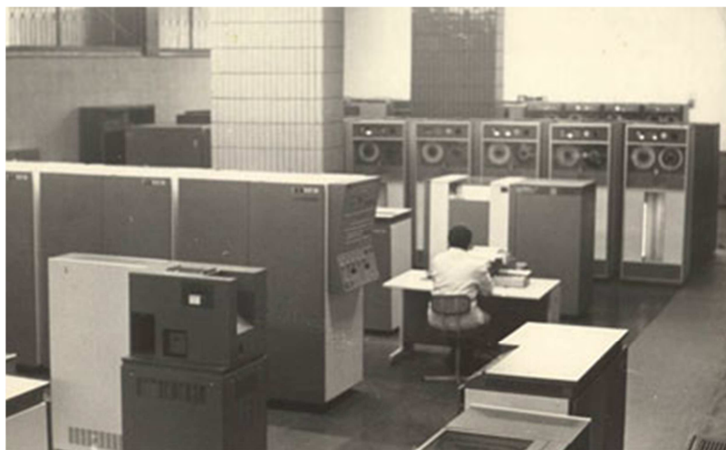
R-22 (EC-1022) gépterem

( www.computer-museum.ru/histussr/bemz_harakteristiki.htm )