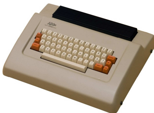
ABC-80 Svéd gyártmányú, Z80 alapú számítógép http://www.pdp-9.net/luxor-abc80