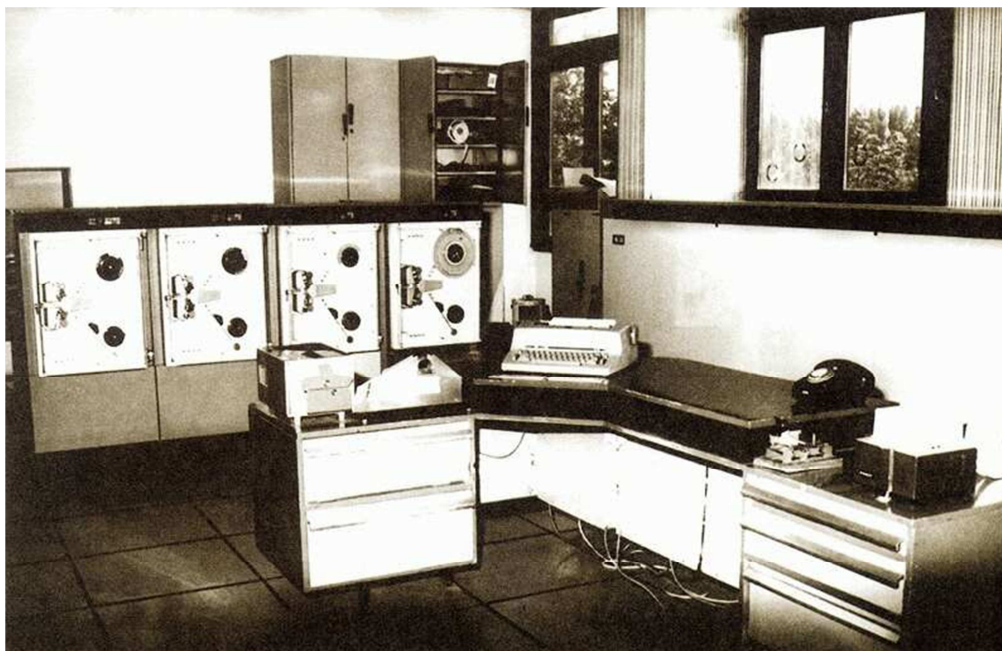
EMG-830 számítógép konfiguráció ( http://mek.oszk.hu/01900/01906/html/inde )