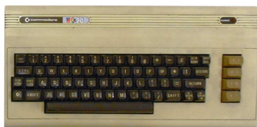
Commodore 20 (PTE TTK informatika gyűjtemény)

A rohamosan fejlődő technológiáknak köszönhetően a nyomtatott szövegek tartalmilag gyorsan elavultak, tehát egyre jobban csökkent a lelkesedés a tananyagírás iránt. Az Intézet ezért felszerelt egy mikroszámítógépes labort, és elindult a Commodore – HT kampány: egy R-20-as VT terminál, 3 db ZX80-as számítógép, 6-8 db Commodore 64 5,25"-os floppy meghajtókkal, és néhány Commodore 20-as állt az oktatók rendelkezésére.