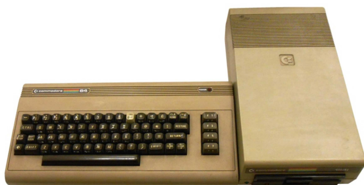
Commodore 64 floppy meghajtóval (PTE TTK informatika gyűjtemény)