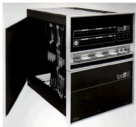
TPA 1140 központi egysége ( http://hampage.hu/tpa/tpa1140.html )

( https://en.wikipedia.org/wiki/Teletype_Model_33 )