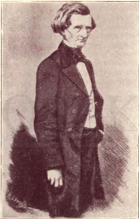
Berlioz 1862 ben (Carjat rajza után)