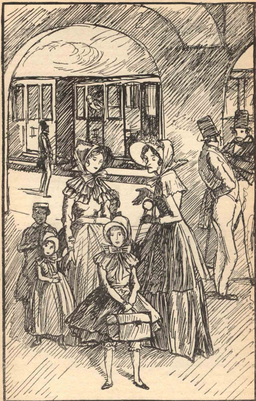
Az állomás egészen jelentéktelen volt...