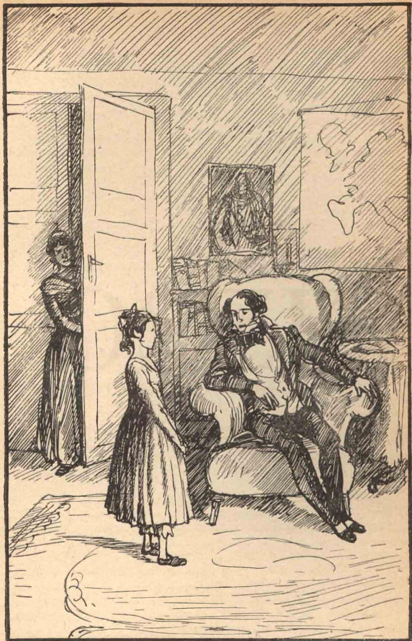
Egy úr ült a kandalló előtt egy karszékben...