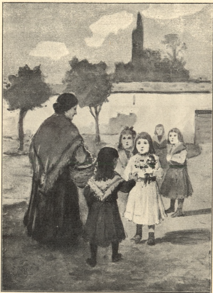
A rózsák testvére.