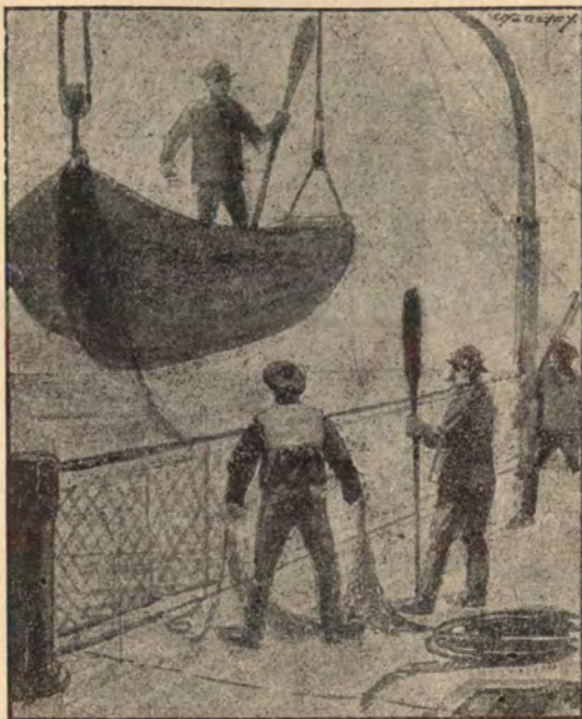
A komák felkészültek a halászatra.