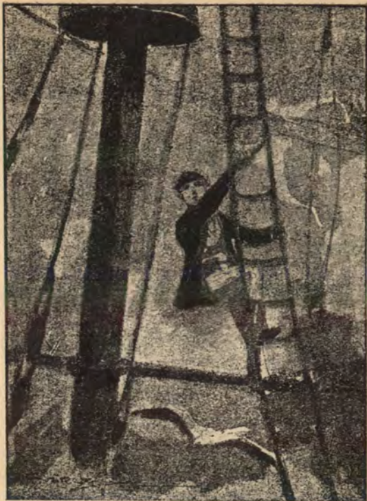
A kis kapitány macskaügyességgel kúszott az árbockosárba.

nyugtató választ nem hoz, nem merek a „Balaton“- nal közelebb menni hozzá, mert az ilyen kétharmad- részben elmerült hajó sok veszedelmet rejthet magában.