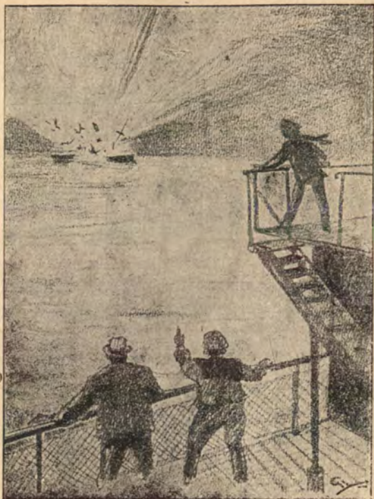
Az ellenséges cirkáló úszó-aknába ütközött.

ettől az árnyékvilágtól. Ufi mozdulatlanul ott térépelt mellette és siratta szívtépő jajongással.