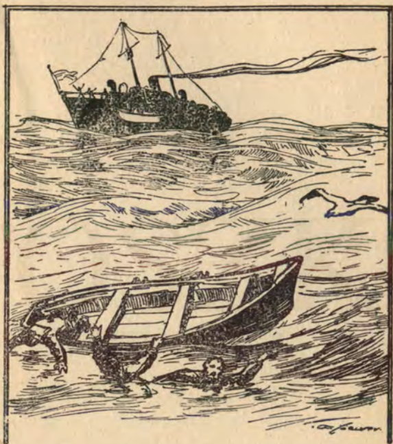
A ladik nem tudta bevárni a mentőcsónakot.

— Hát nincs nekik evezőjük, hogy valamennyire is tarthatnák magukat a háborgó vízen? Vagy annyira elvesztették a lélekjelenlétüket, hogy már