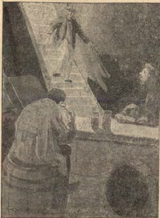
A kis kapitány gyorsan leszaladt a lépcsőn.

mert erősen behallatszott a vihar és a gránátok robbanása. Egy szörnyű durranás után minden lere-