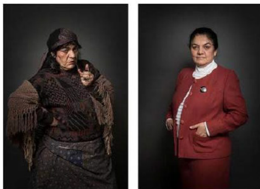
A ROMA TEST POLITIKÁJA I. Nincs ártatlan kép