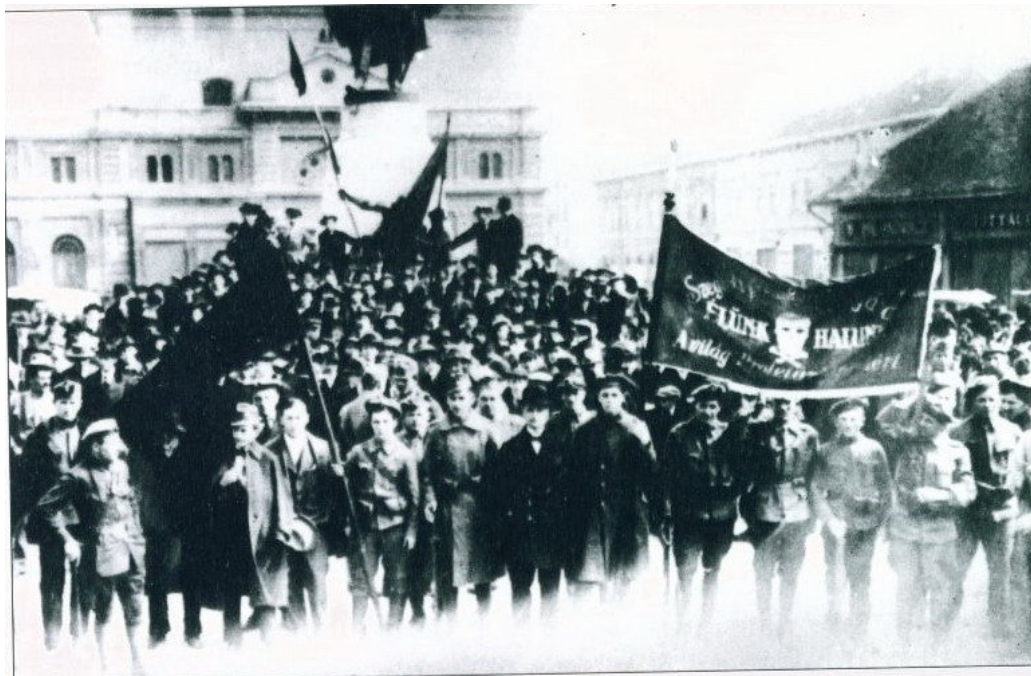
18. Az iskolát is érintette - kommün 1919