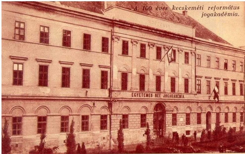
14. Az Ókollégium