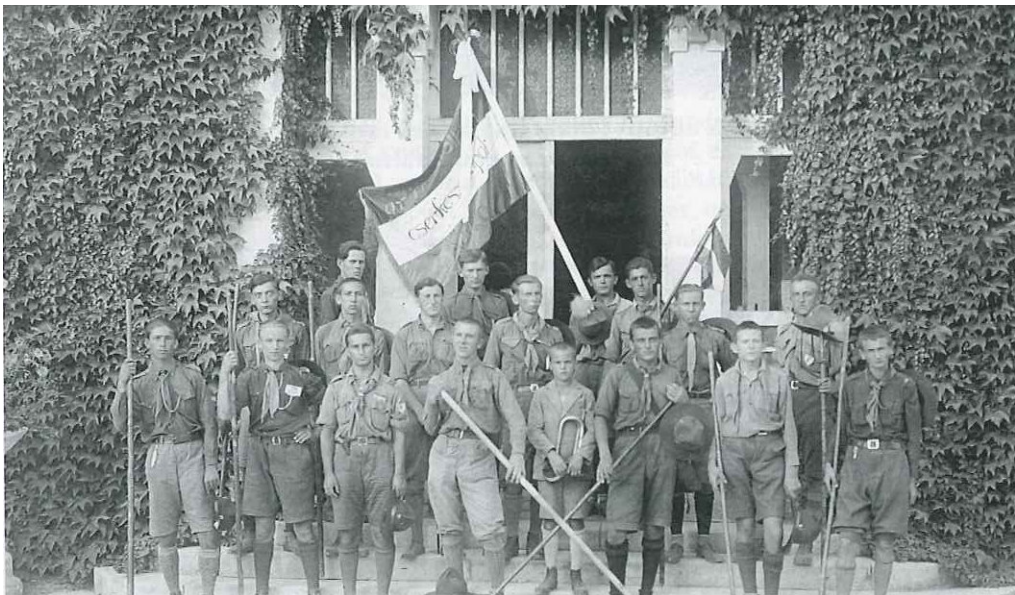
20. A Fehér Sirály Cserkészcsapat a 30-as években