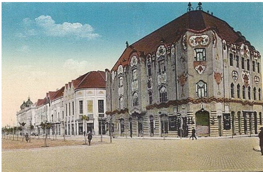
5. A századelőn kiépült Rákóczi-út