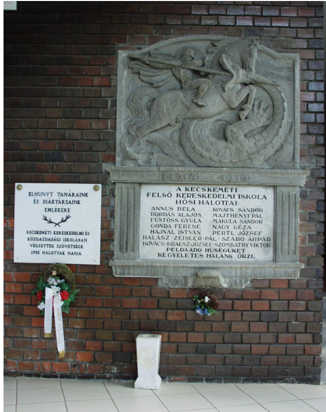
33. Az I. világháborús dombormű (Imre Gábor 1933)