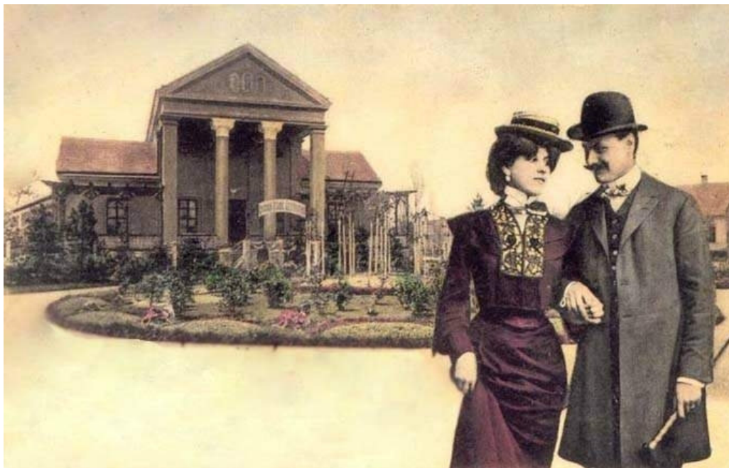
6. Kaszinó a vasútkertben 1903 körül