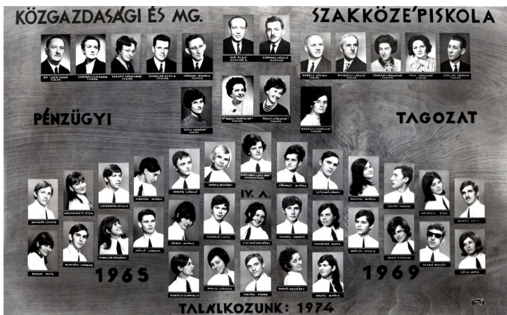
24. Tabló 1969-ből