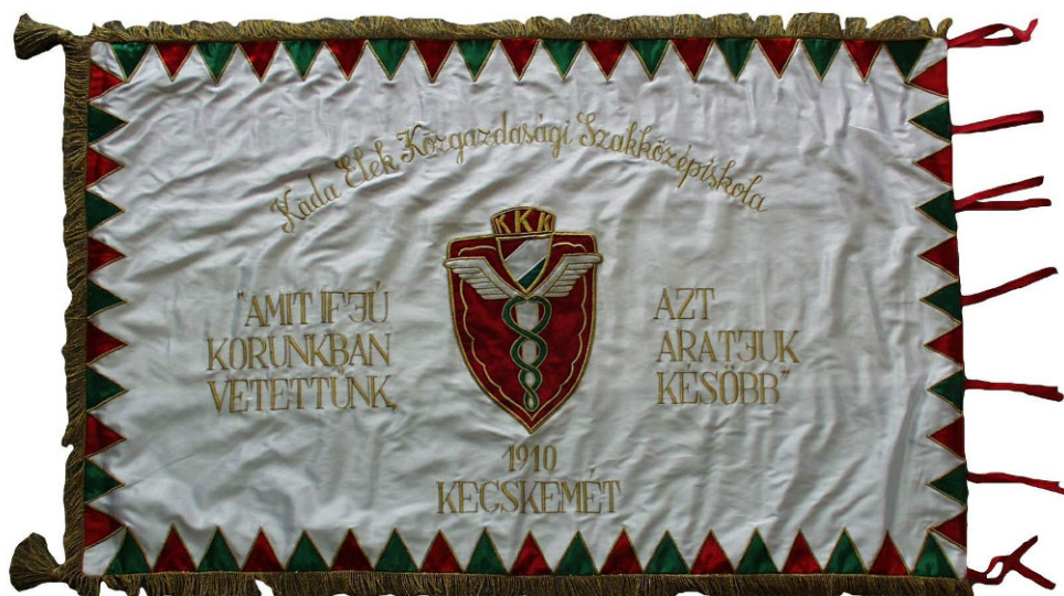
27. Iskolazászló a 90-es években