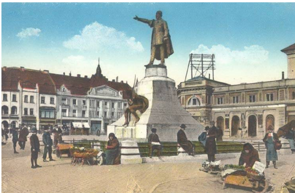
7. A Kossuth-tér az 1910-es években