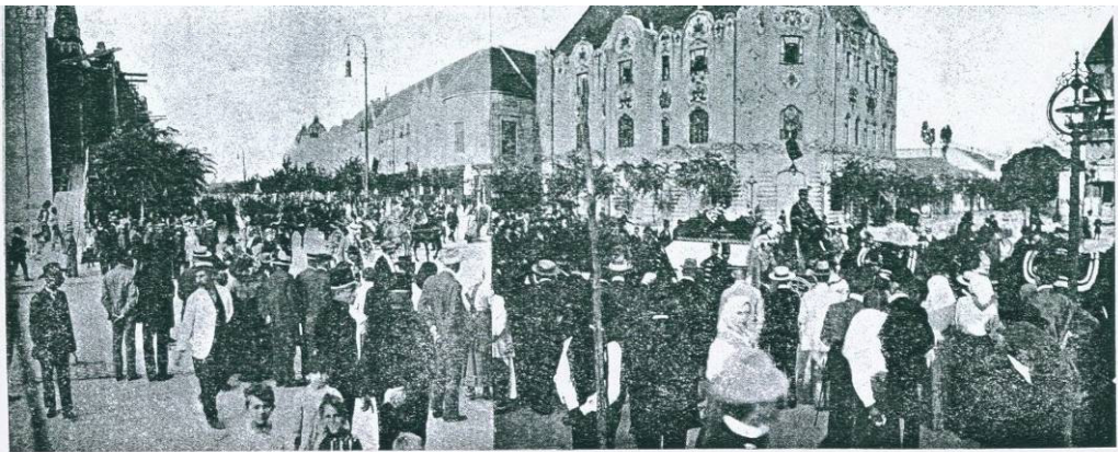
A koporsó beszállítása a városházára.