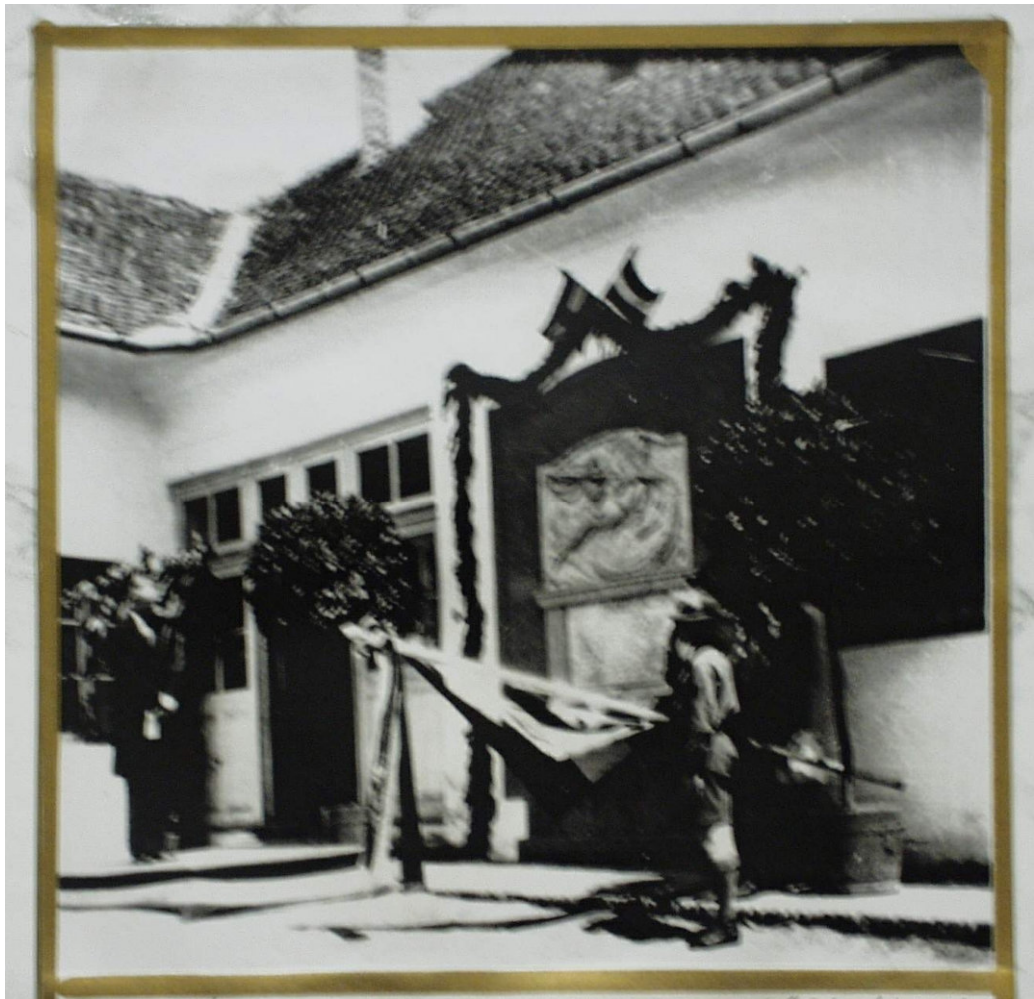
21. Emléktábla-avatás a Petőfi-utcai iskolában -1933