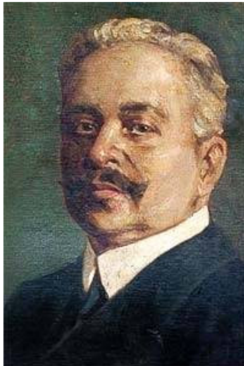
3. A polgármester