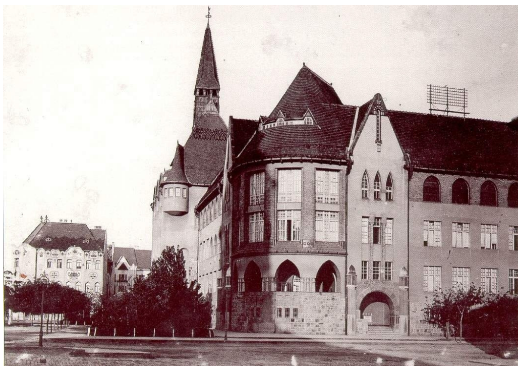
13. Az Újkollégium