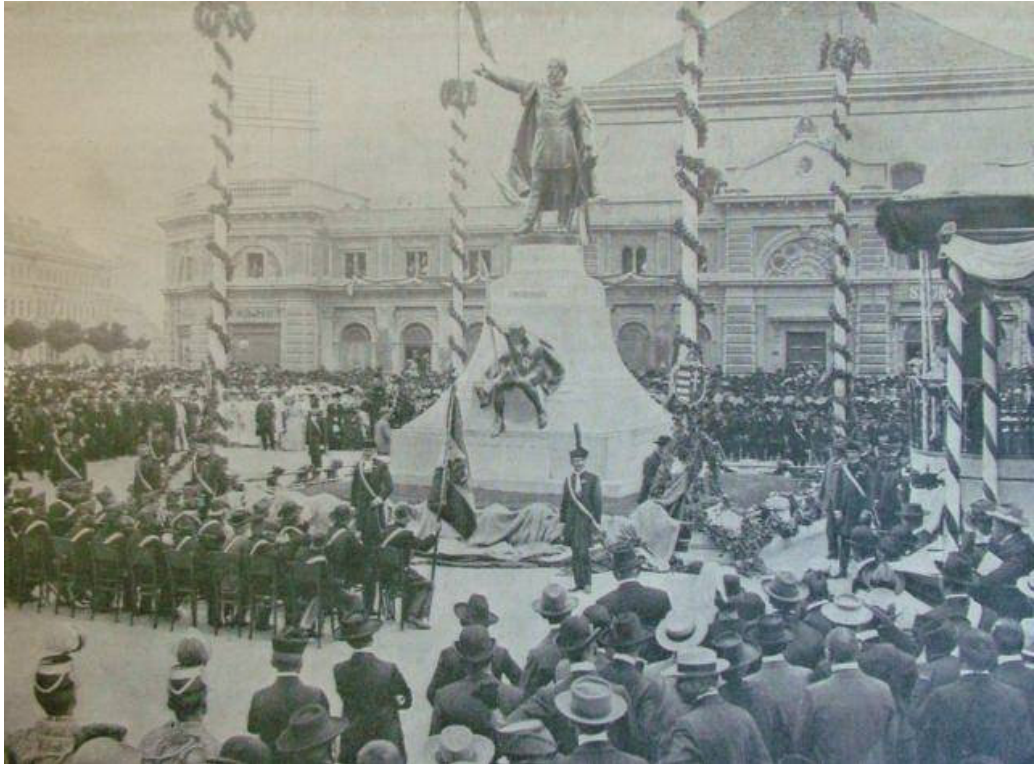
10. A Kossuth-szobor avatása 1906-ban