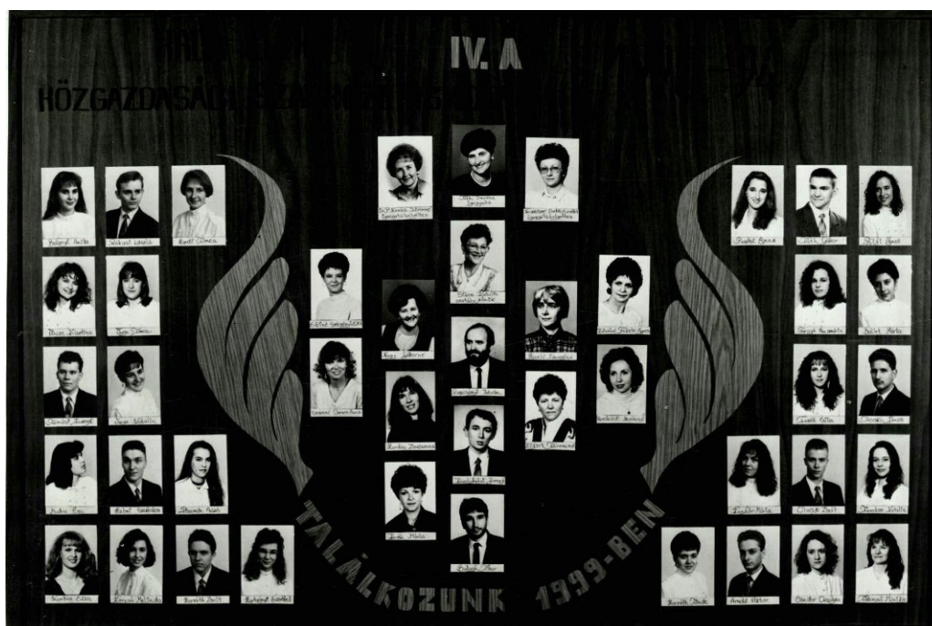
28. Tábló a 90-es évtizedből