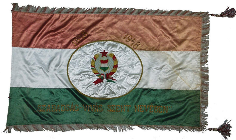
23. Iskolazászló 1948 után. A címer többször cserélődött