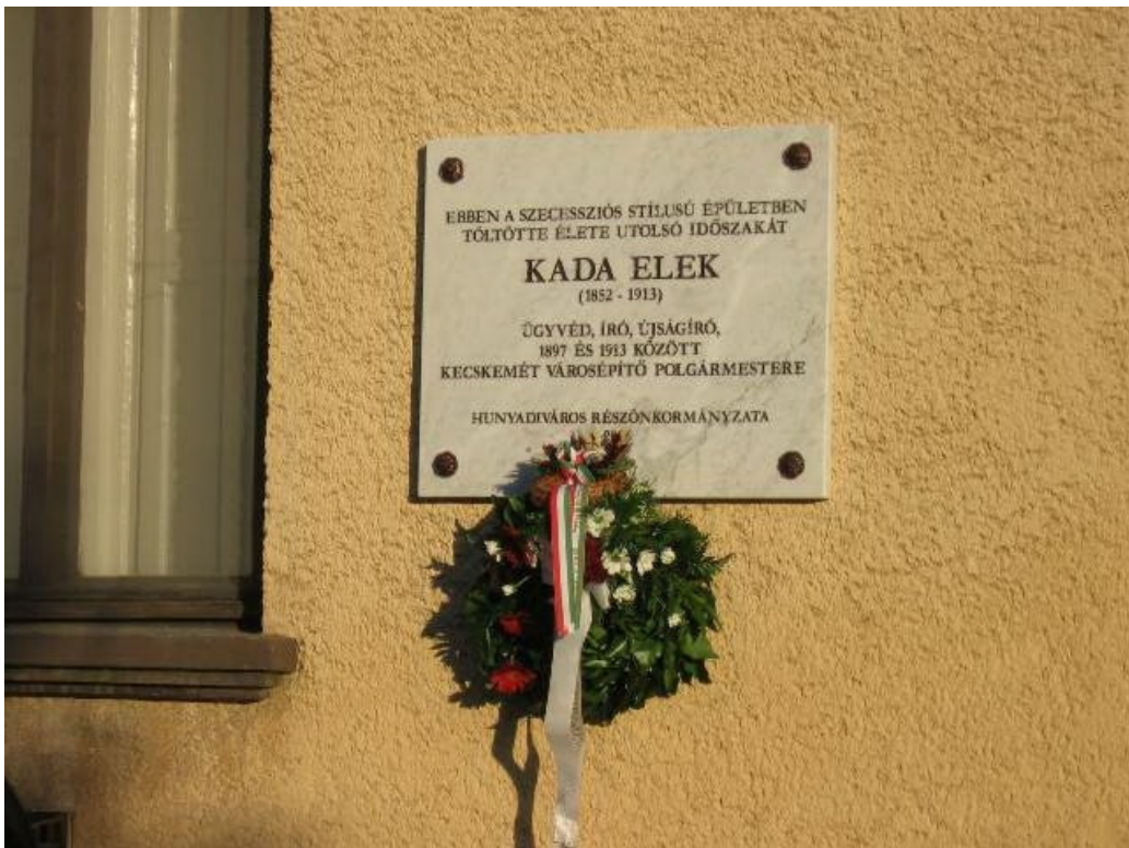
36. Ma emlékhely