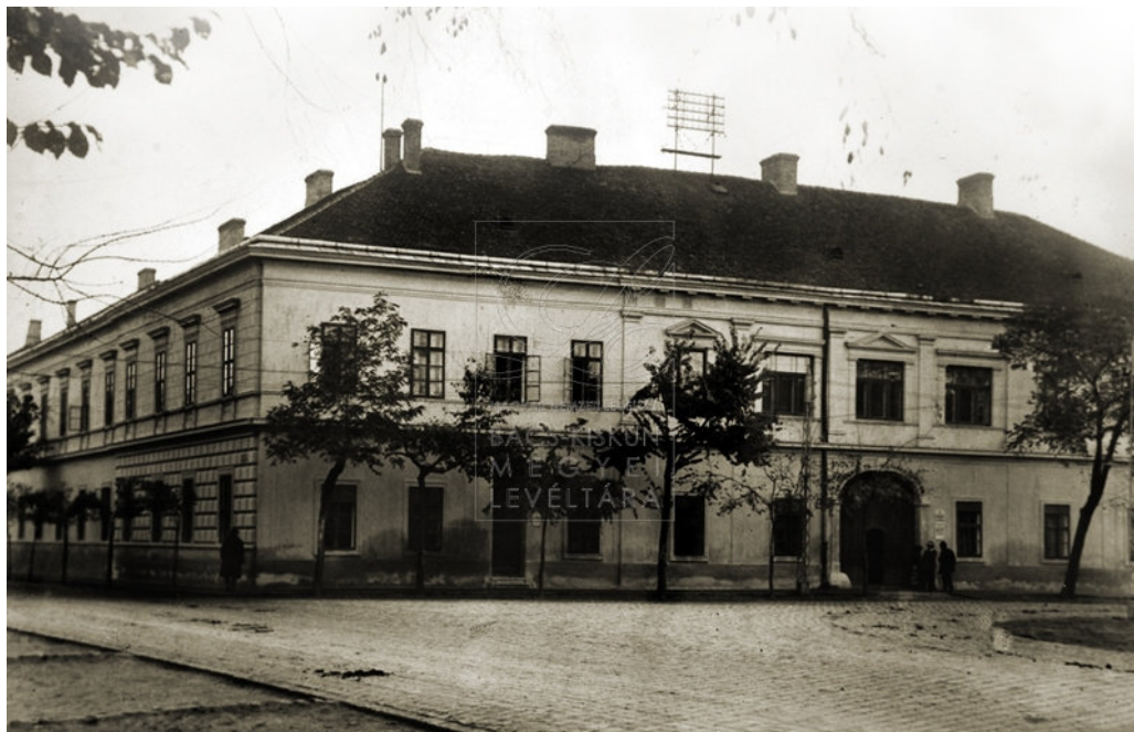
12. A Felsőkereskedelmi Iskola helyszínei: a Cserepes