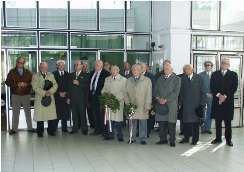
34. Öregdiákok tiszteletadása