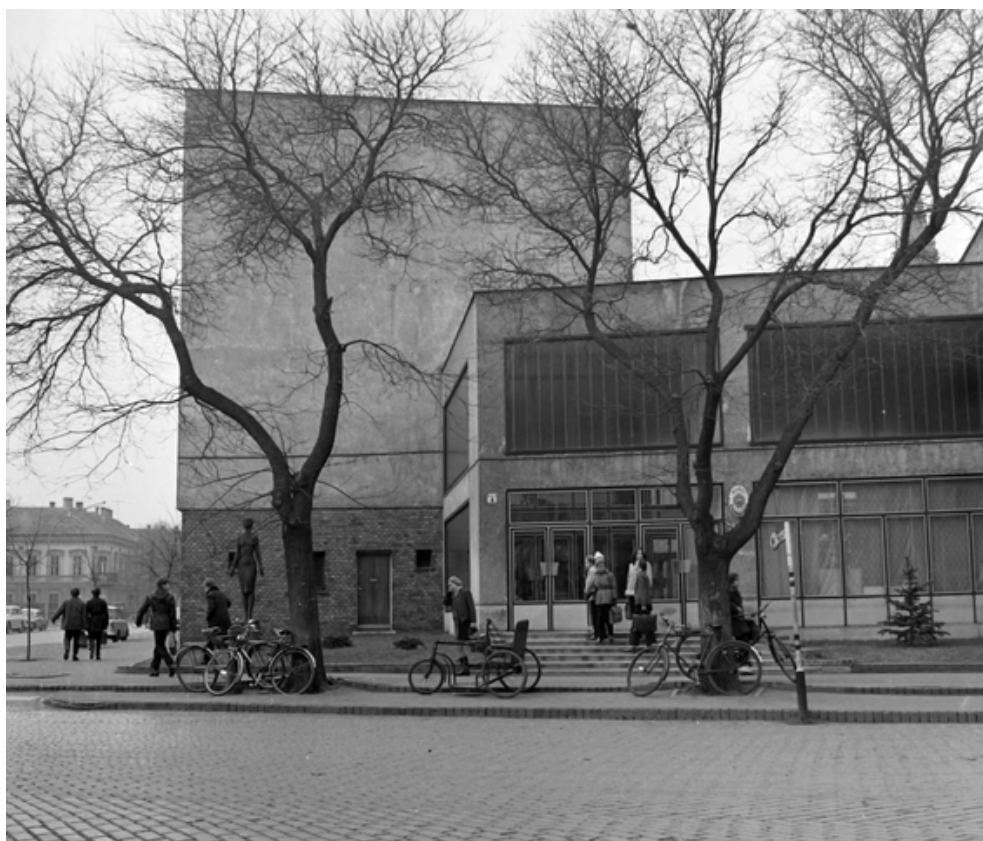
15. Katona József-tér 4.