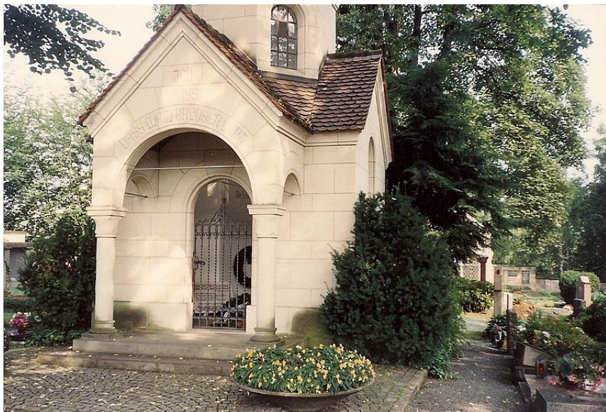
Liszt Ferenc sírkápolnája a németországi Bayreuth temetőjében

Magyar márványtábla csak 1976-ban került Liszt sírkápolnájába, rajta Vörösmarty Mihály versének első mondatával (és annak német fordításával). Halálának 90. évfordulóján helyezte el a magyar Liszt Ferenc Társaság.