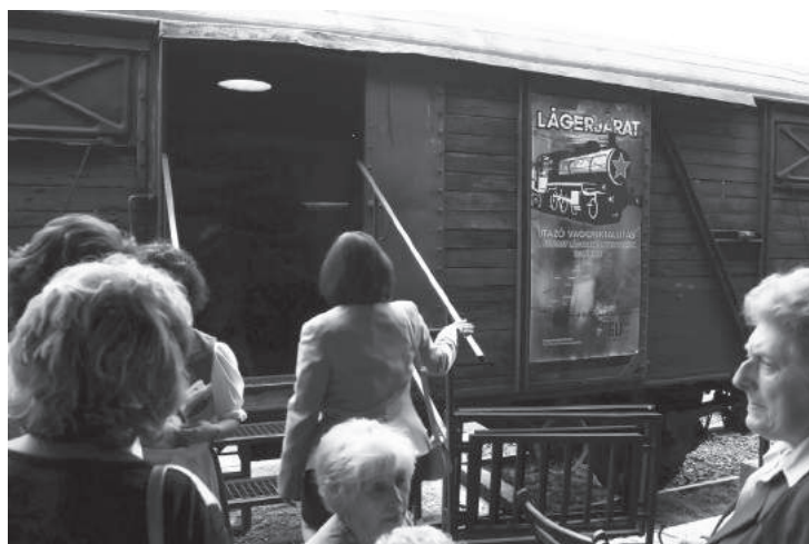
20. sz. felvétel. A Lägerjárat nyitókiállításán (2016).