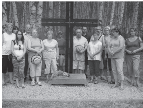
2. sz. felvétel. Kutatóúton az Uráli térségben, a pécsi Német Kör tagjai körében, megemlékezés a Szverdlouvszki területen, a malij isztoki sírkertben. (2012. június 27. – július 15.)