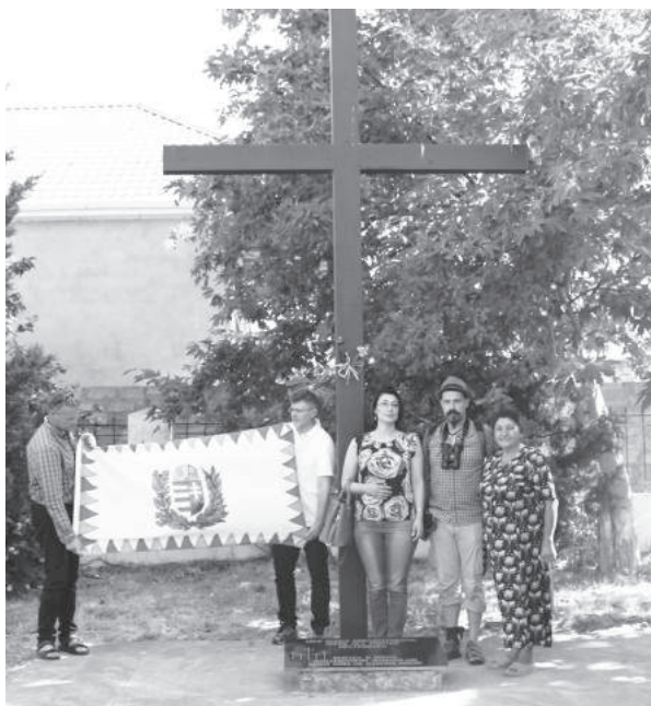
10. sz. felvétel. Azerbajdzsán, Sumgayit, a német-magyar hadifogoly-temetőben (2016. augusztus 15-27.)