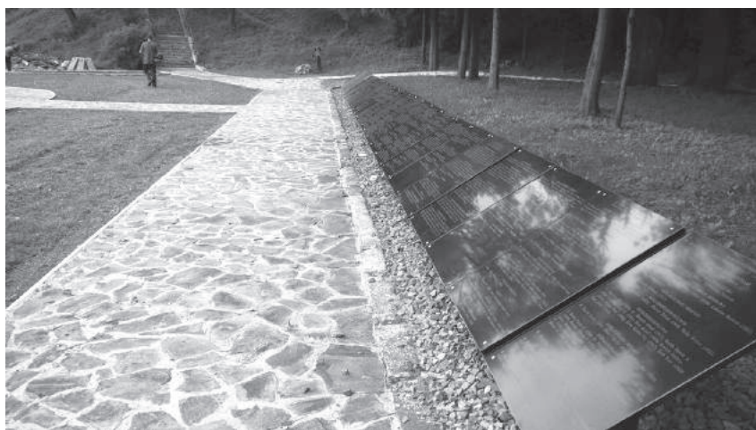
15-16. sz. felvétel. A Gulág Emlékében felújított emlékpark látképe (2016. augusztus 22.)