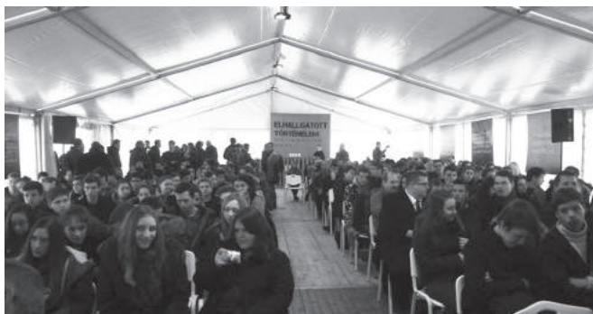
56. sz. felvétel. Rendhagyó történelmi óra a Szolyvai Emléparkban