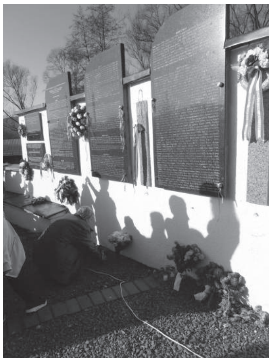
52. sz. felvétel. A hozzátartozó gyertyát gyújt a család áldozata emlékére (2016. november 19.)