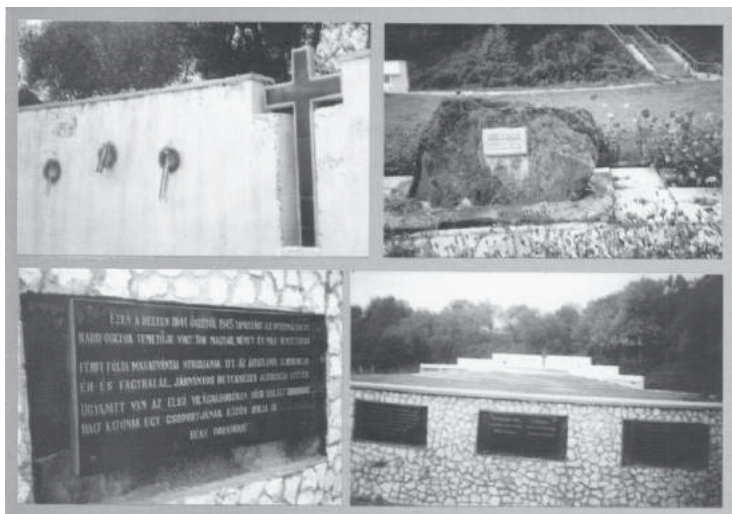
14. sz. felvétel. A felavatott Szolymai Emlékpark látképe (1995. november 19.)