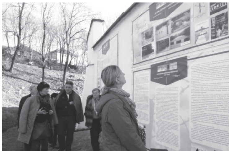
54. sz. felvétel. Ugyancsak felavatták és felszentelték a málenkij robotosok történelmi tanösvényét. (2016. november 19.)