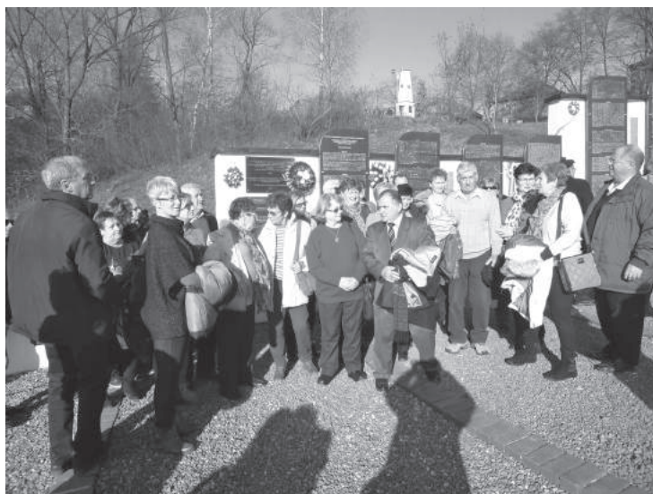
35. sz. felvétel. Történelmi zarándokút. Szolyvai Emlékpark, 2016. november 19.