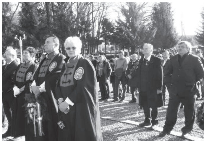
51. sz. felvétel. Jelen voltak a Vitézi Rendek, intézmények képviselői. (2016. november 19.)