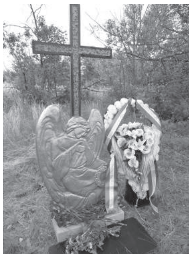
7. sz. felvétel. Baskírföld, az Oktyabrszkij melletti vasút felszámolásra ítélt temetőjében, ahol a 1701-es tábor 18 elhunyt rabja nyugszik. Sírhelyüket már eltüntették. A Lapsin Jurij, alias Arnold György által készített emlékjelet Konsztantin atya szentelte fel. (2016. június 24.–július 2.)