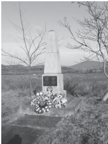
45. sz. felvétel. Útban a Szolyvai Emlékpark felé, hagyományos koszorúzás a honfoglalás kori vitéz emlékoszlopánál (Paszika).