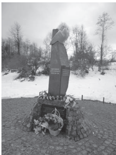
31. sz. felvétel. Történelmi zarándokút. Sztarij Szambor, az egykori lágertemetőben felállított emlékműnél (alkotója: Matl Péter), 2016. november 16.