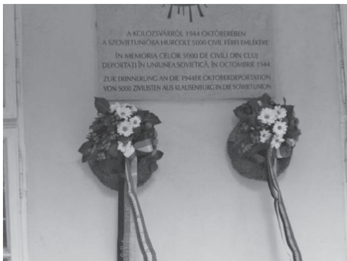
25. sz. felvétel. Történelmi zárándokút, Románia, Kolozsvár, a Házsongárdi temetőben, 2016. október