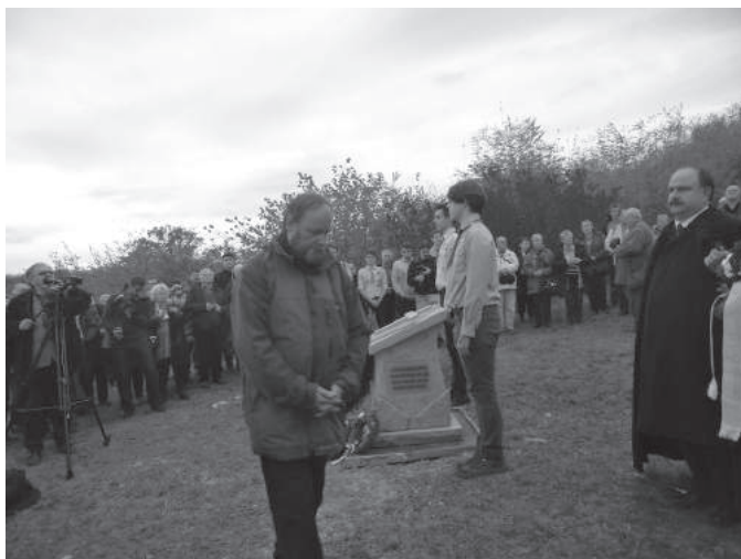
22. sz. felvétel. Történelmi zarándokút, Románia, emlékhely koszorúzás, 2016. október