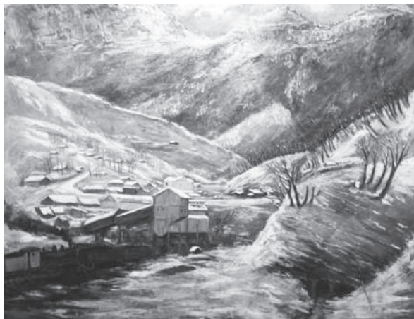
13. sz. felvétel. „Tkibuli 1948-ban” Christian Debler stuttgarti badifogolyfestménye, elől a szénbánya, a háttérben a barakkok. A festmény a Tkibuli Helytörténeti Múzeum tulajdona. (2016. augusztus 15-27.)