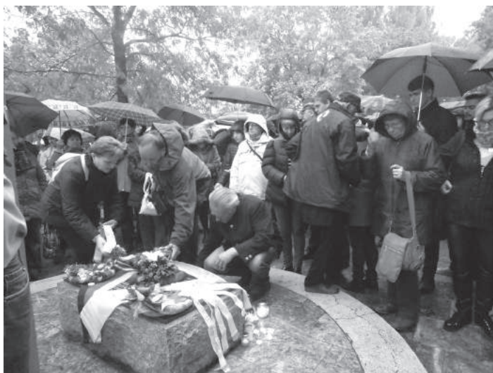
23. sz. felvétel. Történelmi zarándokút, Románia, emlékhely koszorúzás, 2016. október