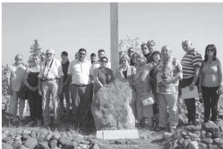
11. sz. felvétel. Azerbajdzsán, Gandzsa környékén, megemlékezés a hanlari körzeti 1552 –es hadikórház és a 498 ORB valamint a 223. hadifogolytemetőknél (2016. augusztus 15-27.)