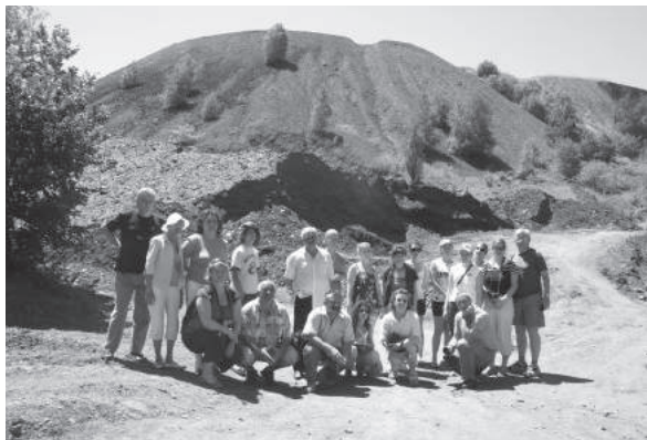
1. sz. felvétel. Kutatóúton Donyec-medencében, az egykori lágerek, temetők feltérképezése (2009. június 26.– július 4.)