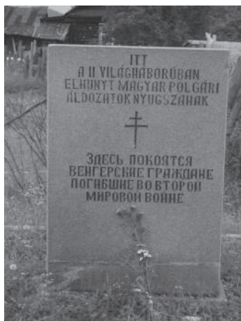
3. sz. felvétel. Cseljabinszk terület, emlékmű Verhnyij Ufalejben. (2012. június 27. – július 15.)