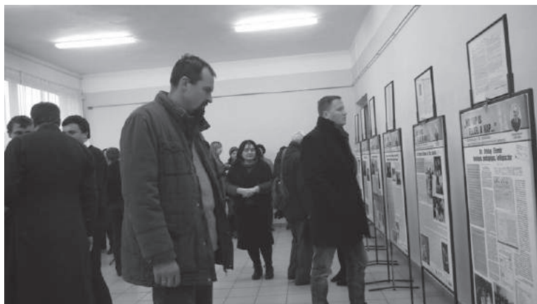
66-67. sz. felvétel. 2016. december 7. Kiállítás a meghurcolt kárpátaljai magyar országgyűlési képviselők emlékére az Ungvári Néprajzi Múzeumban.