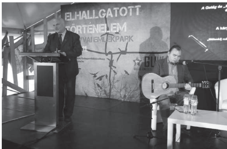
57-58. sz. felvétel. 2016. november 11. Elhallgatott történelem címmel tartottak rendhagyó történelemórát közel kétszáz magyarországi középiskolás részvételével, nemzeti zarándoklat keretében Szolyván, a sztálini terror kárpátaljai magyar és német áldozatainak tiszteletére létesített emlékparkban. Előadást tartott Dupka György, a Szolyvai Emlékparkbizottság tagja Rétvári Bence, az Emberi Erőforrások Minisztériumának (EMMI) parlamenti államtitkára, a Gulág Emlékbizottság tagja.