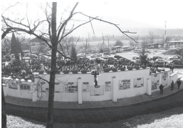
46. sz. felvétel. Az Emlékfal hátsó oldalfelületén közel tizenöt pannó magyar, német és ukrán nyelven korabeli dokumentumok, archív felvételek és fotók révén örökíti meg az 1944 novemberétől végrehajtott erőszakos szovjetizálás áldozatainak tragédiáját, a népiértáshoz is nevezhető legfontosabb eseményeket. (2016. november 19.)