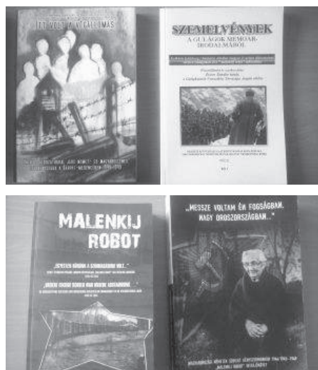
36. sz. felvétel. A pécsi Német Kör utóbbi években megjelent GUPVI-GULÁG tematikájú kiadványai.