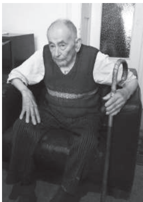
37. sz. felvétel. (Beregszászvégárdó, 2016.05.20.)