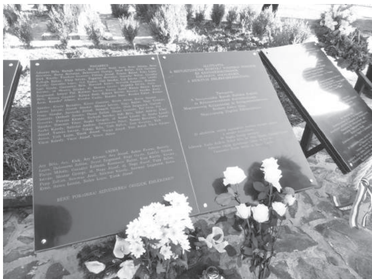
53. sz. felvétel. A fekete márványtáblakon több mint 3909 név olvasható 395 kárpátaljai településről. Ezzel közel tízezerre bővült azoknak az áldozatoknak a száma, akiknek a nevét a szolvyai emlékparkban eddig megörökítették. (2016. november 19.)