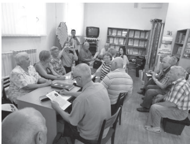
8. sz. felvétel. Baskírföld, Oktyabrszkij: találkozó a Volga-mentéről kitelepített németek leszármazottaival civilszervezetük székházában (2016. június 24.–július 2.)