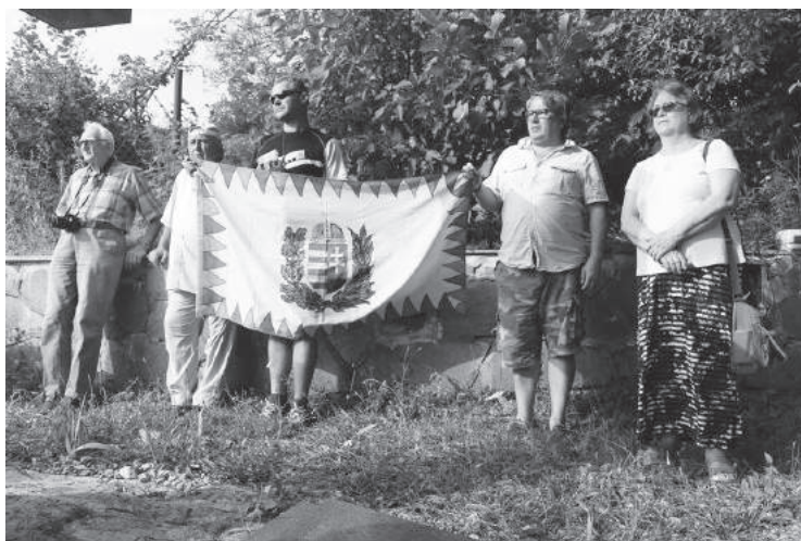
12. sz. felvétel. Grúzia, megemlékezés a Tkibuli lágertemetőben (2016. augusztus 15-27.)