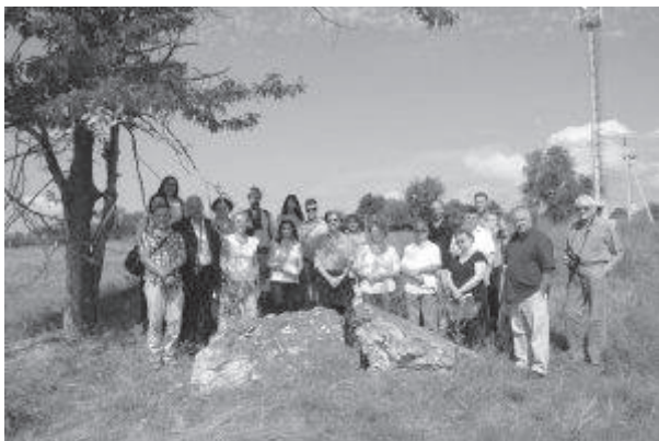
9. sz. felvétel. Történelmi zarándokút a Kaukázusban: felvétel a csecsenföldi Groznij külvárosi területén, az egykori lágertemető helyszínén készült (2016. augusztus 15-27.)