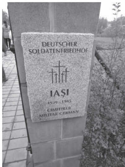
24. sz. felvétel. Történelmi zarándokút, Románia, Iasi, a Német katonai temetőben, 2016. október, Forrás: http://nemetkor.hu/category/galeria/