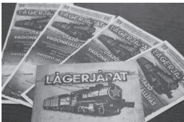
18. sz. felvétel. A Lägerjázat szórólapja (2016).