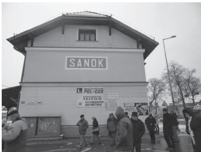
29. sz. felvétel. Történelmi zarándokút. Szanok, 2016. november 16.