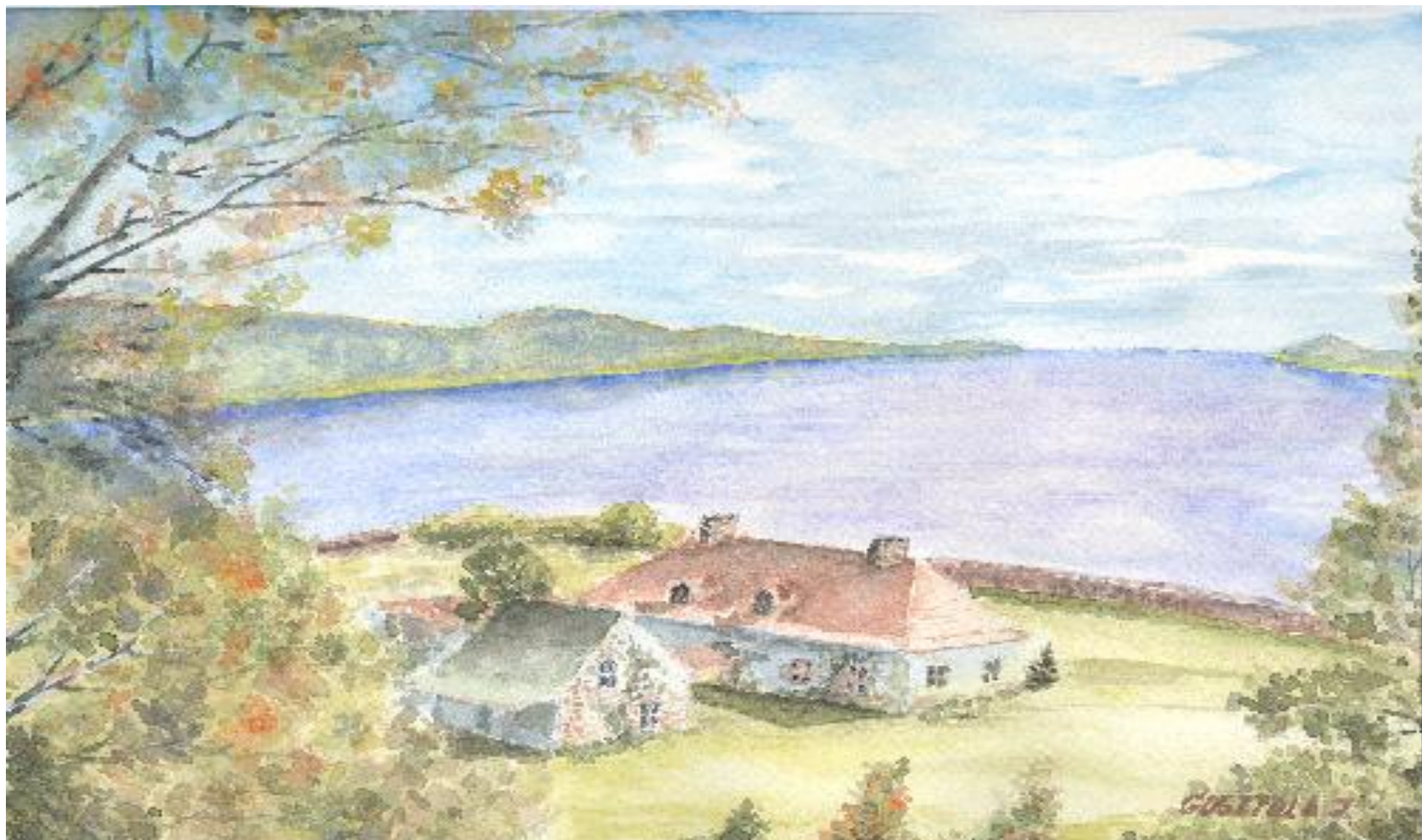
Gosztola János: Halásztanya