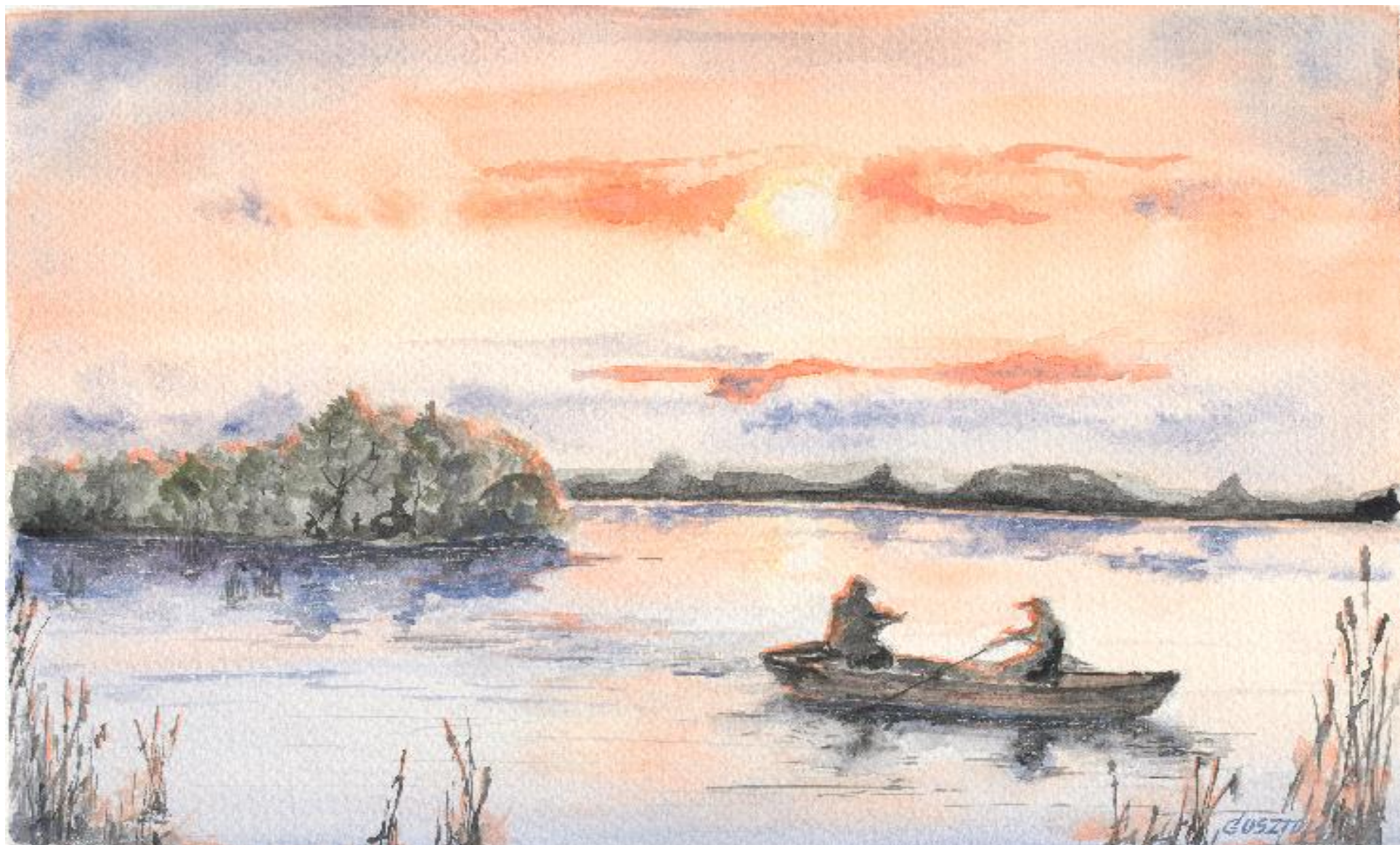
Gosztola János: Csalizók