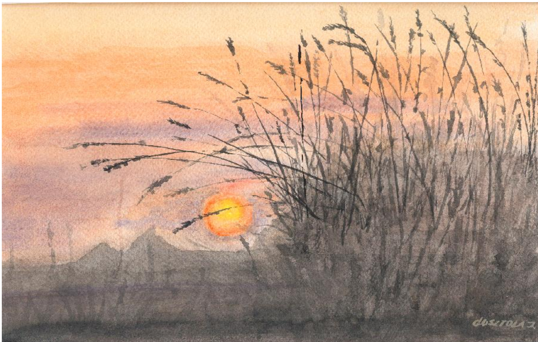
Gosztola János: Naplemente