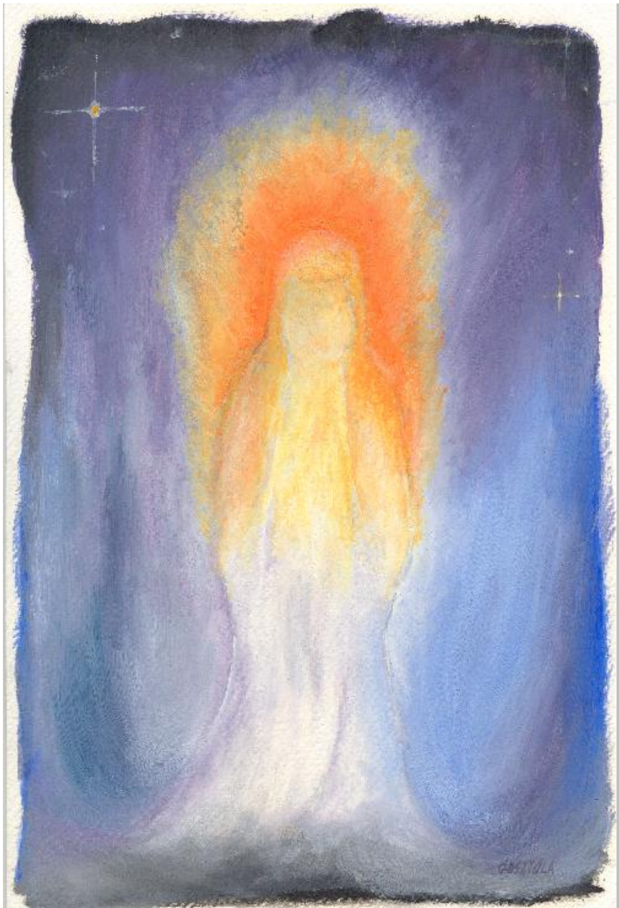
Gosztola János: Tűzangyal