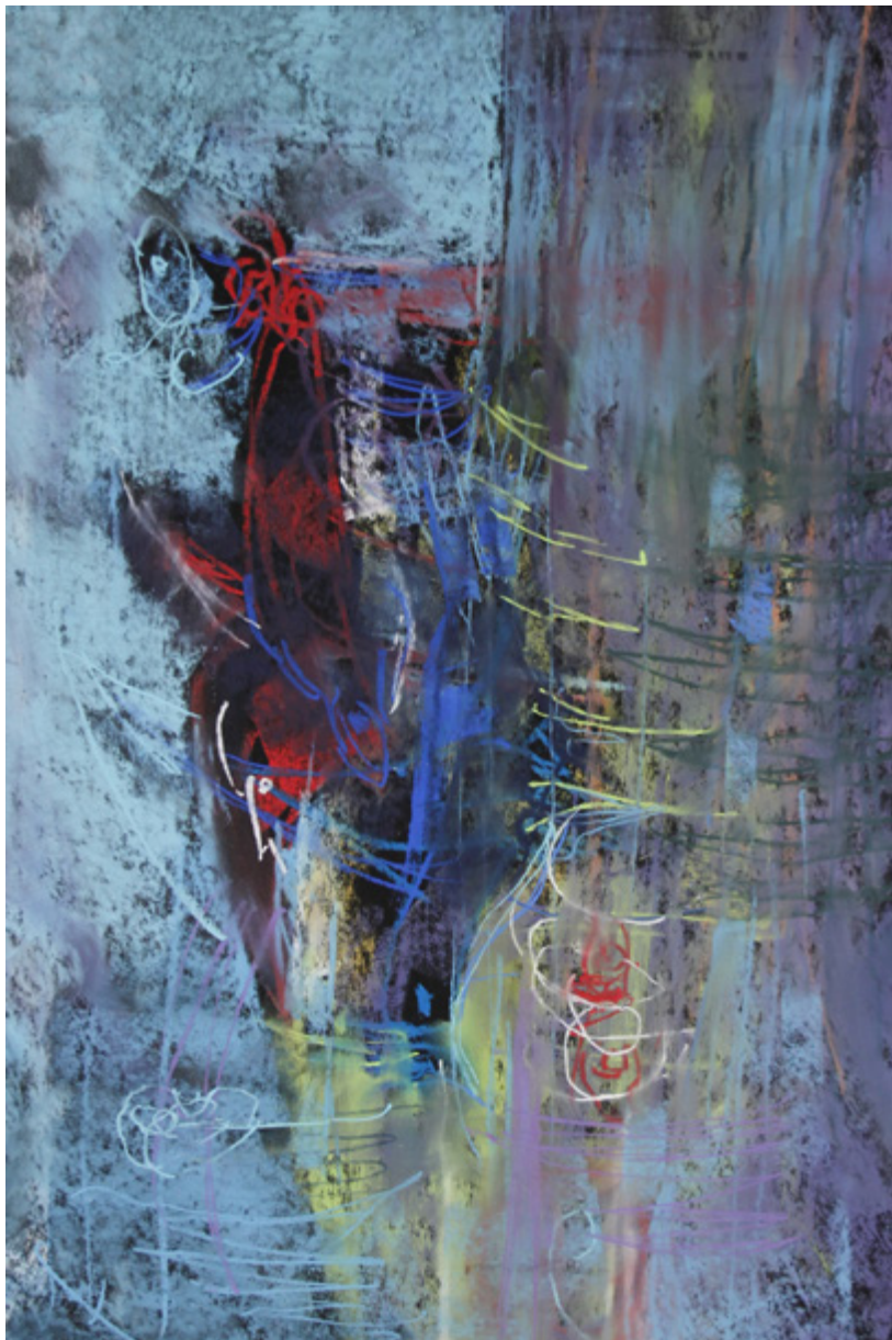
Tólos Ágota: Kék madár – pasztell kép