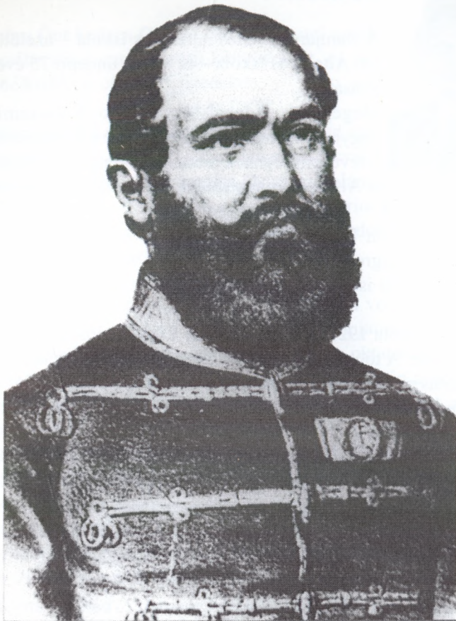
Damjanich János honvédtábornok (1804 – 1849)

„Én az elárvult szegény hazáért, E szabadságért vívó nemzetért, tűzni, tenni és ha kell, meghalni tudok.”