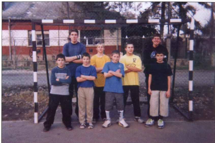
A fiú focicsapat 2003-ban.