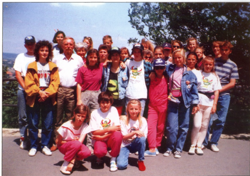
CSIPERÓ -Galántai csoport 1993-ban.