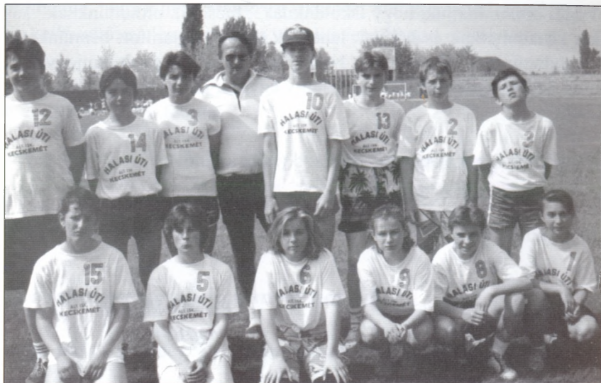
Fiú labdarúgók és a „fruskák” leány focicsapata 1991-ben.