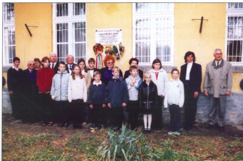
Koszorúzás Vitéz Vécsey Jenő emléktáblájánál 2003-ban.