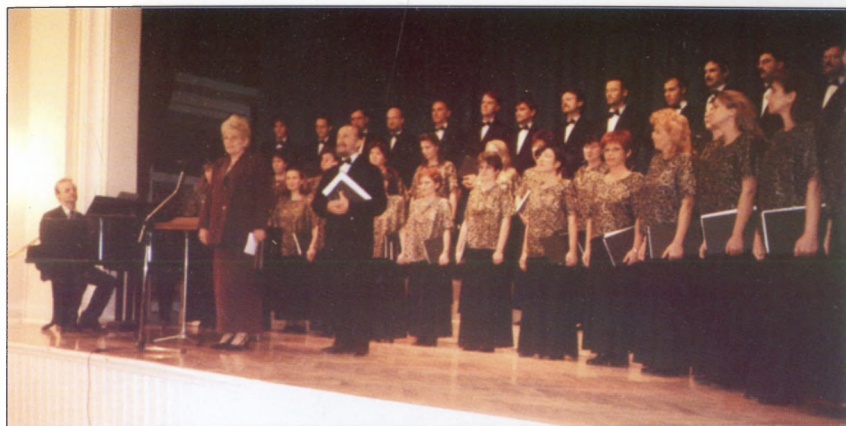
A Pedagógus Énekkar adott jótékonysági koncertet az iskola javára 2002-ben.