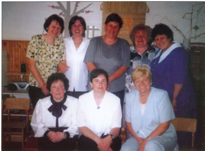
A Matkói Óvoda nevelőtestülete: