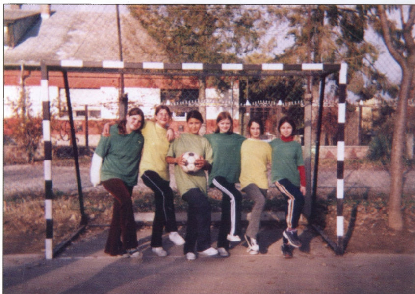
A leány focicsapat 2003-ban.