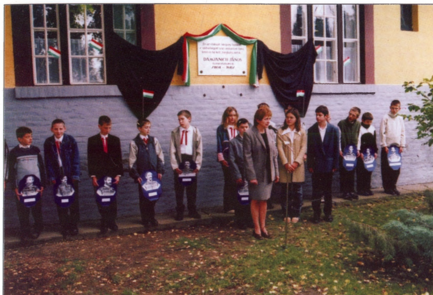
Megemlékezés október hatodikán az iskola Aradi Vértanúk Emlékparkjában, 2003-ban.