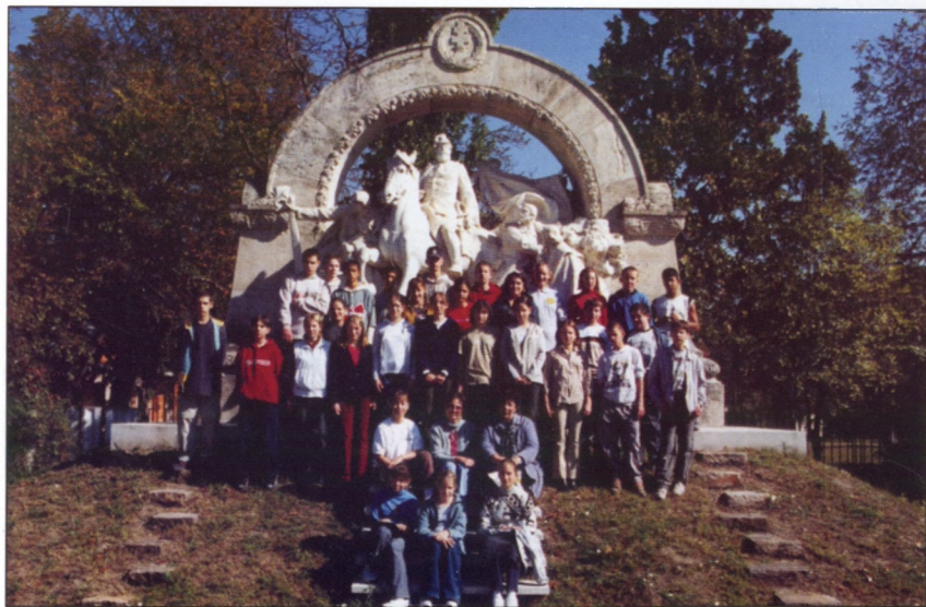
A tanulók egy csoportja Szolnokon, a hős tábornok szobránál 2002-ben, a Damjanich Napok keretében megszervezett egész napos iskolai kiránduláson