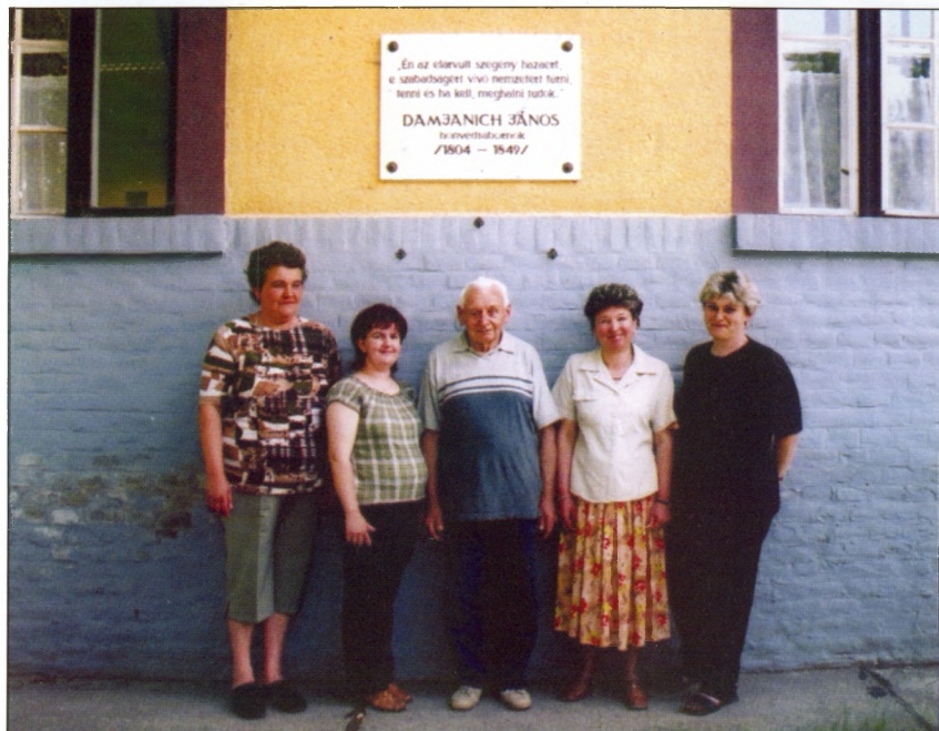
Technikai dolgozók 2004-ben: