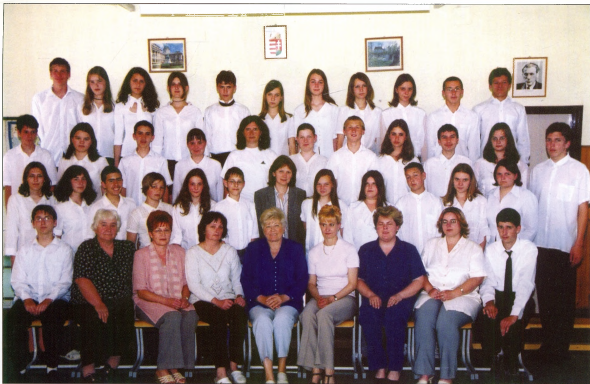
A ballagó 8. osztály 2004-ben.