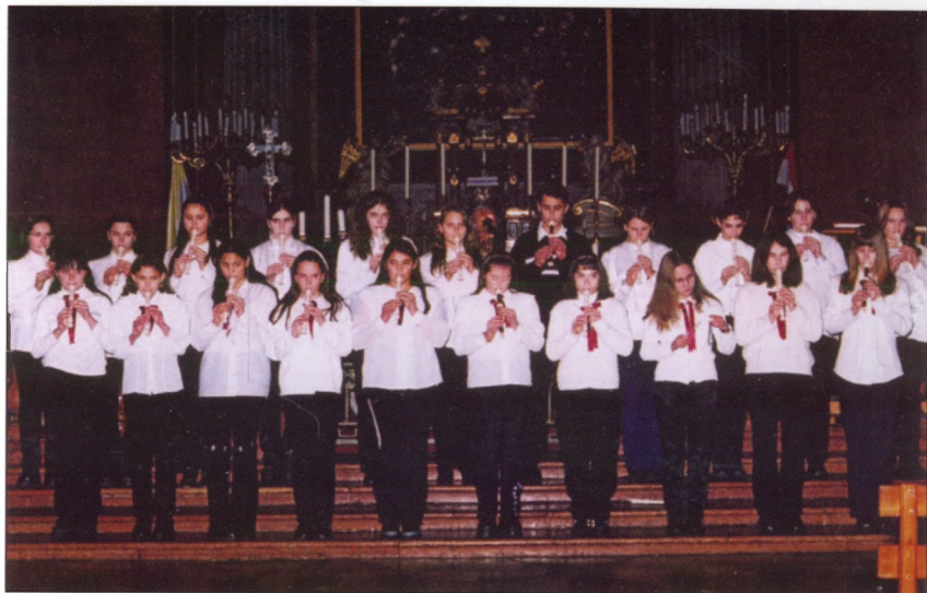
Karácsonyi Koncert 2001-ben a Nagytemplomban. A képen iskolánk furulyakórusa.