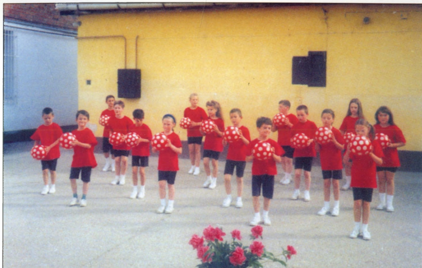
Anyák napja az első osztályban 2000-ben.