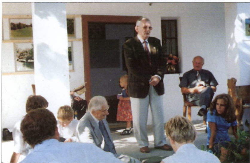
Kiállítás megnyitó a sárszentlőrinci Közösségi Házban