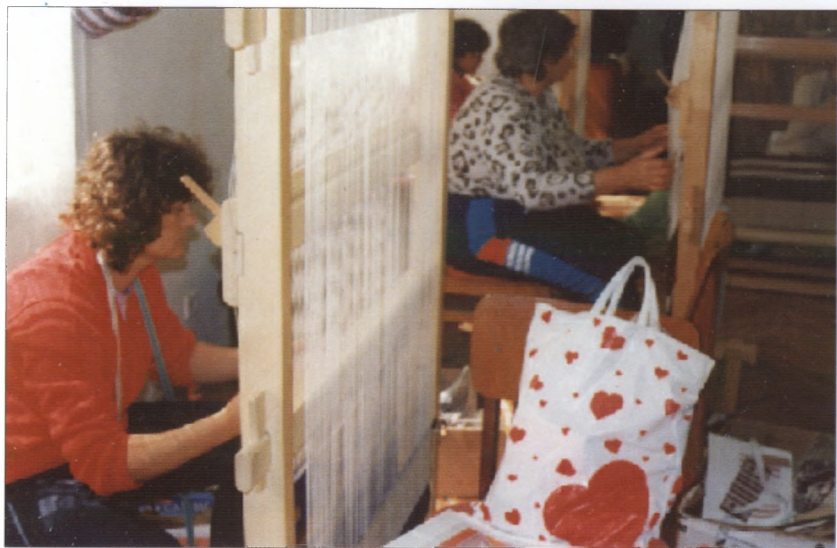
Szövőőnök munka közben