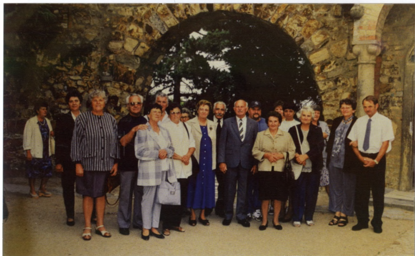
Kirándulás a Bory-várhoz