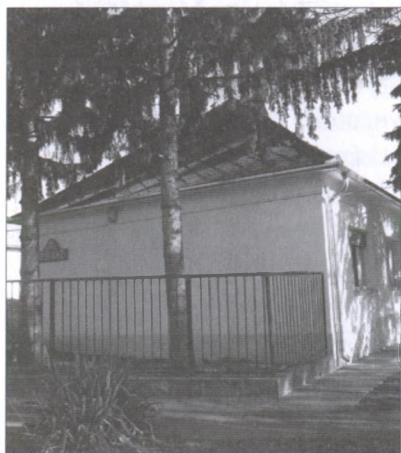
A Teleház épülete