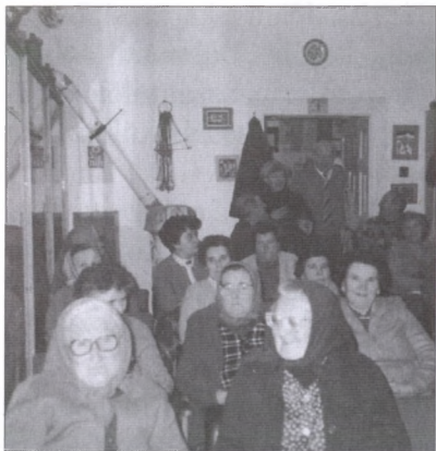
Az első népfőiskolai összejövetel Uzdon, a Fördös-kúriában

Hatvan év pedagógiai, illetve közművelődési szolgálatom alatt gyakran kellett vagy illett kisebb-nagyobb írásokat, dolgozatokat készítenem. Nem áll messze tőlem ez a műfaj. Hosszabb lélegzetű