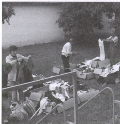
Ruhaosztás a Községi Ház udvarán

Az alapítvány már az alapító okiratában nevesítve is – többek között – az idősek, rászorulóknak segítségét tűzte ki célul. A helyi viszonyok ismerete (előregedő település, nagyarányú munkanélküliség, szociális problémák) egyértelművé tette, hogy minden kínálkozó lehetőséget meg kell ragadnunk ahhoz, hogy segítsük a falu lakosait. A 2001-ben indult tele-