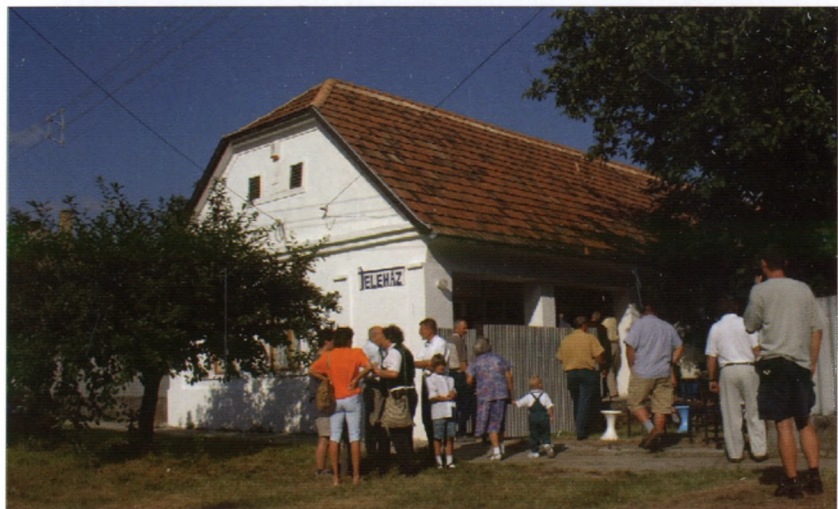
A Közösségi Ház avatása