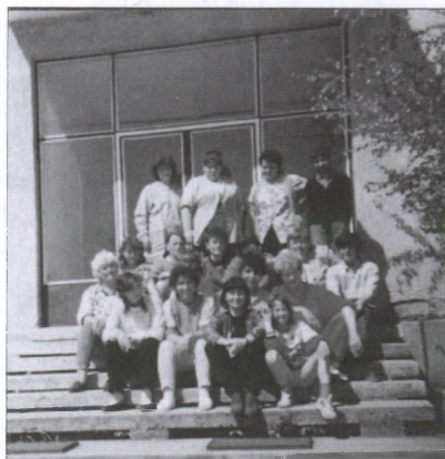
A szövőtanfolyam résztvevői a volt pártház lépcsőjén

Erről az időszakról – ami egy évnél is tovább tartott – külön regényt lehetne írni. A munkaügyi központtól csak az asszonyok béréhez kaptunk támogatást, szakmai vezető bérét saját erőből kellett volna előteremteni – ha lett volna honnan. Így valódi összefogással, saját erőből, különféle próbálkozások által tartottuk fenn a műhelyt 1995 júniusától 1996 novemberéig. Árusítással egybekötött kiállításra több ízben is meghívtak minket a paksi könyvtárgalériába, a szekszárdi művelődési házba, a paksi és a nagytarcsai evangélikus gyülekezetbe, bemutatták munkáikat és mesterségüket asszonyaink a váraljai Szélrózsa Ifjúsági Találkozón, a Deák Téri Evangélikus Gimnáziumban, még Németországban egy Kirchentag-ra is eljutottak. A Bonyhádi Evangélikus Gimnázium új kollégiumi szárnyának a falait és a padlóját is a lőrinci szövőműhely falvédői, szőnyegei díszítik. Látszik, hogy a szövőműhely több mint egy éven át való életben