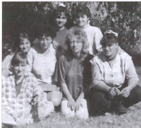
A fiatal foglalkoztatottak egy csoportja

egy épülettel gyarapodtunk. A gyülekezet a kártalanítás során az elvett iskolák, nőegyleti ház helyett pénzbeli kártalanítást és az