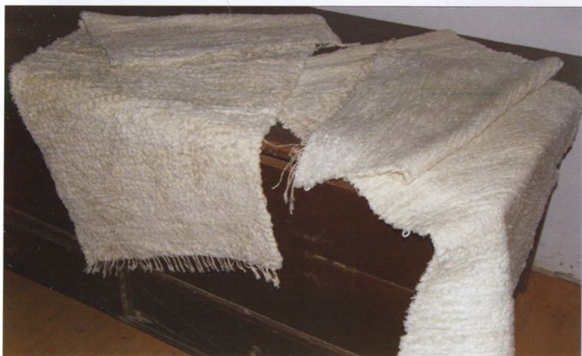
A műhelyből kikerült faliszőnyegek