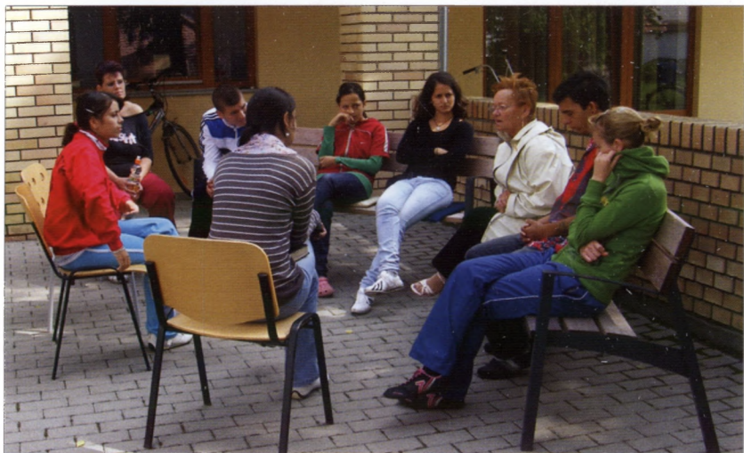
Egy Biblia-kör a „Közös Asztal” táborban a parókia udvarán