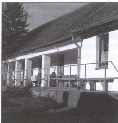
...és felújítás után