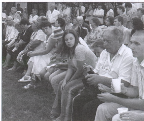
Népfőiskolai rendezvény hallgatói a közösségi ház udvarán

részben önerőből (férjem sok munkája árán), részben szakemberek segítségével rendbe hoztuk. Ez az épület lett az első Teleházunk, az ún. Községi Ház. Ma itt van az idősek napközije. Nyári rendezvények, közös ebédek kiváló szintre az udvara. Kertjében körtés, meggyes növekszik. Itt laktak önkéntes munkatársaink is. Több éven át búcsúi kiállításainkat, közösségi délutánjainkat is itt szerveztük. Később még