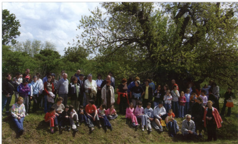
A Lázár Ervin Baráti Kör megalakulása a Nagyszederfánál Alsó-Rácegresen