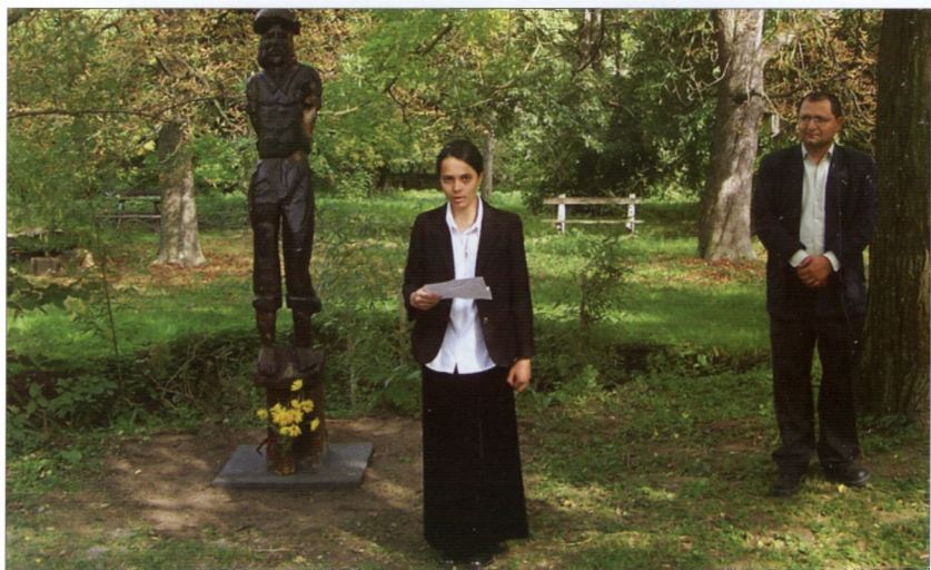
A sasosi emlékszobor ünnepélyes áthelyezése a Fördös-kúria udvarára