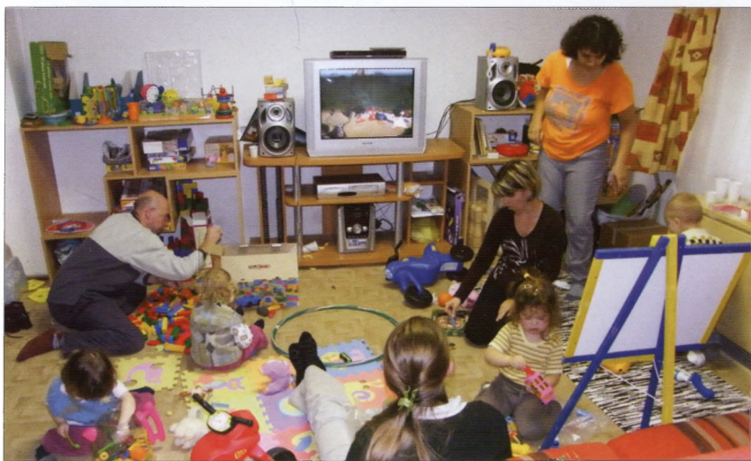
Élet a Biztos Kezdet Klubban