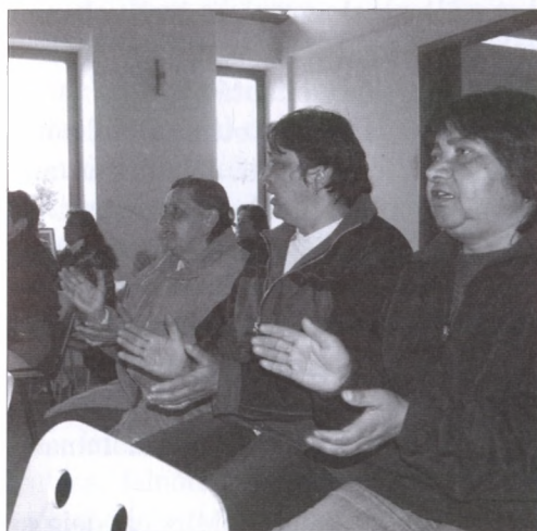
Életkép a cigány Biblia-iskoláról

és elindult egy kiadványsorozat is Lázár Ervin Füzetek címmel.