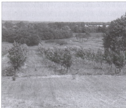
A gyümölcsös a Községi Ház kertjében

volt hatóságilag ellenőrzött szaporítóanyagunk, a holland csemeték árával nem tudtunk versenyezni, így elhatároztuk, hogy az alapítvány rendelkezésre álló területein a gyümölcsfa növényeket elültetjük és gyümölcstermesztéssel biztosítunk foglalkoztatást.