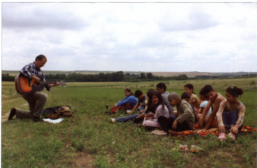
Szabateri tanoda Pusztahencse határában