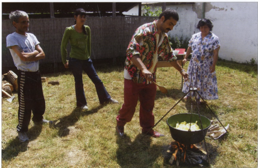
Cigányételek bemutatója a Községi Ház udvarán