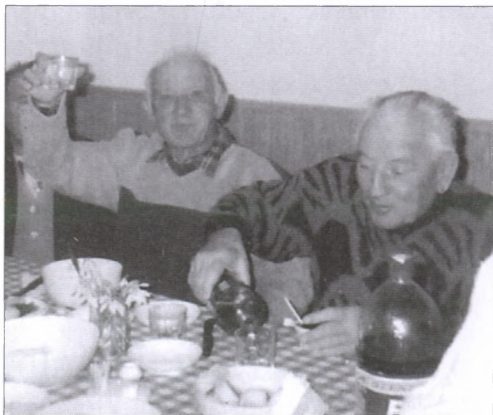
Jó hangulat az évadzáró vacsorán

Kedves barátom! A Jóisten tartson meg jó egészségben, boldogságban, hosszú éveig! Örülök annak, hogy a faluért ilyen sok mindent tettél.