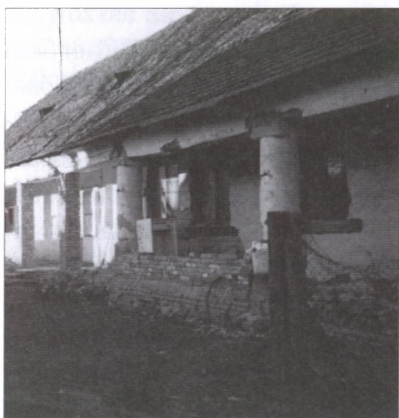
A Községi Ház felújítás előtt...

A Magyarországi Evangélikus Egyház segítségével megvettük az alapítványnak a Petőfi utca 31. szám alatti romos házat, ezt