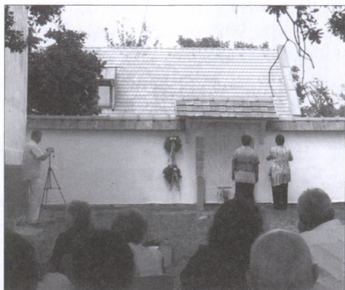
A Tanítók fala megkoszorúzása az avatási ünnepen

az önkormányzattal karöltve. Hagyománnyá vált az író születésnapján megtartott Lázár Ervin Napok elnevezésű rendezvény,