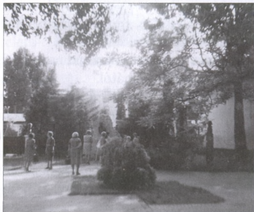
Kirándulás Kiskőrösre a népfőiskola lelkes csoportjával

Emlékezésemben helyet kell adnom azon események felidezésének, amelyek szorosan illettek a népfőiskola húsz évének programjába. Helyben kezdődött a tájolásunk, melynek eredményeképpen a 250 lelkes település nevezetes házait, volt tulajdonosait, majd a tévétorony legkorszerűbb technológiáját, a halastavak látványát, Sárszentlőrinc, Alsó- és Felsőrácegres emlékeit ismerhették meg a hallgatók. Felejthetetlen kirándulást tettünk – akkor még kedvezményes áron – Kiskunhalas, Ópusztaszer, Kiskőrös, Kecskemét és Dunaföldvár látványaiban gyönyörködve. Azután Székesfehérvár Bory-vára, Budapest nevezetességei (Hadtörténeti Múzeum, Parlament, Halászbástya, Városliget, Mezőgazdasági Múzeum) és Szentendre látványai nyugtáztak le bennünket. Majd a Komáromi várerőd... Következő utunk Simon-tornyán és Ozorán át Pannonhalmára vezetett.