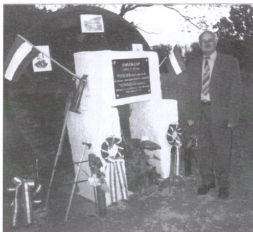
A kismalomi emlékmű

Megtisztelte műsorunkat a polgármester és két országgyűlési képviselőnk is. Népfőiskolásaink bíznak abban, hogy hosszú időn keresztül emlékezteti a látogatókat e két létesítmény történelmünk jeles alkalmaira.