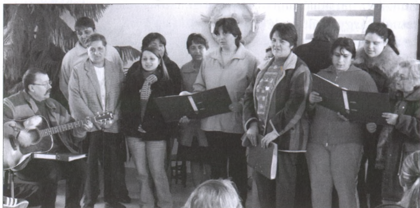
Éneklés ádventi istentiszteleten