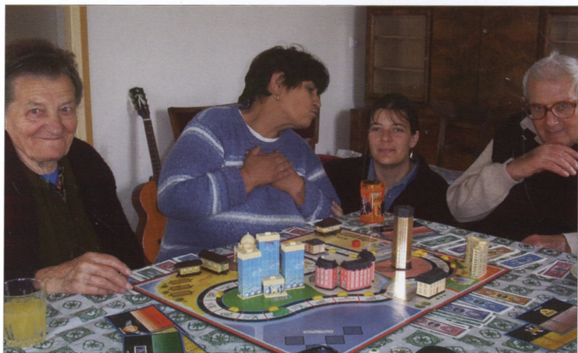
Idősek napközije a Községi Házban