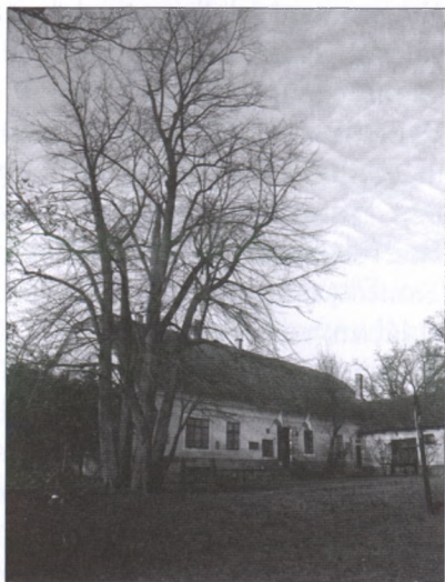
A népfőiskola első otthona, a Fördőkúria, udvarán a Hét vezér-facsoport