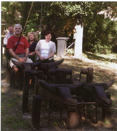
A faragott Négyökrös szekér a Fördös-kúria udvarán