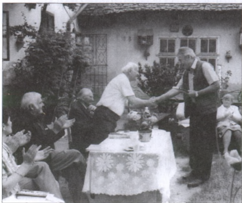
Ünnepi évadzáró oklevélátadás

a népfőiskolának a programja, szinte felsorolni is lehetetlen, annyi minden történt. A megyei városi gimnáziumnak sok tanulója (úgynevezett ifjú tudorai) sokrétű előadásokat tartottak. A második világháborút túlélő idős emberek elmesélték azokat a borzalmakat, amiket átéltek. Sajnos azóta már mind elköltöztek az örökkévalóságba, de hála