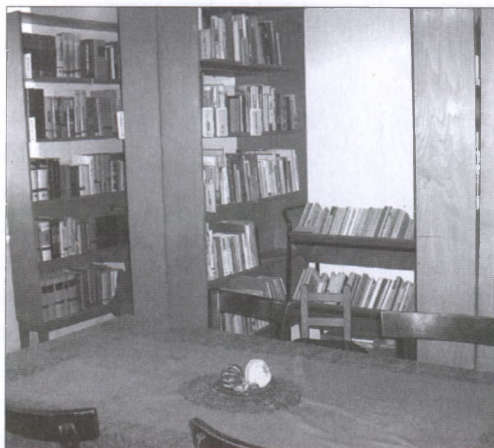
A könyvtár a Közösségi Házban