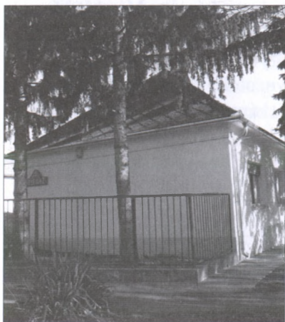
A Teleház épülete

ház jó helyszínül szolgált a beszélgetésekhez is, de szervezetünk video-klubot, gyereknapot, ping-pong klubot. Emellett a kétezres évek elején újdonságnak számító „Teleház mozgalom” kínált jó kitörési alkalmat: egyrészt behozni a faluba a nagyvilágot, másrészt közelebb hozni az embereket az alapítványhoz és egymáshoz. Több környékbeli település már sikeresen pályázott számítógépek-re. Györköny és Nagyszékely volt számunkra a követendő