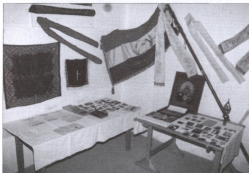
Gyülekezettörténeti kiállítás a Közösségi Házban

Hogy melyik kiállítás volt az első, nem tudom. De volt emlékezetem szerint gyülekezettörténeti, I. és II. világháborús emlé-