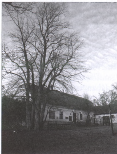
A népfőiskola első otthona, a Fördös- kúria, udvarán a Hét vezér-facsoport