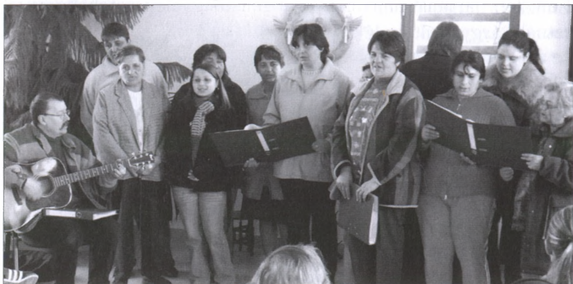
Éneklés ádventi istentiszteleten