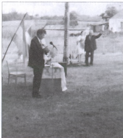
A Millenáris Emlékpark átadása