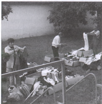
Ruhaosztás a Községi Ház udvarán