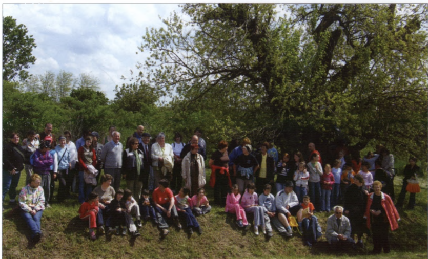
A Lázár Ervin Baráti Kör megalakulása a Nagyszederfánál Alsó-Rácegresen