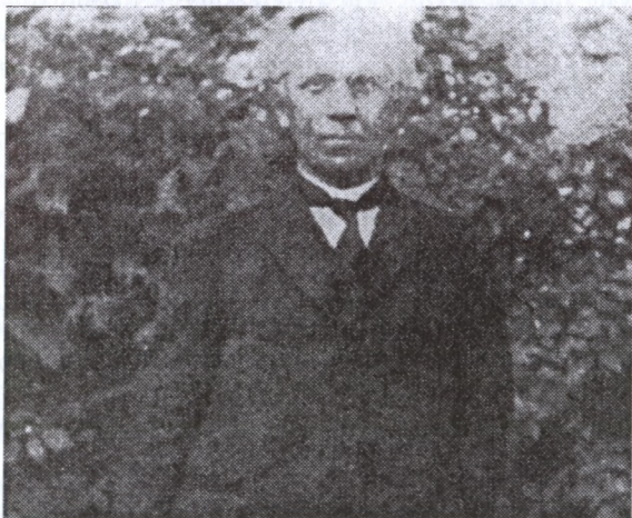
Osvát Ernő (1876–1929)