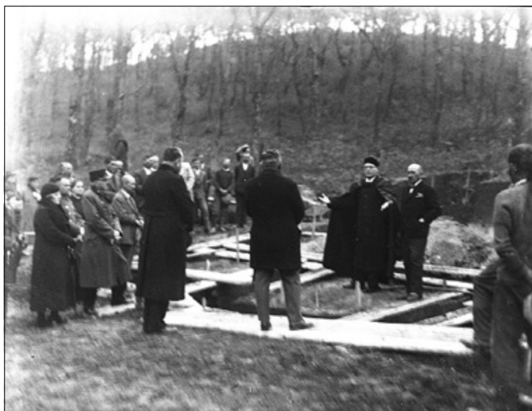
A templom alapkövetélteli ünnepe (1934)

És 1936-ban a Sípos-hegy aljában pedig felépült a reformátusok és evangélikusok közös, protestáns temploma is.