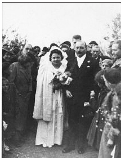
Csényi István-Bali Teréz a tisztelők sora között (1941)