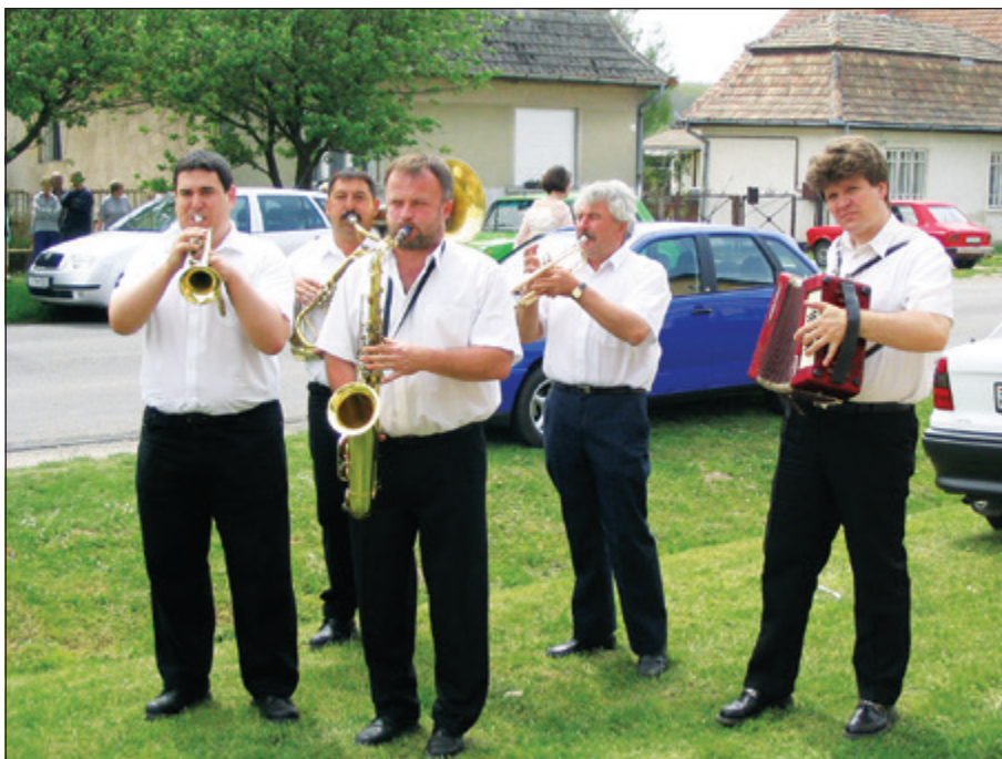
A kaposfői Csordás-Becker Együttes

Mivel az igény egyre nagyobb lett, ezért zenekart több esetben – újsághirdetés útján vagy ismerős ajánlásával – vidékről hoztak.