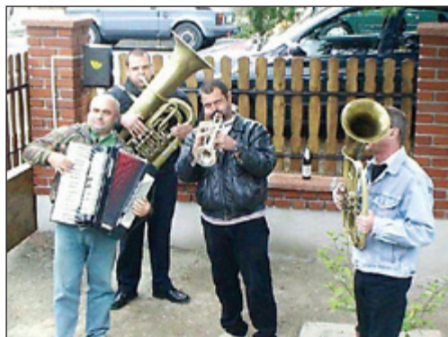
A taszári fúvós zenekar