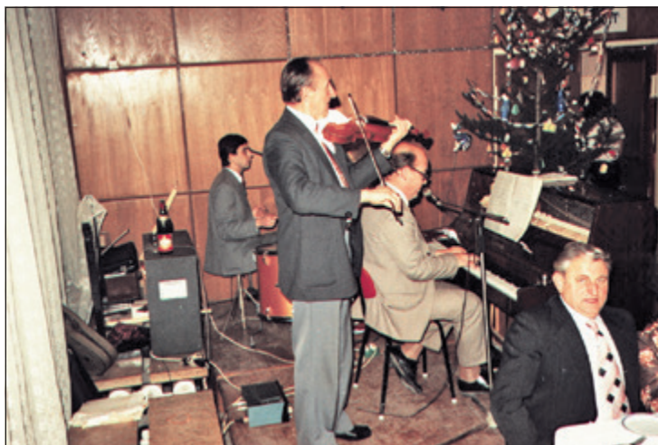
A tragédia előtti és ... utáni percek