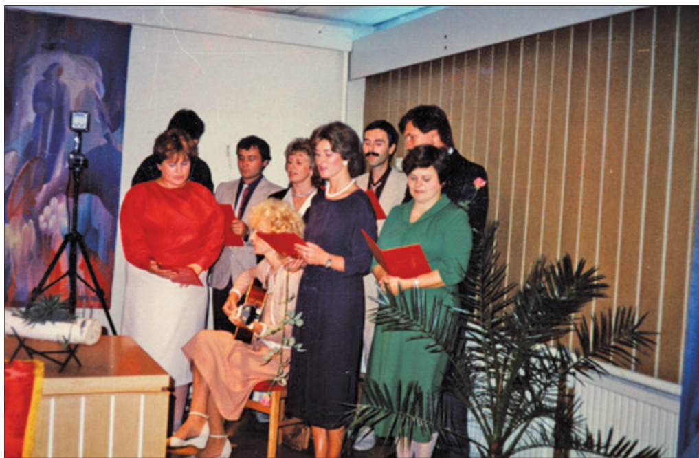
A menyasszony pedagógus kollégái