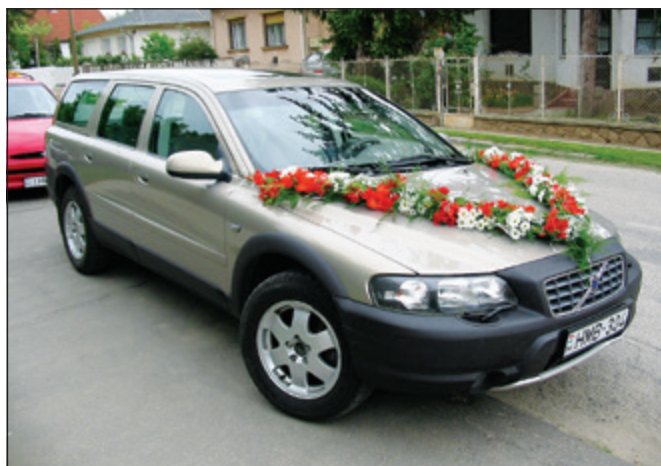
Vőlegényi autó (2001)