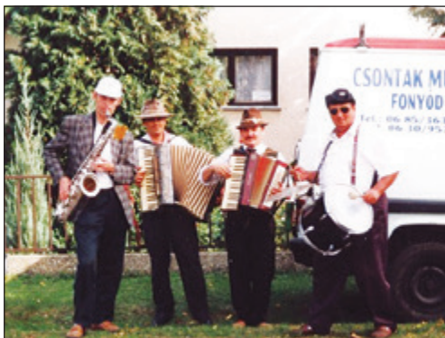
A paksi Fórum Zenekar