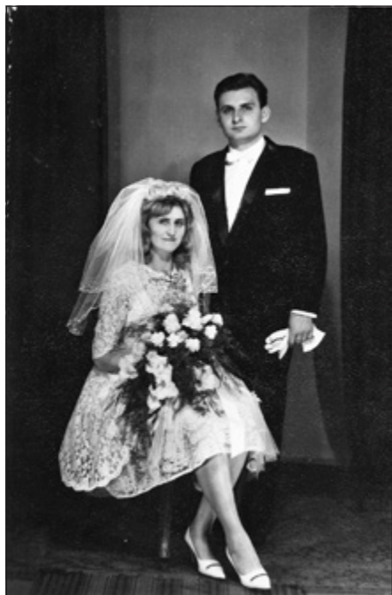
Humpester Ferenc- Ország Mária Magdolna (1966)