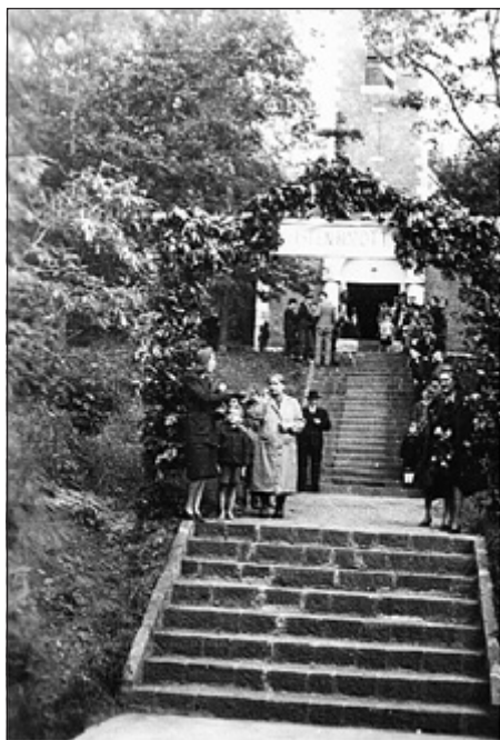
A felépült templom a felszentelés napján