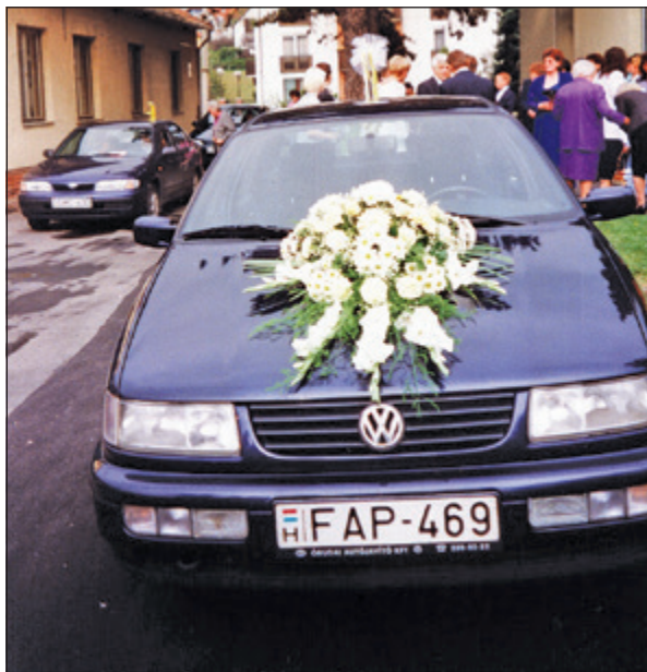
Menyasszonyi autó (2001)

Az esküvőre menet a menyasszony és vőlegény szállítására a legnagyobb és a legszebb autókat választják ki, és azokat – némely esetben – szerepük szerint virágozzák fel. A menyasszony autóján minden virág fehér. A motorháztetőre fehér szegfűből, kálából, kardvirágból hatalmas csokrot raknak föl, és az antennára fehér szalagokat kötnek. A vőlegény autóját színes virágokkal és színes szalagokkal díszítik. A kísérő autók díszítése egyéni, de inkább csak az antennára tesznek fel színes szalagokat lobogni.