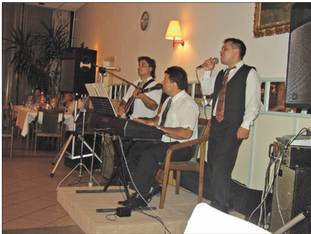
A balatonlellei zenekar