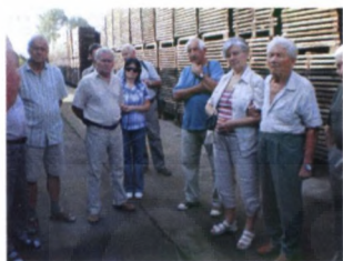
Nyugdíjas erdészek kirándulása a szigetvári hordógyárban (fent), Szentpéterföldén (jobbra)...