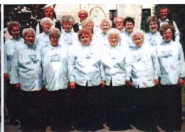
A Tungsram Nyugdíjas Klub kórusa