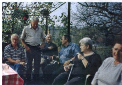
A Kanizsa Trend nyugdíjasai a látó-hegyi kiránduláson és a gyárépület előtt