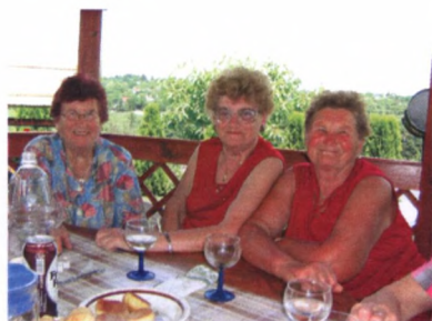
A Honvéd Kaszinó Dalos Társasága boldog nyugdíjas tagjai szentgyörgyvári záróbulin, névnapi üveges (és sörös) tánc közben