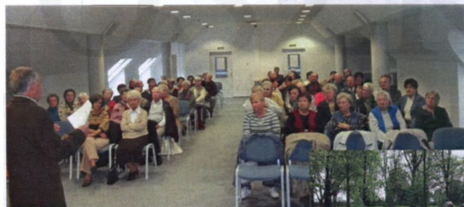
A Civil kerekasztal Egyesület háztartási gépcsere programjának tájékoztatója (fent) és faültetés a sétakerti