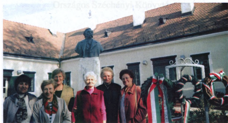
A Pedagógusok Nyugdíjas Klubjának tagjai a Deák kúriánál