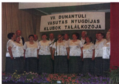
Dalos találkozó és vasutasnap a Vasutas Nyugdíjas Klub részvéte- lével