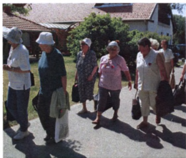
A Szívbetegéért Egyesület kaszópusztai kirándulása, ahol vendégként a rákbetegek és a mozgáskorlátozottak egyesületének tagjai is élvezhették a természet csodáit