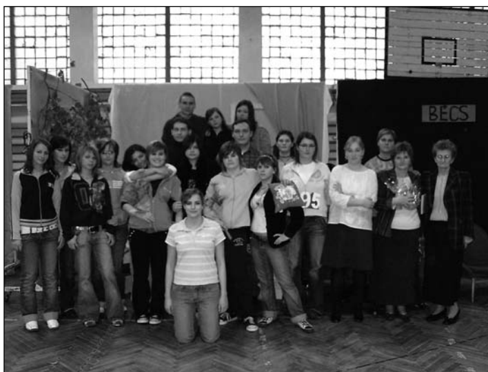
A két Lotti

Dickens: Karácsonyi ének (2003); Sötétség és a fény (2004); Micimackó (2004); Öt jelenet az iparosokról; (2005); Karinthy: Visszakérem az iskolapénzt (2005); Eric Kastner: A két Lotti (2006).