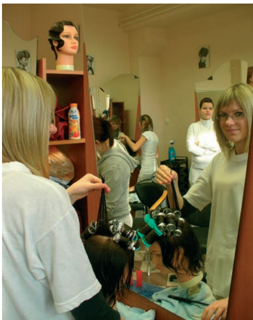
Az új iskolai fodrász-tanműhelyünk