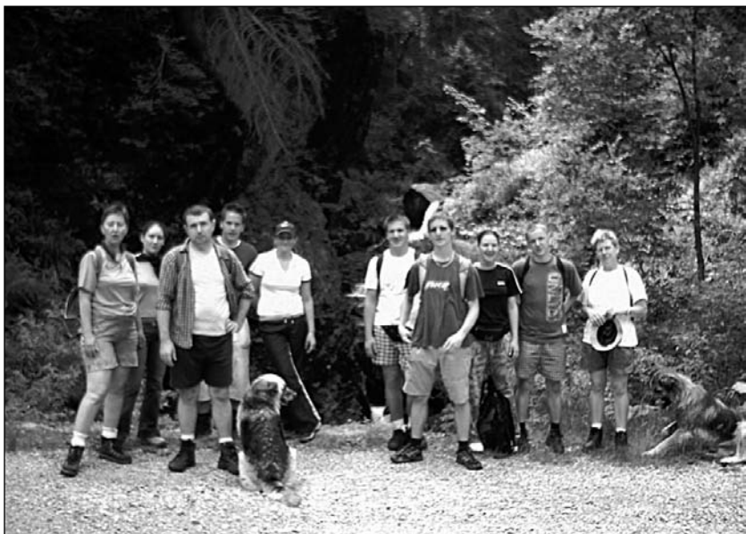
Bihari túra, 2006