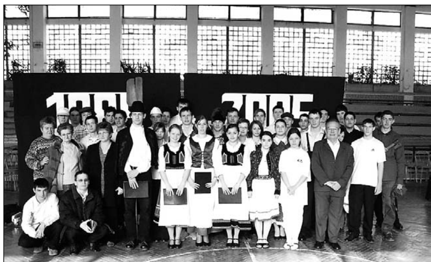
A szereplőgárda és felkészítőik a 120 éves évfordulón