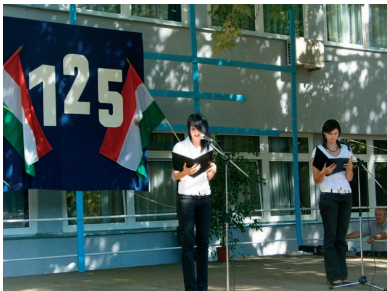
A jubileumi tanév megnyitója