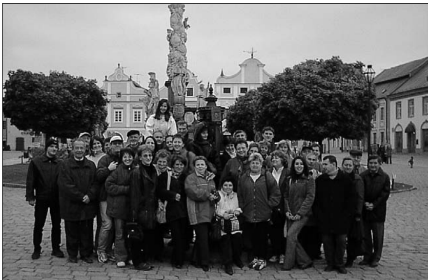
Târgu Mureș (Csehország), 2003