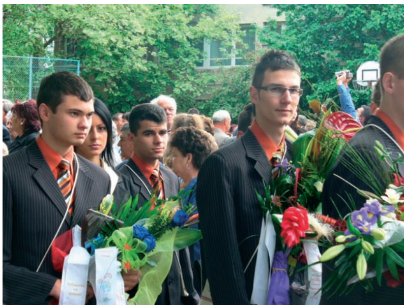
Ballag már a vén diák tovább ...