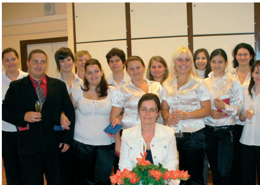
A humán controlling ügyintézők őszinte vizsgaöröme 2009