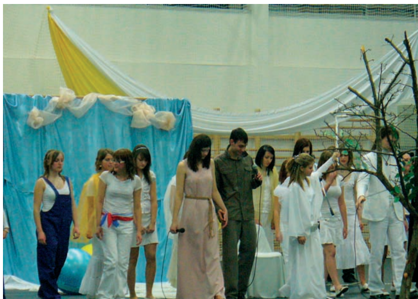
Az ember tragédiája a 2009-es szalagavató ünnepségen