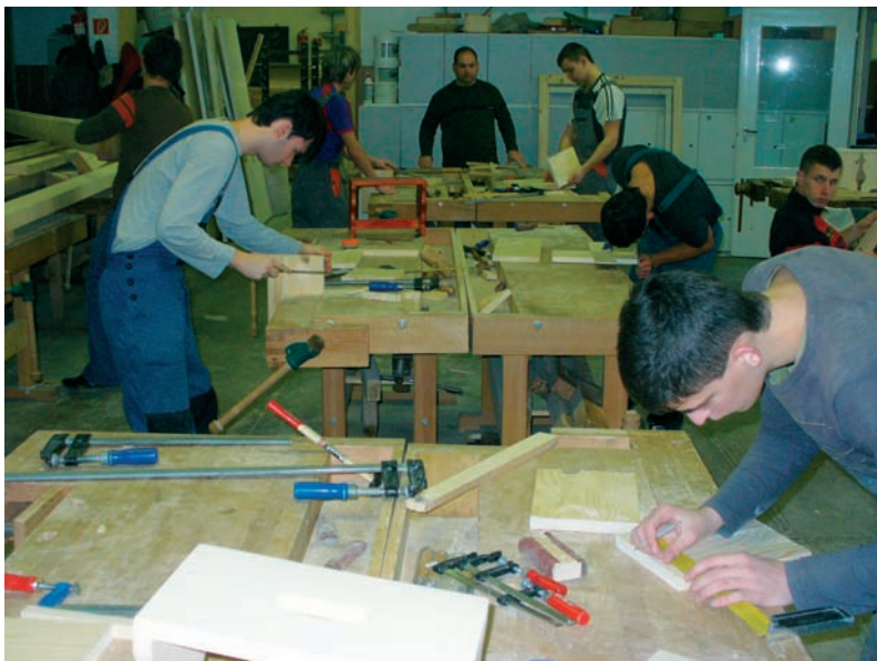
Asztalosok munka közben