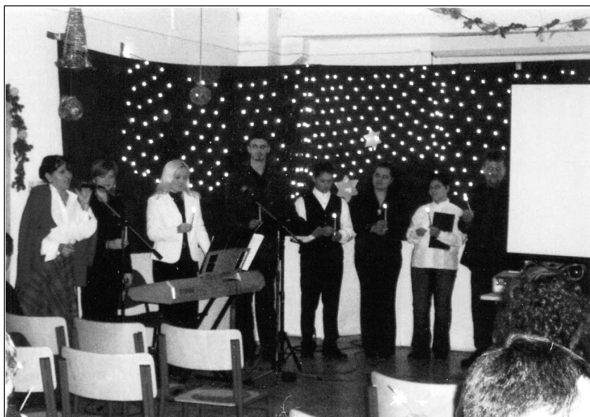
Az estisek karácsonyi ünnepsége, 2006