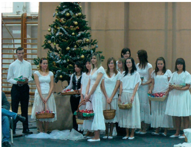
Karácsony ünnepe a 10/b, 11/b és 12/b humán tagozatos diákjaival 2009-ben