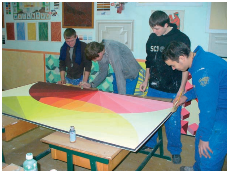
Festők a vizsgamunkáikkal