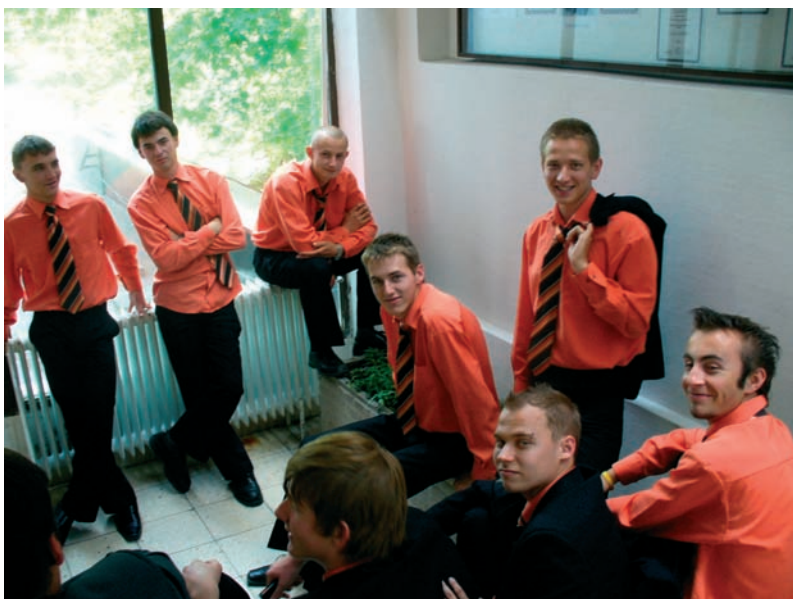
Eredményhirdetésre várva a 2008-as érettségien