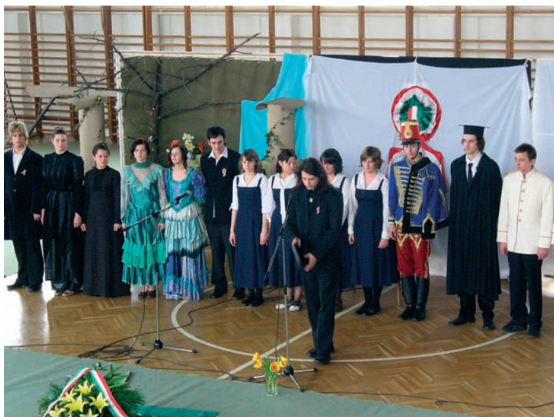
„Forradalmi hangulat” március 15-én