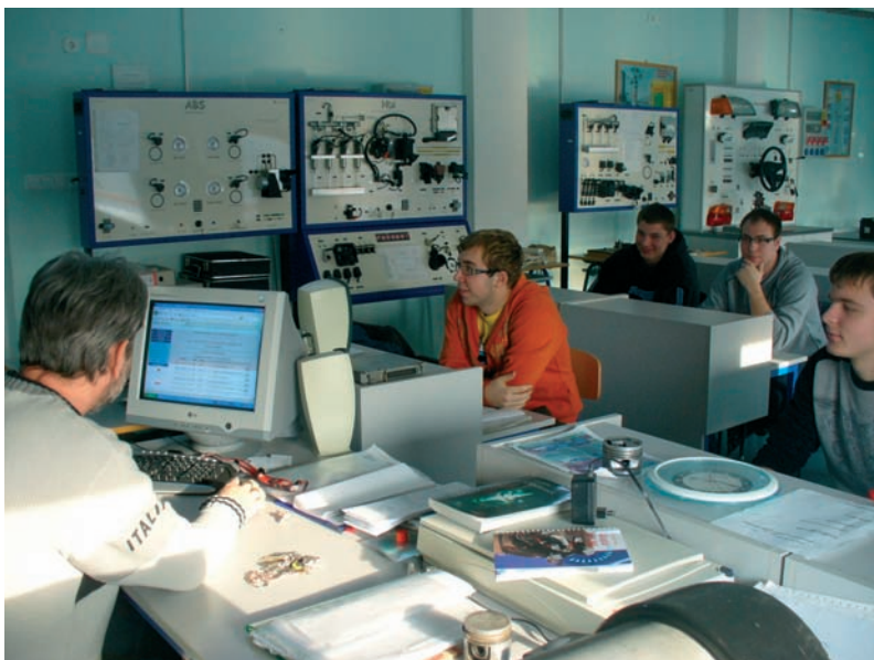
Az új kabinetben modern körülmények között gyakorolják a mérést diákjaink