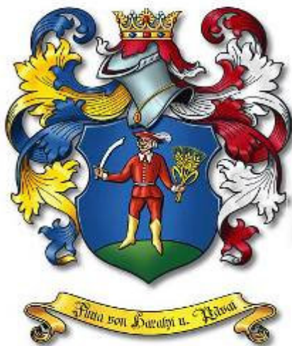
A Gelencei és Pávai Finták címere