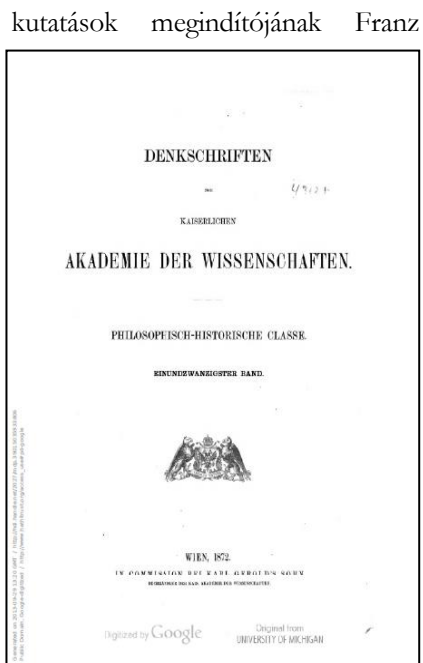
3. ábra: A Die slavischen Elemente im Magyarischen borítólapja

Miklosich 75 oldalas tanulmánya 15 fejezetből áll. A tizenharmadik fejezet az általa szláv eredetűnek minősített 956 szó adatbázisát (18–63), míg az azt követő a magyar megfelelők ábécé szerint rendezett regiszterét tartalmazza (63–73). A munkát egy közel háromoldalas 36 tételből álló