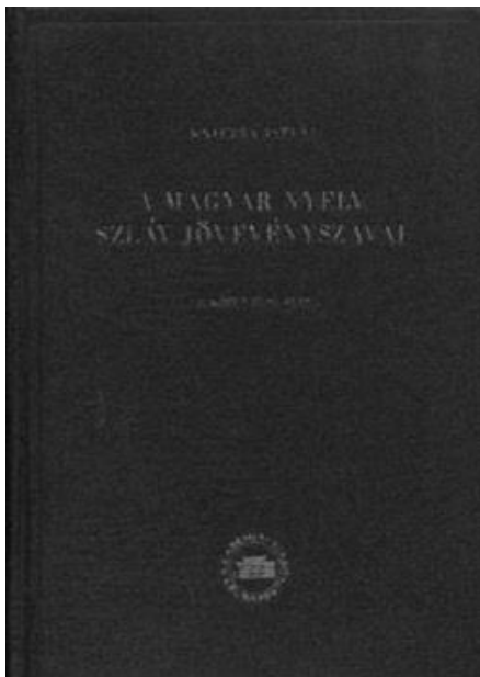
4. ábra: A magyar nyelv szláv jövevényszavai 1955-ös borítója

részletes történetét, az eddigi vélemények általános jellemzését és kritikáját, csak e munka második kötete fogja tartalmazni, vagyis az, amely a szláv jövevényszavaink, hangtanával, szóképzésével, a szláv jövevényszavak rétegeinek kérdésével, szláv és magyar társadalmi háttérével és még néhány egyéb részlettel fog foglalkozni” (Kniezsa 1955 I/1: 3).