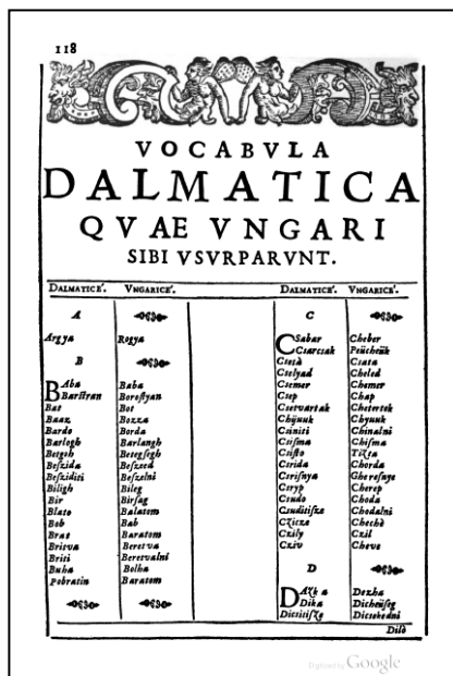
2. ábra: A horvát-magyar szöveggyezések listájának első oldala Verancsics Dictionarium ában

A Dictionarium tartalmi szempontból több részre osztható: A mű nyitányát az Arconatus Jeromos, II. Rudolf udvari titkára által írt költemény adja, mely arról számol be, hogy a mű szerzője Fausti Verantij, vagyis Verancsics Faustus. Ezt egy ajánlólevél követi, melyet a szerző Carillius Alfonsushoz intézett. Ebben Verancsics arról