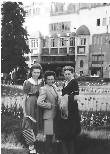
1944. Marosvásárhely, Fő-tér, minden nyáron tele volt gyönyörű tulipánnal.