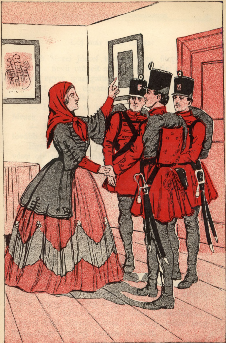
A spártai anya.