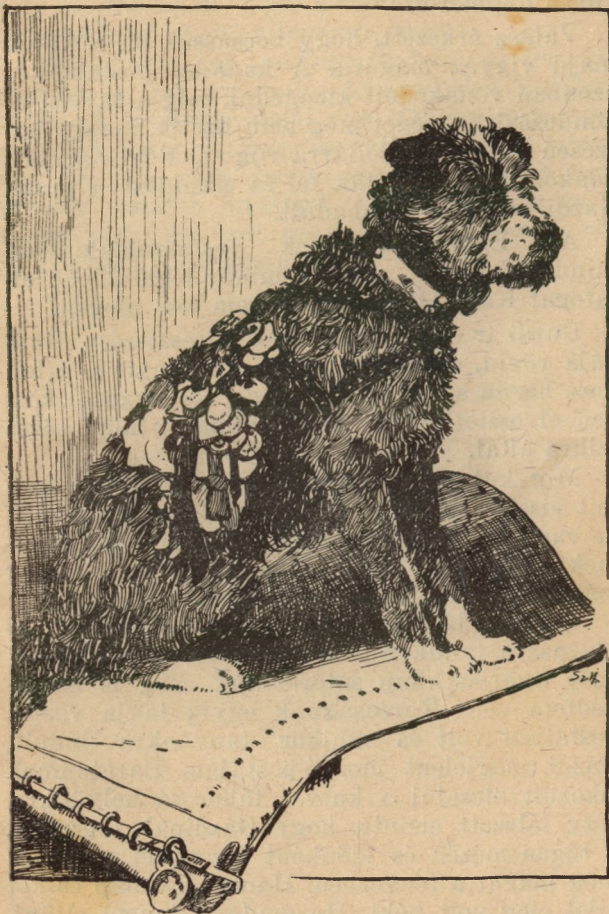
Gazdi az érmekkel földiszítve.