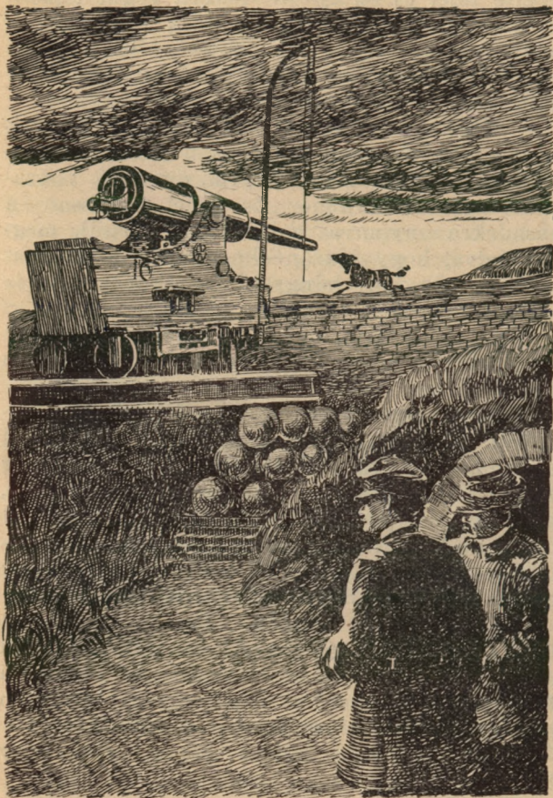
... Bomba ellenőrizte a töltést ...