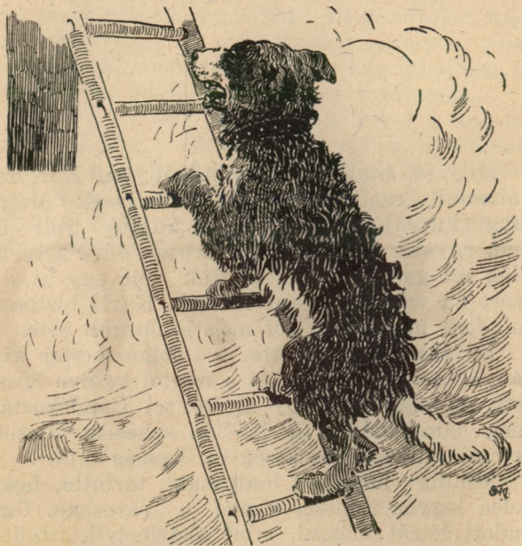
Karló fölszaladt a létrán...

templomok harangjai hangosan és gyorsan kongani kezdtek, Karló pedig, ki addig lustán aludt és őrizte a helységet, felriadt, két-három beszédes morgással gazdáját hívta és a legnagyobb gyorsasággal a tűzhöz rohant.