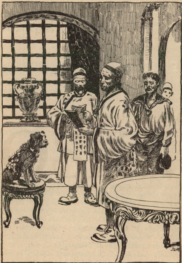
Gazdi japán útlevelet kap...