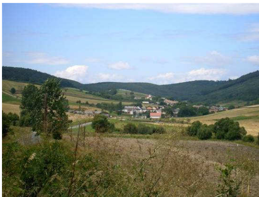
Kisbárkány hegyek ölelésében