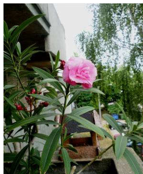
Házunk nyugati oldalán: kedvenc nyírfám és a rózsaszín leander

Jaj, csak orvost kérek, bajom csak titoktartással mondom! Fájdalmában gyorsan kap hasához jaj, kedves doktor segítsen rajtam!