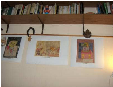
Buday Attila festményei lányom nappali szobájában.

tetteikért megbűnhődnek, hogyan el ne feledjék sosem: a Jóisten nem bottal ver!