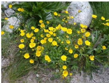
A Magas-Tátra virágai