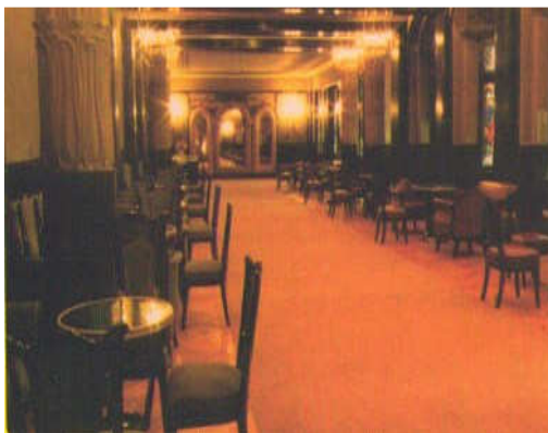
Marosvásárhely A képen a marosvásárhelyi Kultúrházban a tükörterem egy része