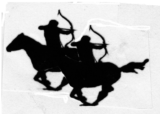
Magyar maradt régi földön

Narrátor: Hunor és Magyar szétválása Hunor indul Napnyugatnak, Népét nevezik Hunoknak, Más népek még itt maradnak, Őket nevezik Magyaroknak.