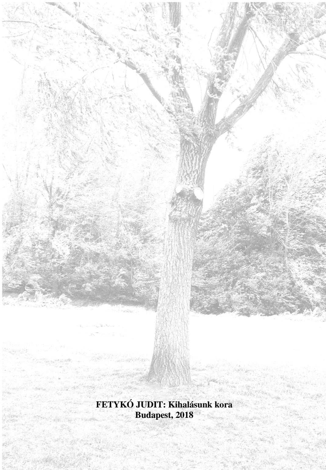
FETYKÓ JUDIT: Kihalásunk kora Budapest, 2018