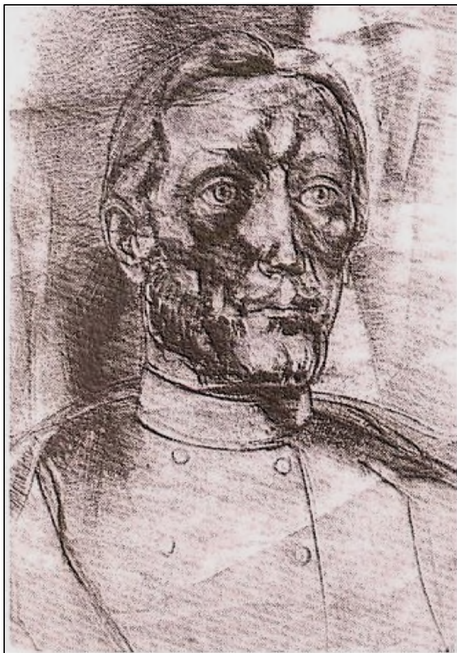
Zsigmond Attila: BOLYAI