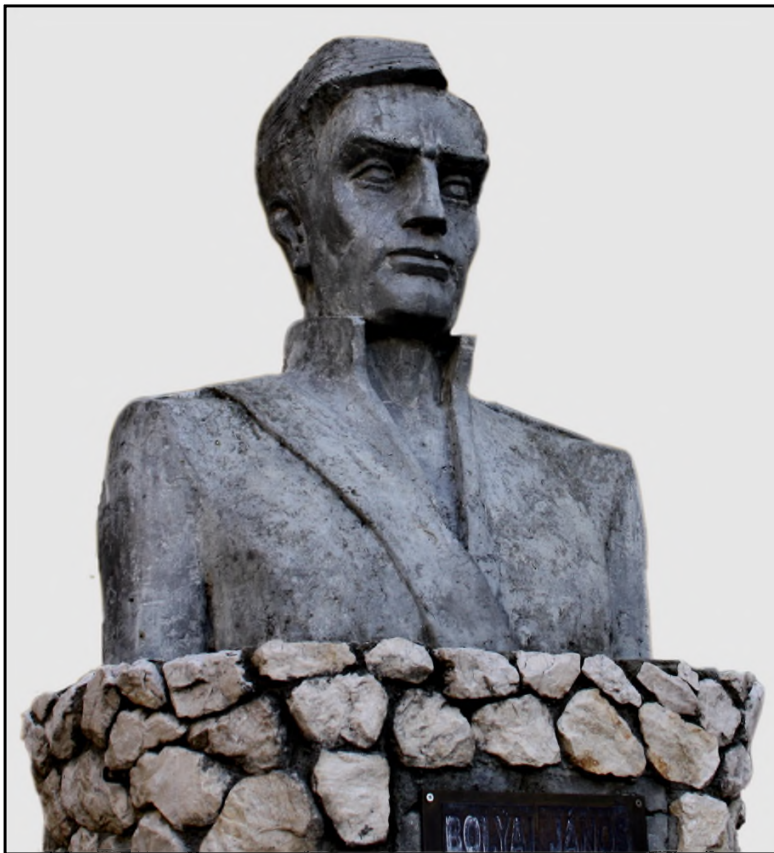
Bolyai János mellszobra a marosvásárhelyi Bolyai Farkas Elméleti Líceum udvarán