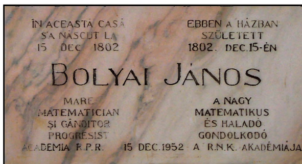
A kolozsvári szülőház falán 1952. december 15-én elhelyezett újabb Bolyai-emléktábla.