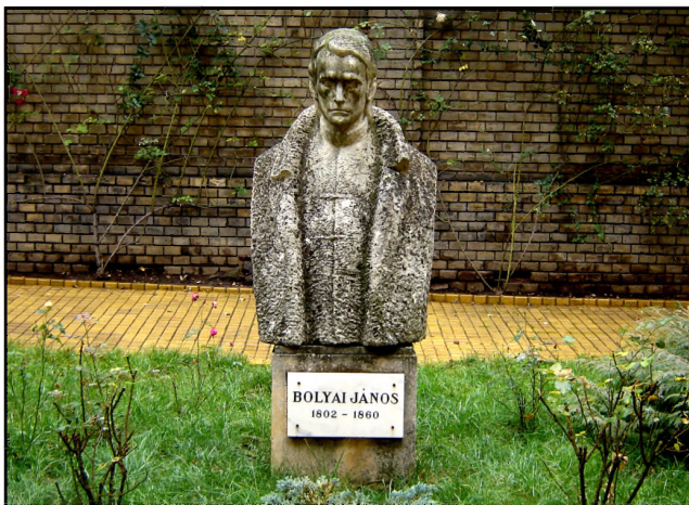
Bolyai János mellszobra Kolozsváron, a BBTE Farkas utcai épületének a belső udvarán