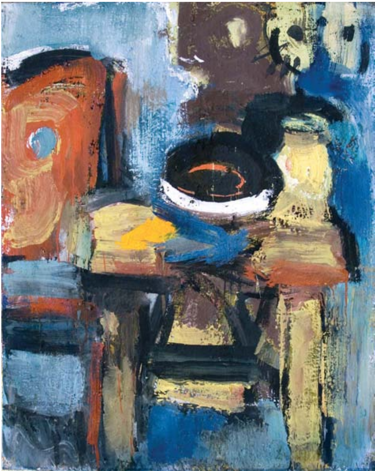
Csendélet parasztszékkal, tempera, papír, 124 x 99 cm, 1962, j. n.