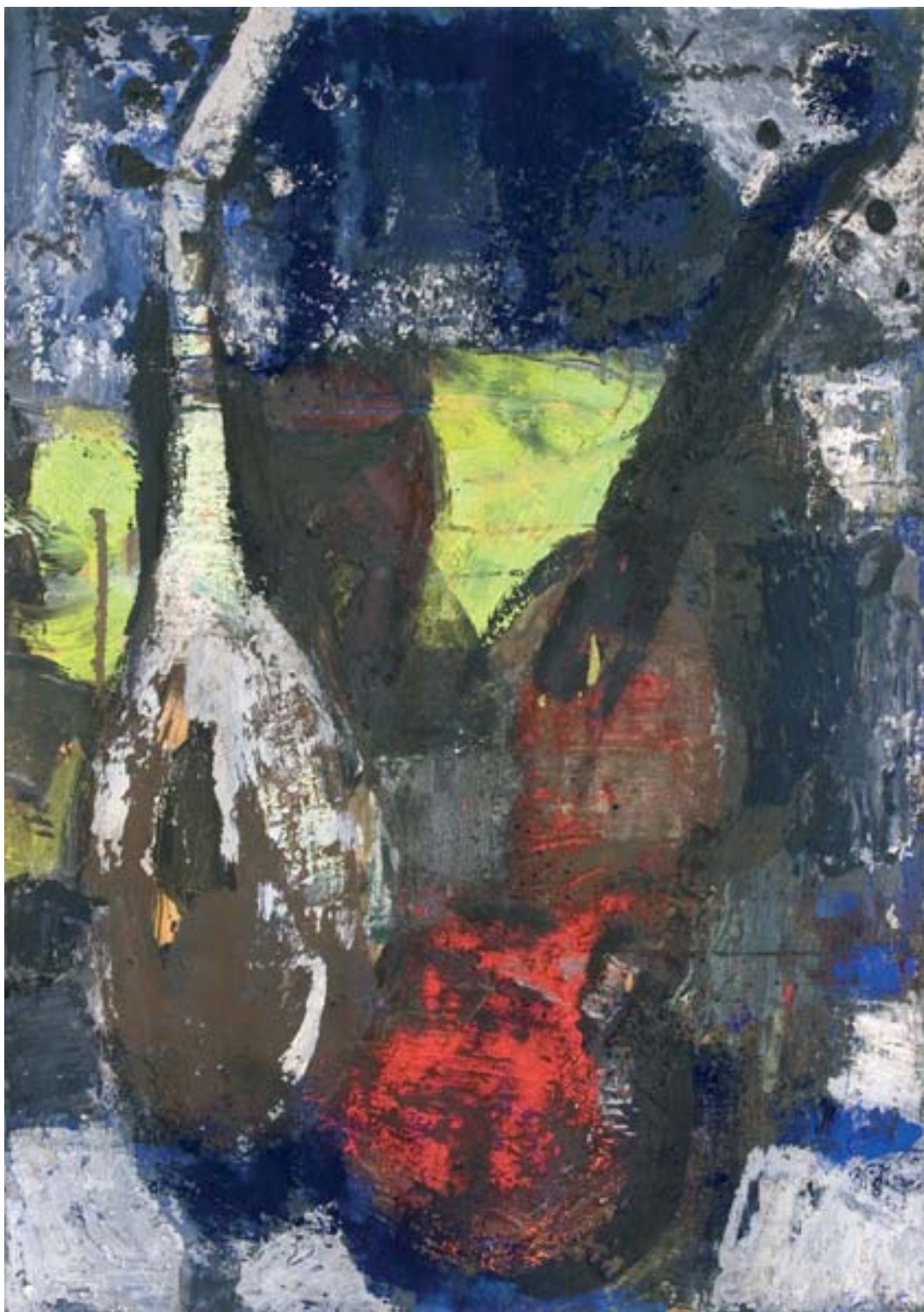
Hangszerek, olaj, papír, 86,5 x 61 cm, 1973, j. j. f.: Domanovszky