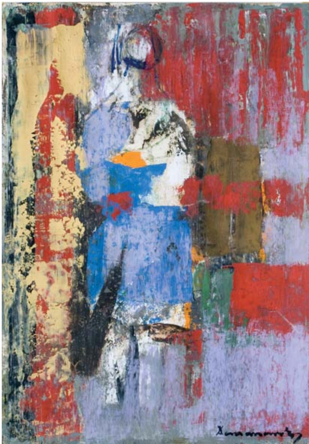
Gobelin terv, tempera, papír, 57 x 40 cm, 1960-as évek, j. j. I.: Domanovszky