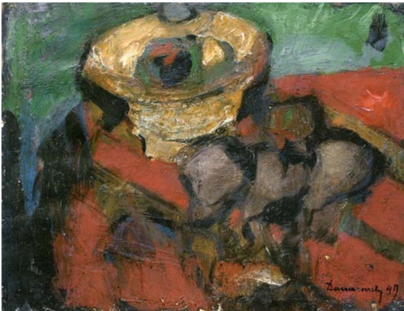
Körtés csendélet, olaj, karton, 44 x 57 cm, 1947, j. j. l.: Domanovszky 47