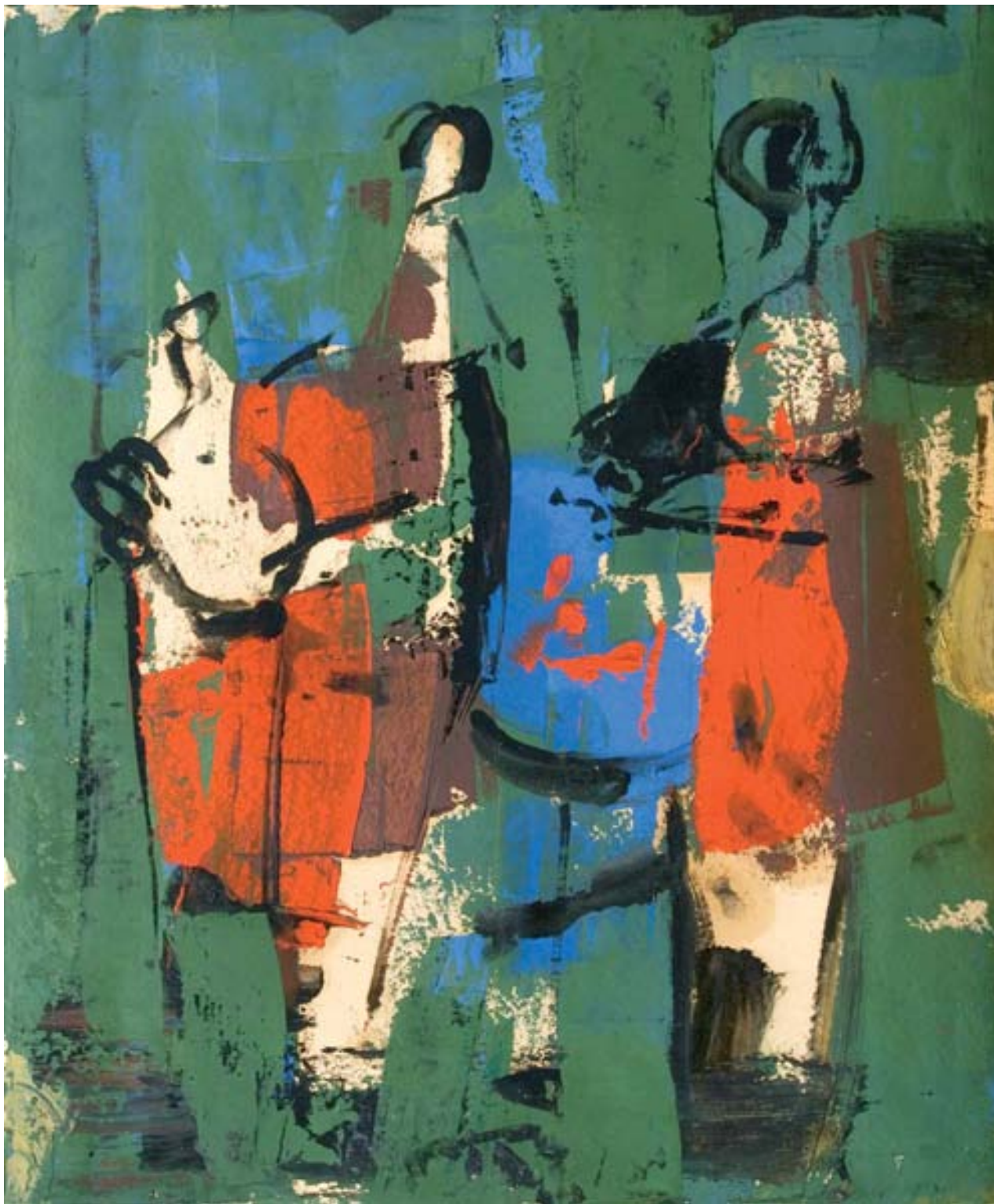
Tanulmány a gödöllői mozaikhoz, tempera, papír, 57,5 x 49,5 cm, 1963, j. n.