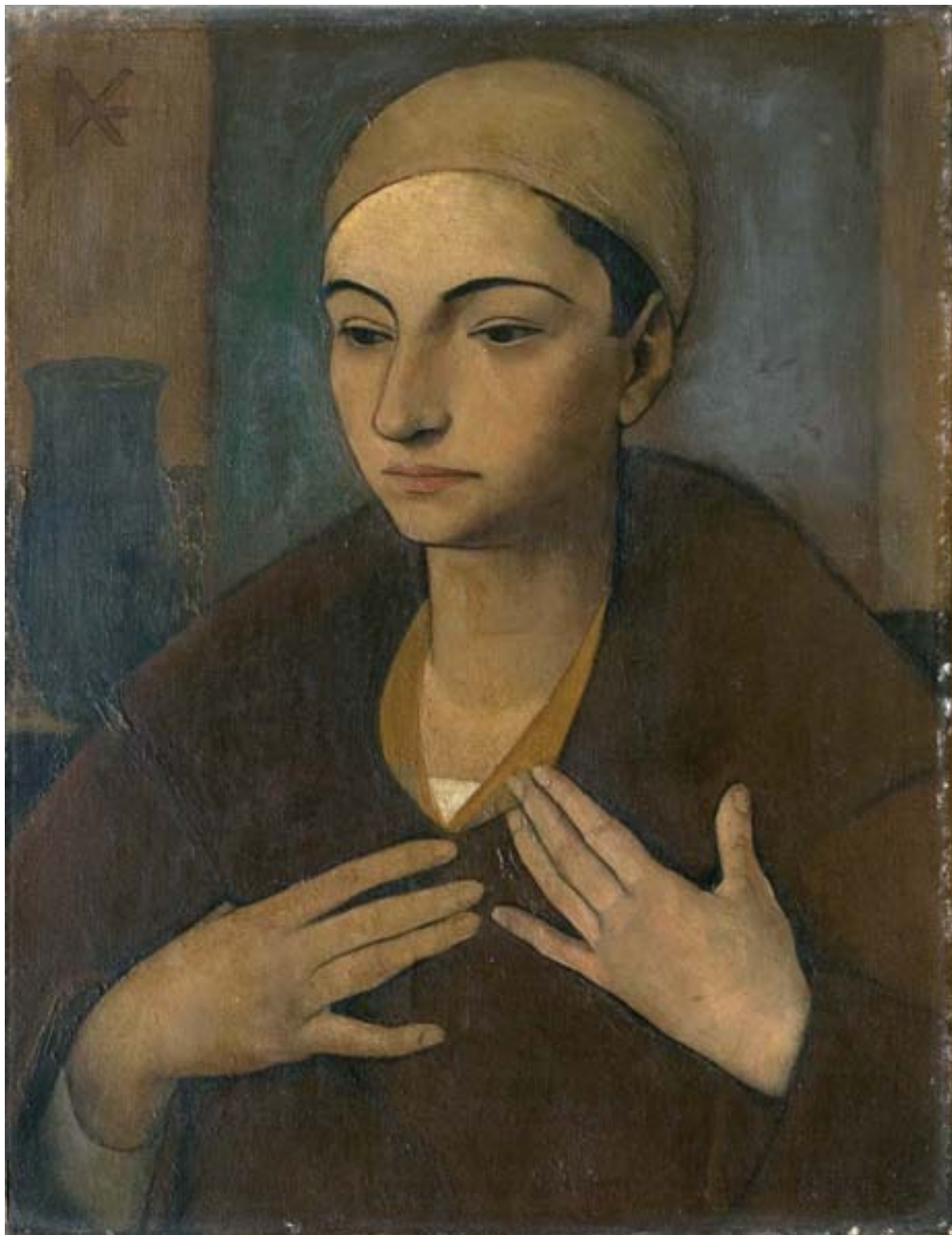
Bella arcképe, olaj, vászon, 44 X 34 cm, 1929, j. b. f.:DE