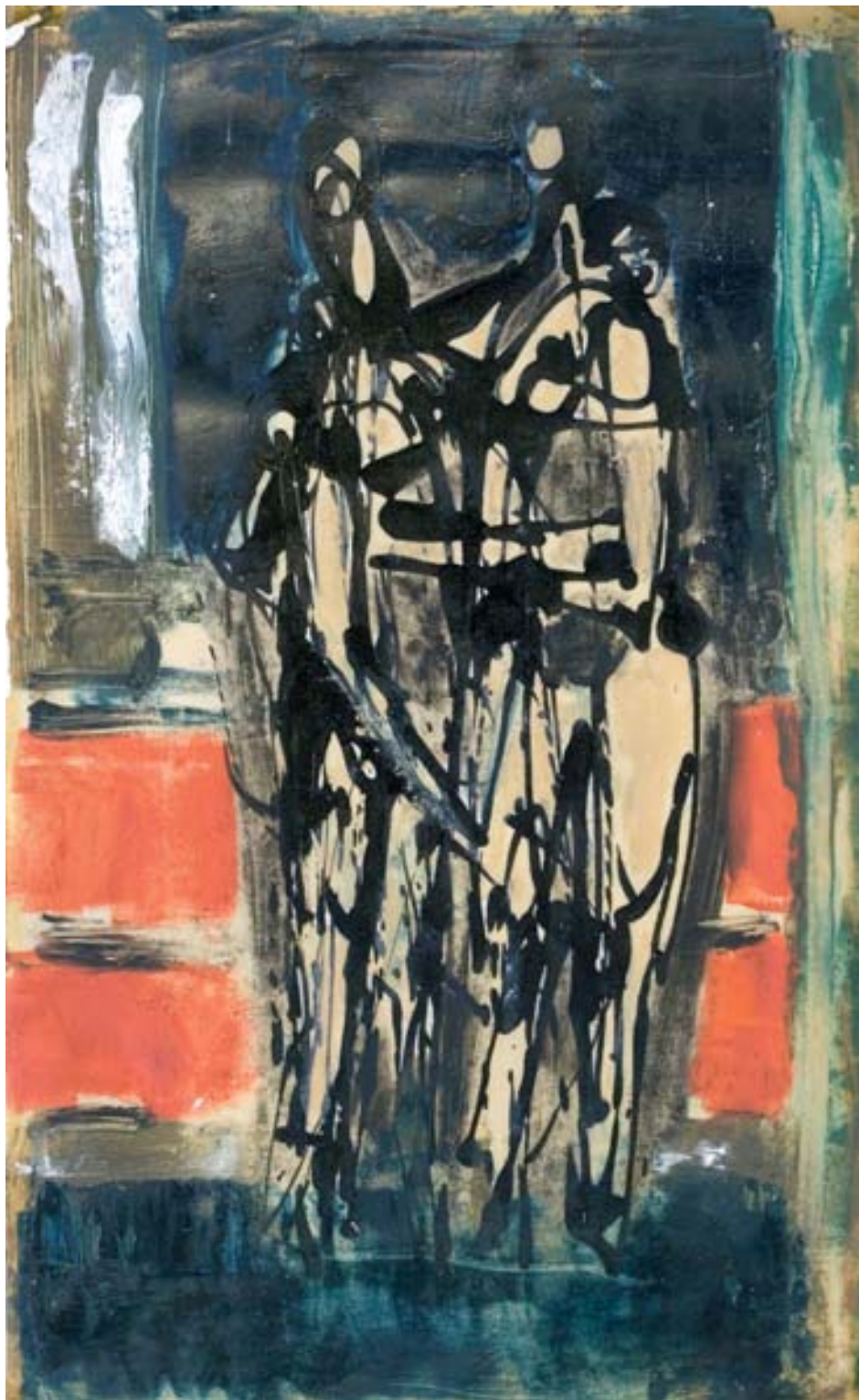
Beszélgetők, olaj, pasztell, papír, 31 x 20,5 cm, 1968, j. n.