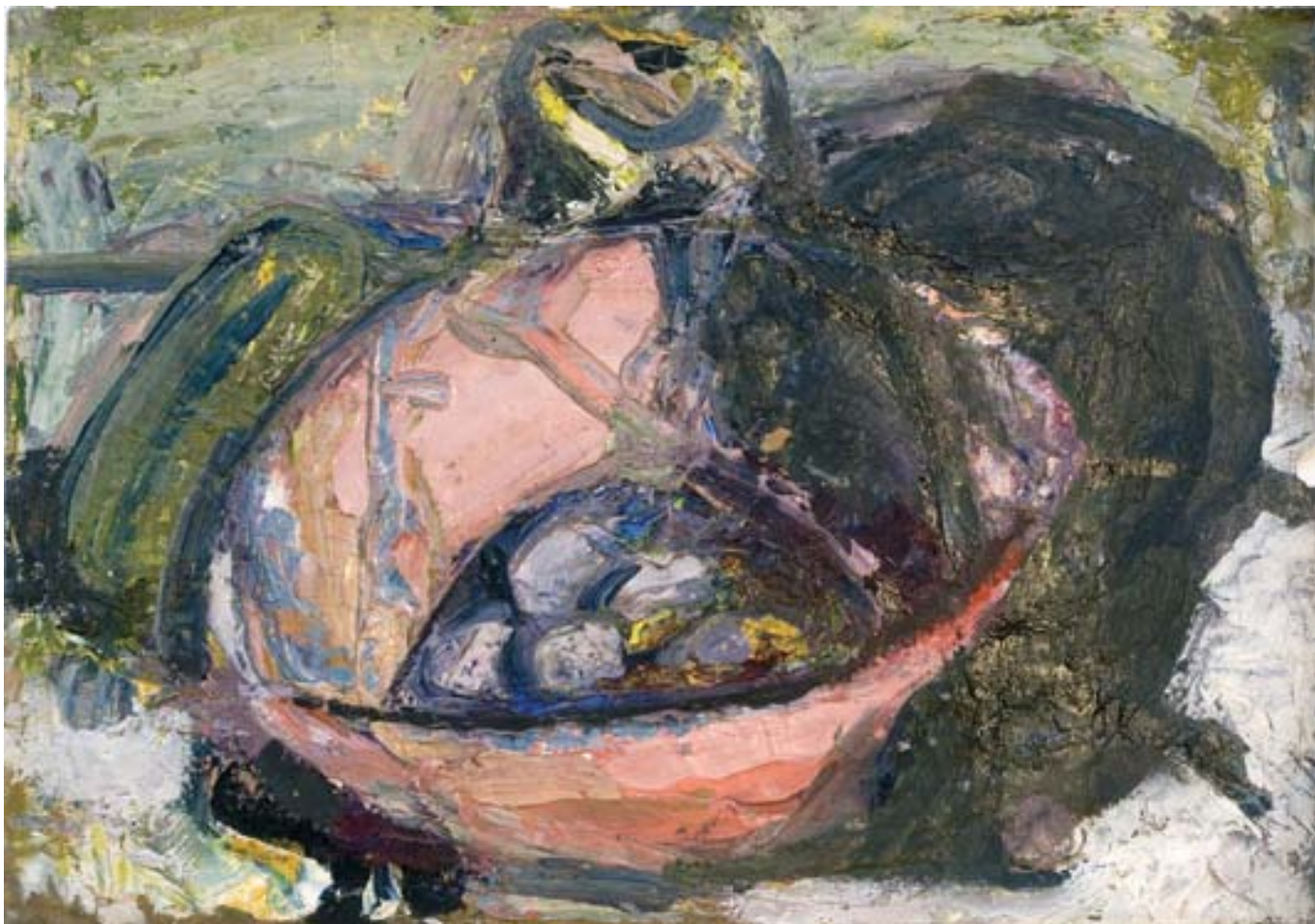
Szilvás csendélet, olaj, papír, 21 x 30 cm, 1941 j. n.

A következő két oldalon: Szamaras, gobelin, 158 x 50 cm, 1944, j. b. f.: DE 44