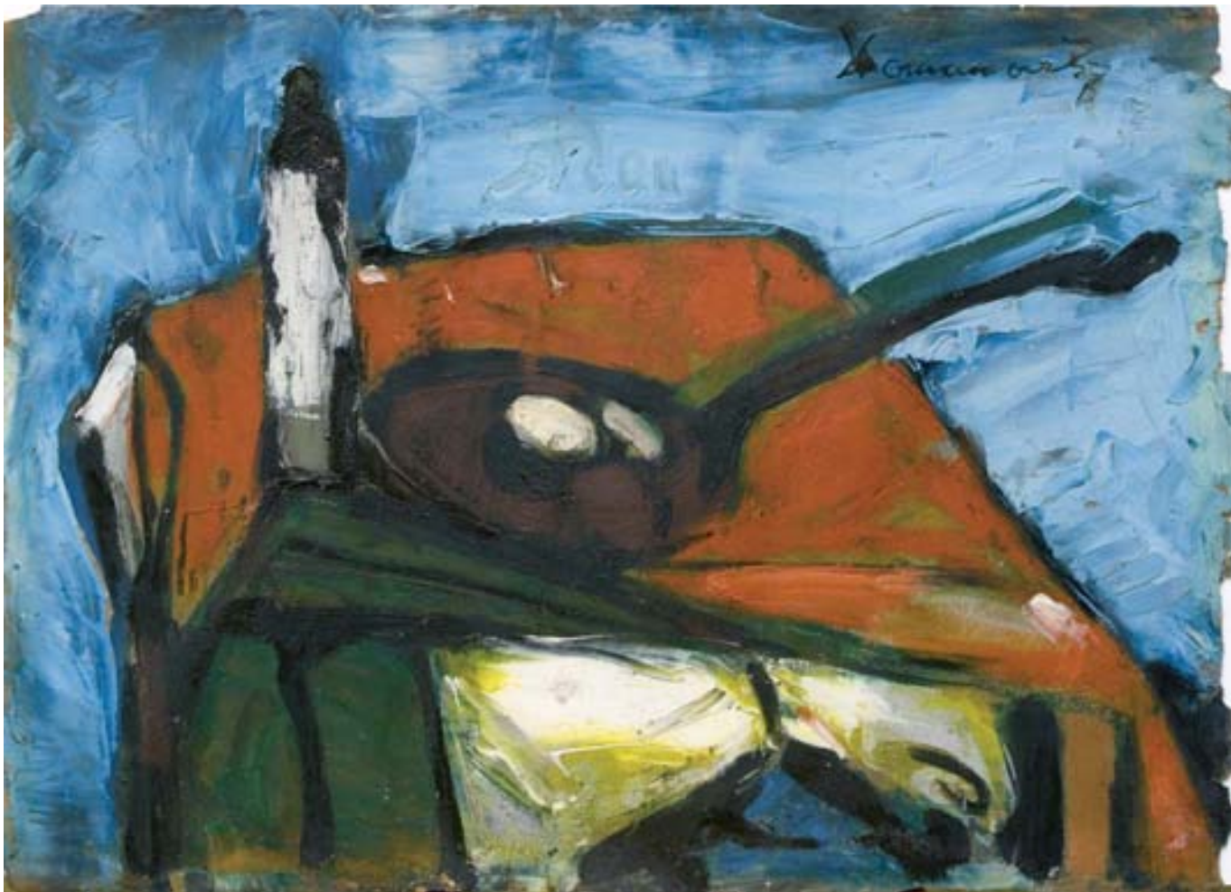
Palacsintasütő, olaj, papír, 42 x 57 cm, 1947, j. j. f.: Domanovszky