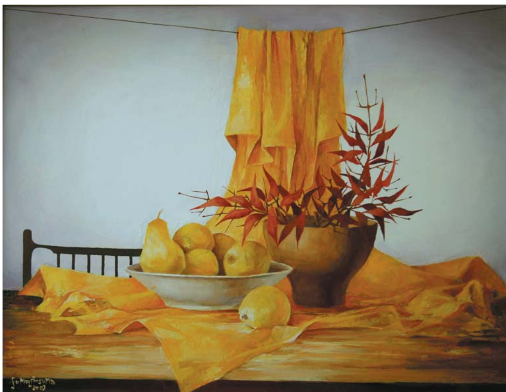
Sárgadrapériás csendélet (utolsó csendélet) 2003, olaj-farost 60x80 cm, j. b. I