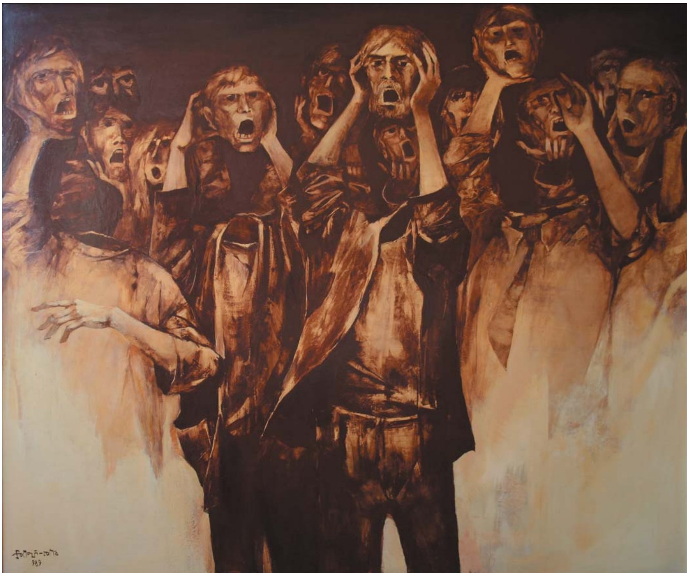
Az ötödik rend 1989, olaj-farost, 100x120 cm, j. b. I

„Somogyi Soma László a legérzékenyebb kedélyű és árnyaltan érvelő tehetségek közé tartozik, olyan valaki, akit nem hagy közömbösen az írott szó, a szokatlan esemény... Minden jelenségben, az emberi elme valahány megnyilatkozásában megtalálja a változások megm,ásíthatatlan mozgástörvényeit... Törékeny bolygója azt sejteti, hogy a felhalmozott társadalmi feszültségek robbanással fenyegetik glóbuszunkat... A művész kálváriák útját járja, a festőállvány az ő keresztje...”