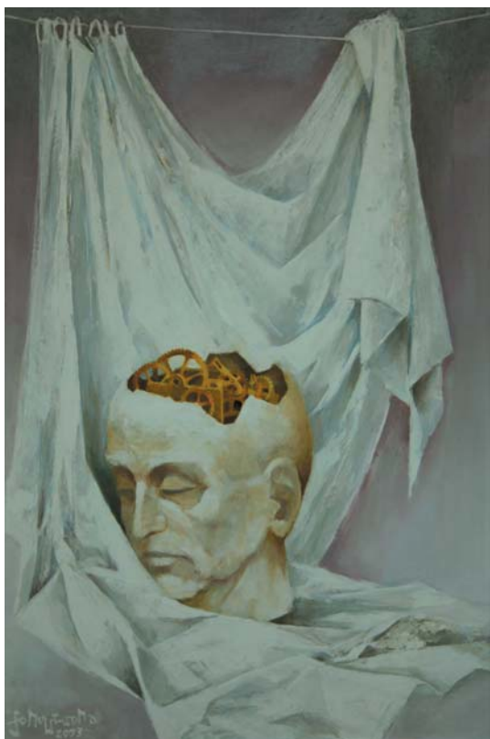
I. Q. 2003, olaj-farost, 60x40 cm, j. b. I