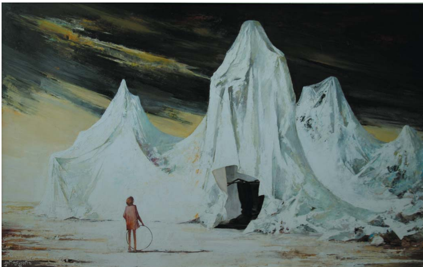
Quidquid latet 1996, olaj-farost, 80x125 cm, j. b. I