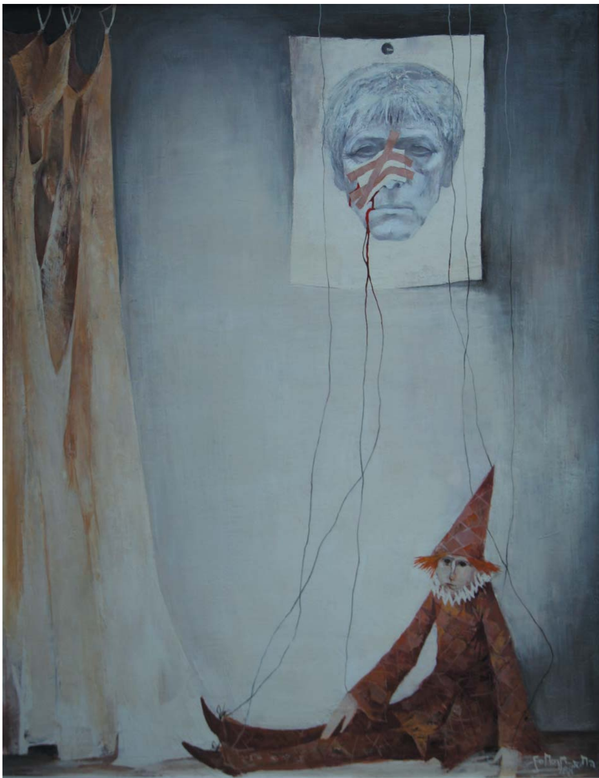
Egy arcműtét emlékére 1988, olaj-farost, 90x70 cm, j. j. I