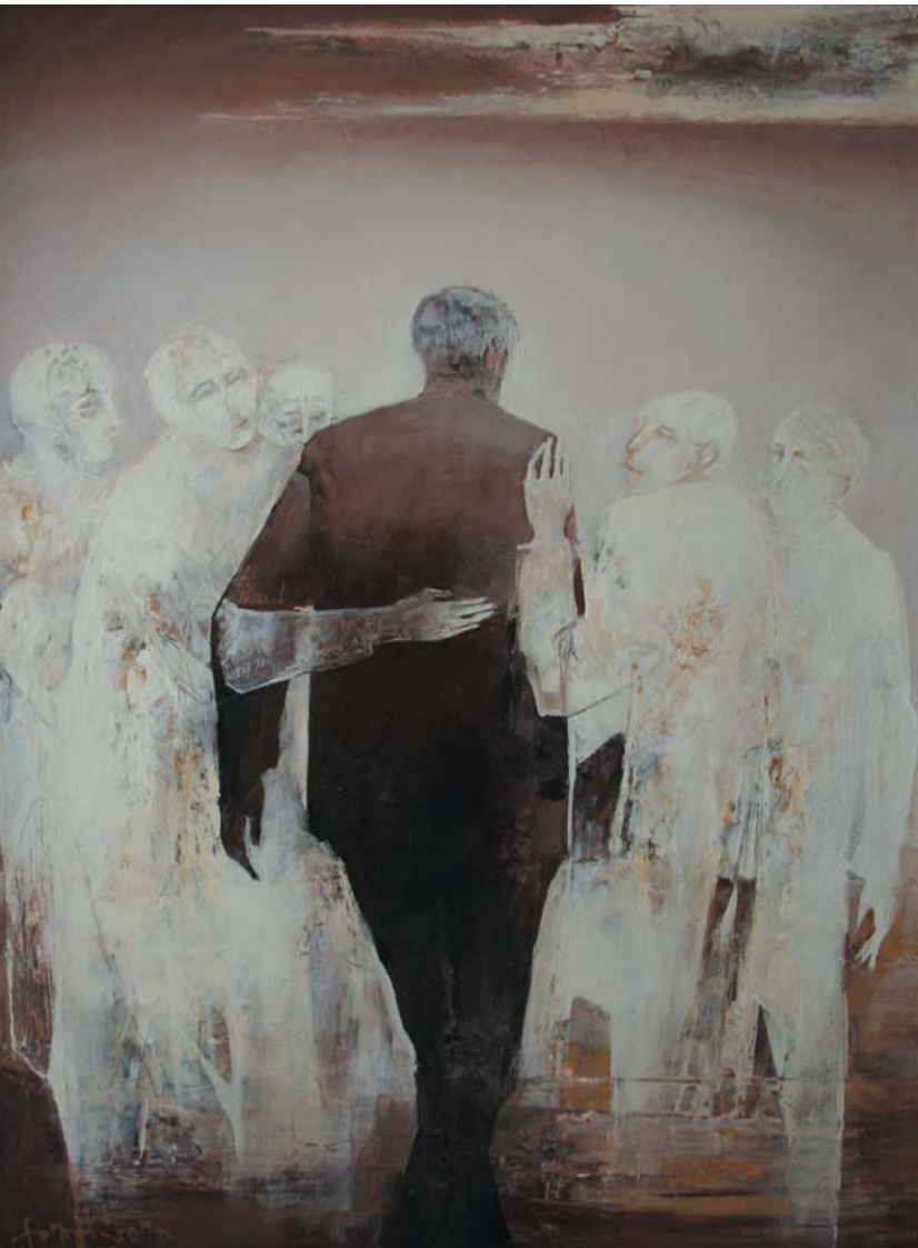
Cantata Humana (triptichon) 1984, olaj-farost, 80x180 cm, j. b. I