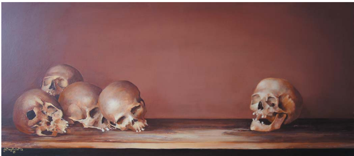
A jó fej 1983-85 olaj-farost, 55x125 cm, j. b. I