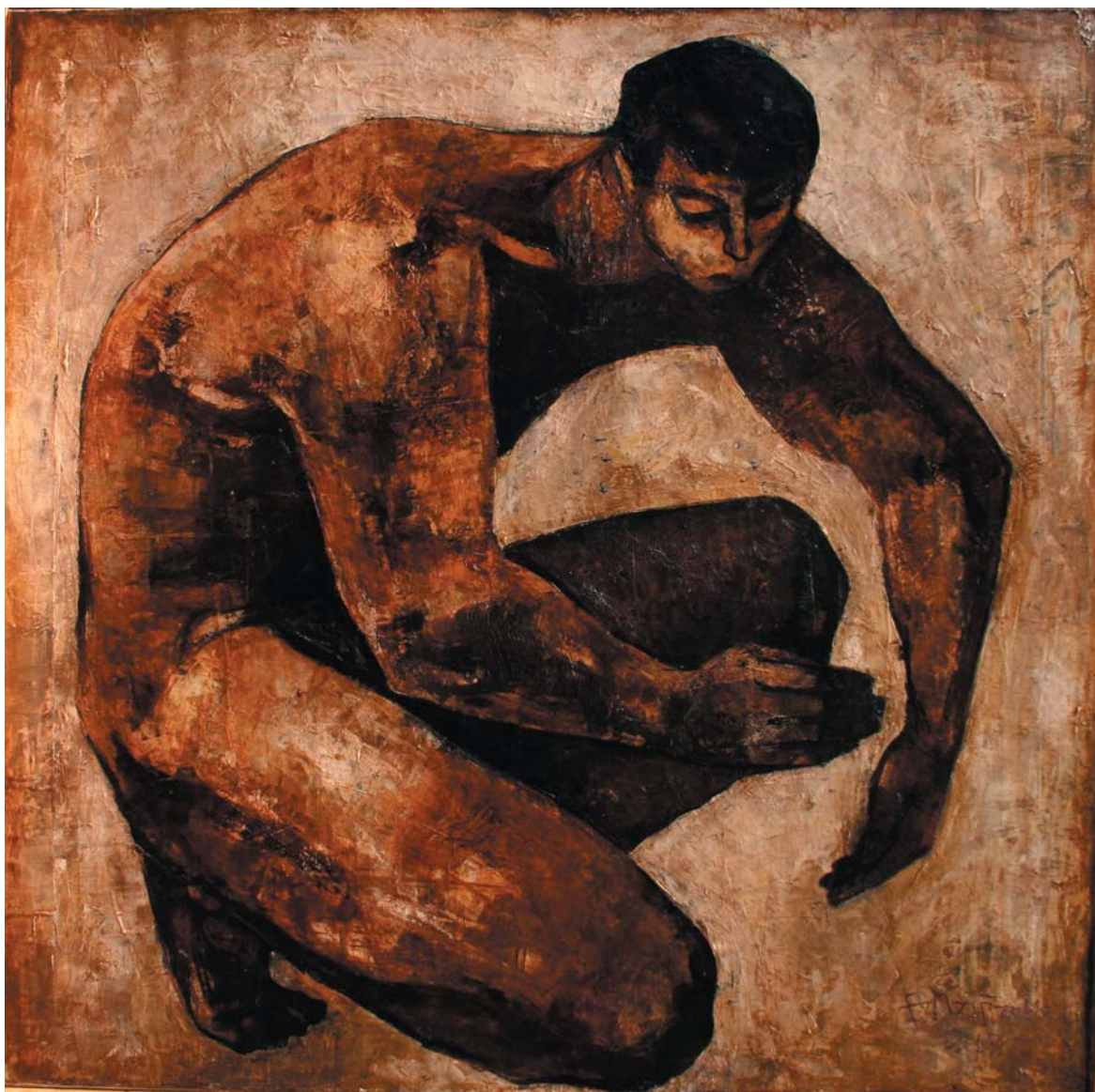
Kertészfiú 1963-65 olaj-farost, 100x100 cm, j. j. I

„Színeiben emberi viszonyokról árulkodik, sárgák ragyogásában a megvetett külsőségekről, komor barnáiban az őszinte egyszerűségről, s közöttük, a sápadt testben, a művészi alázatról. A kép ritmusának lehulló és feltörő vonalaiban pedig az alkotás küzdelmeiről beszél. Nem azt mondja, hogy festőnek lenni keserűség, hanem azt, hogy megjárja a festészet kálváriáját...”