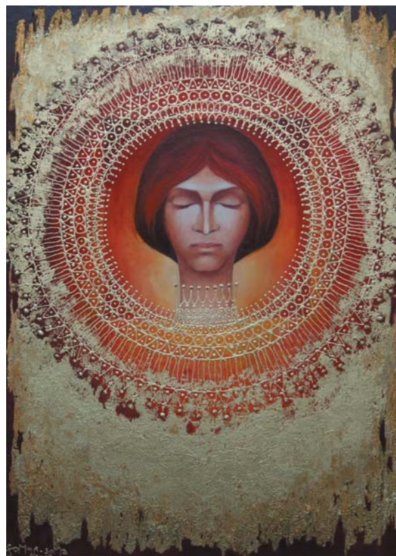
Aranylány 2003, olaj-farost, Á: 40 cm, j. b. I