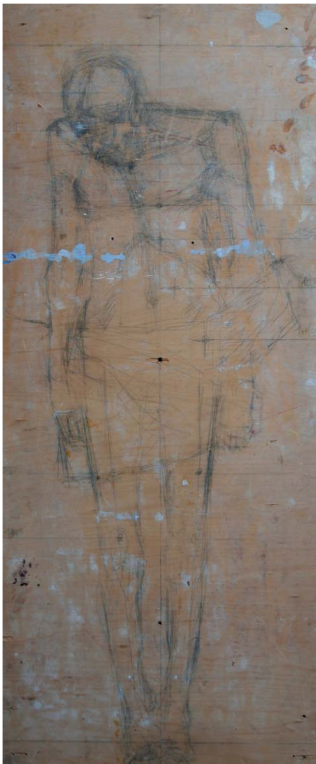
Vázlat (Önarckép) 1999-2003, szén, farost, 50x120 cm