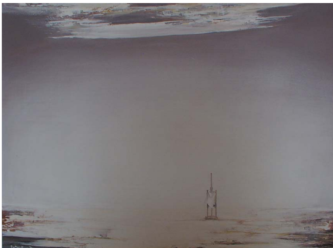
Cantata Humana (a negyedik) 1984, olaj-farost, 80x60 cm, j. b. I