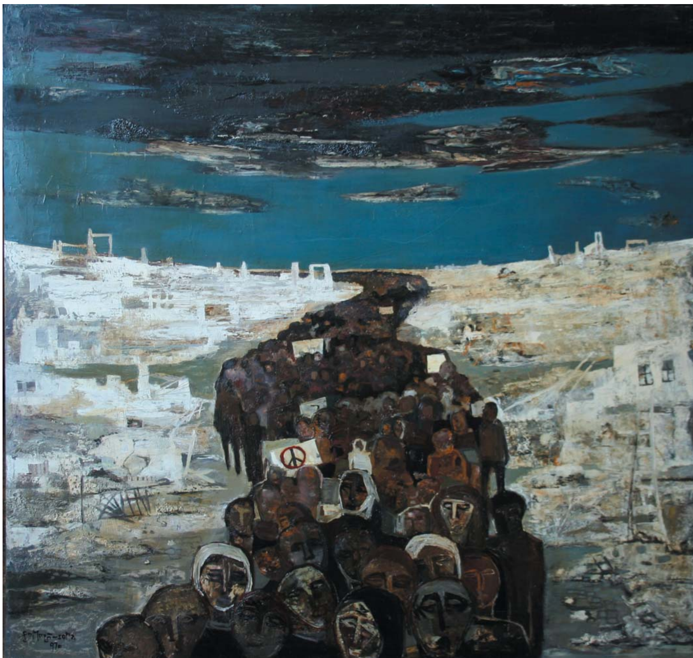
Békemenet (Túlélők) 1970 olaj-farost, 115x123 cm, j. b. I

„...ecsetjét elsődlegesen a mindig valamilyen módon vesztes, a mindig jelenlévő áldozat drámája vezérli. A kép-gondolat kihordásakor egyé válik képével, saját, kéreg alá fúródott sérelmeivel, érdemtelenül kapott sebeivel táplálva művét. Egy-egy katartikus súlyú teremtés után a festő fantáziája különös tájakon pihen. Örömmel időz alkotó képzelete kedvenc tárgyainál is. Egy ingaóra részleteinél, nyitott könyv lapjánál, kedves kerámiáinál. Megragadja a fehér csipke mívessége, körül lehelve vele ikon Madonnáját...”