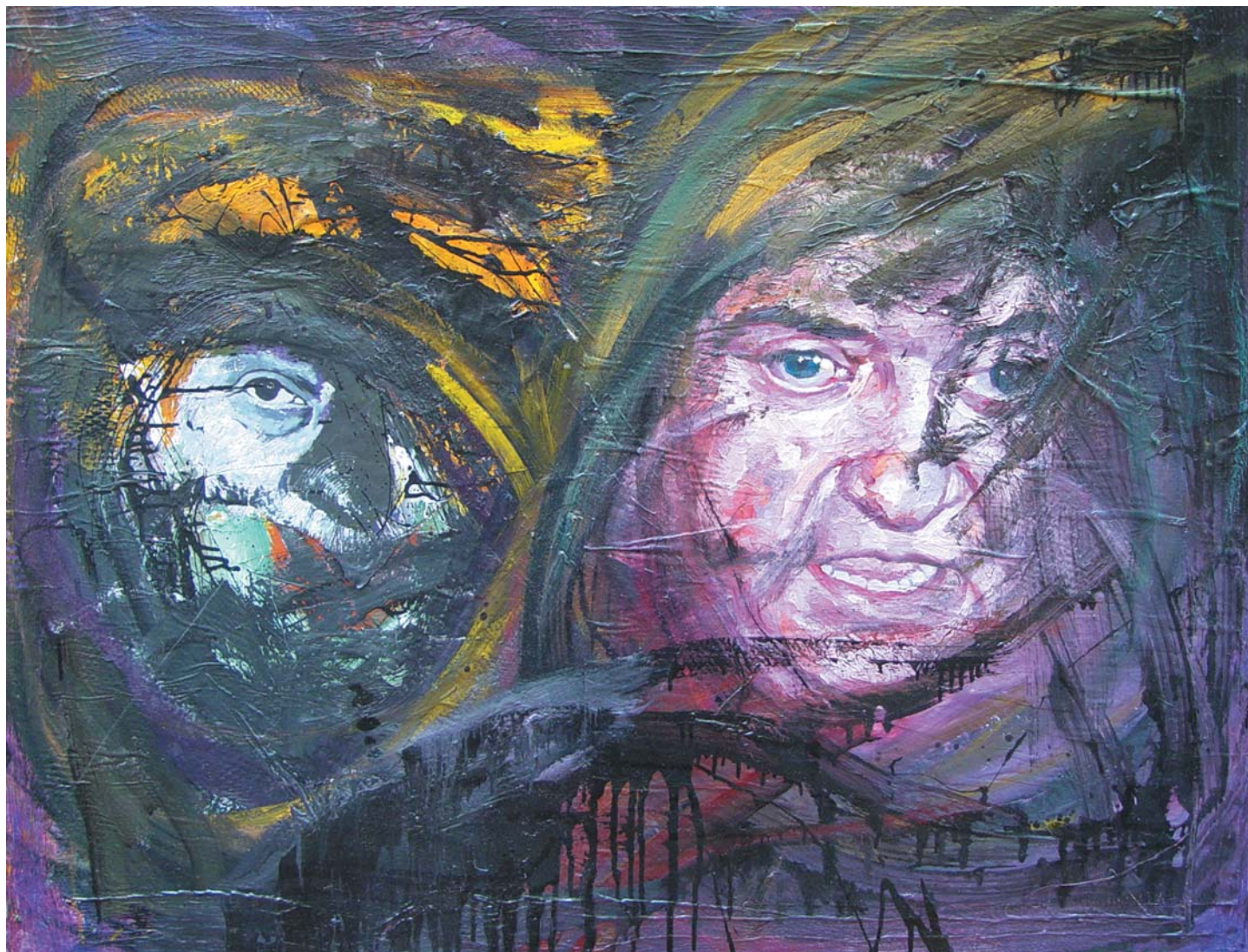
INDULAT I., 2001 olaj, farost 100x125 cm, j. l. Bihon 2001/ Impulse I., 2001, oil on chipboard