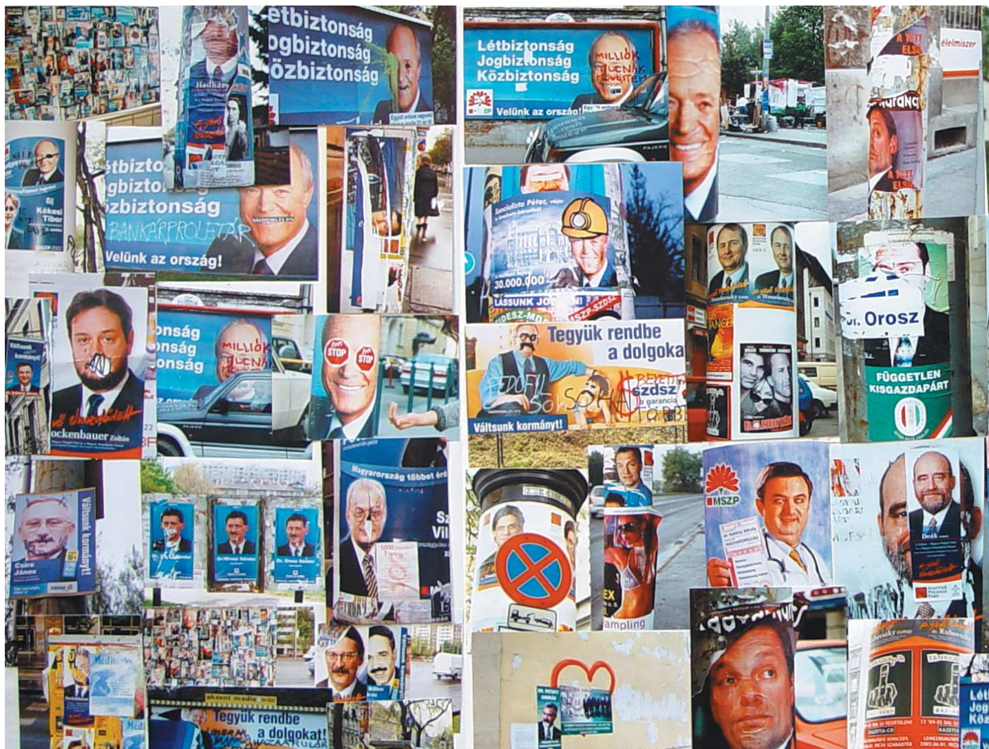
VÁLASZTÁSI NAPLÓ, (részlet) 2002 kollázs, papír 66x132 cm, j. n. / Electoral journal, 2002, collage on paper