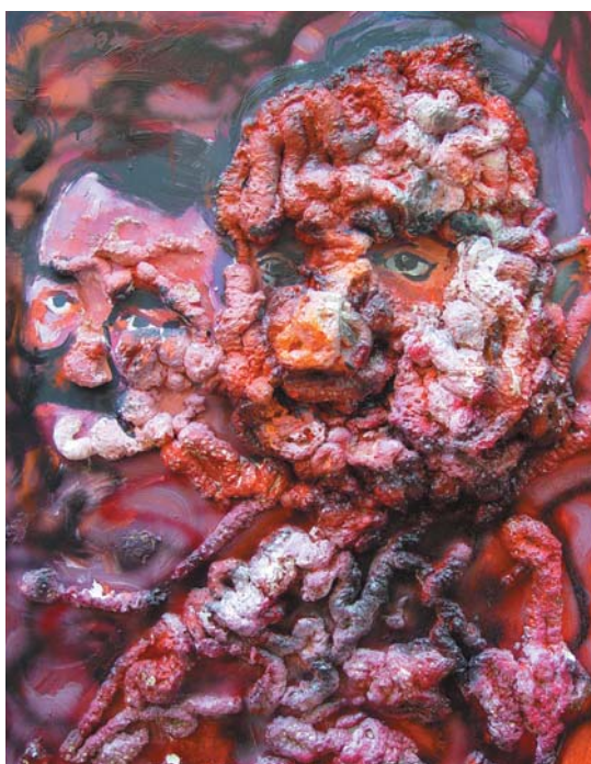
ELEVEN HÚS, 2001 olaj, farost 100x70 cm, j. n. Flesh, 2001, oil on chipboard