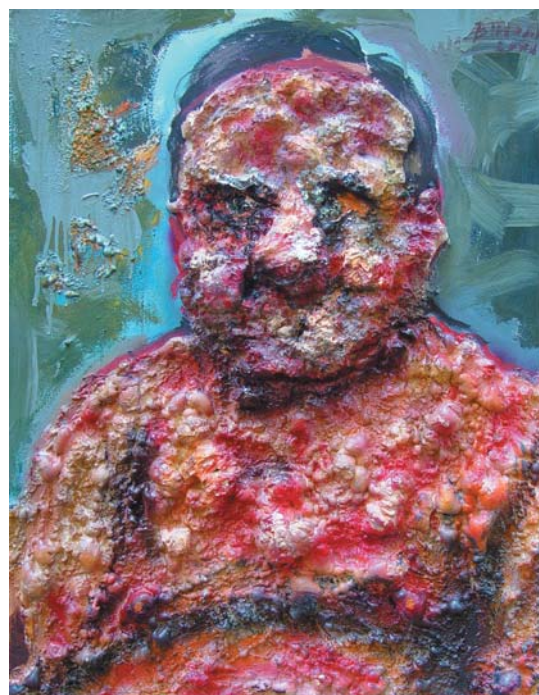
MASSZATEST, 2001 olaj, farost 100x70 cm, j. n. Pulp Body, 2001, oil on chipboard