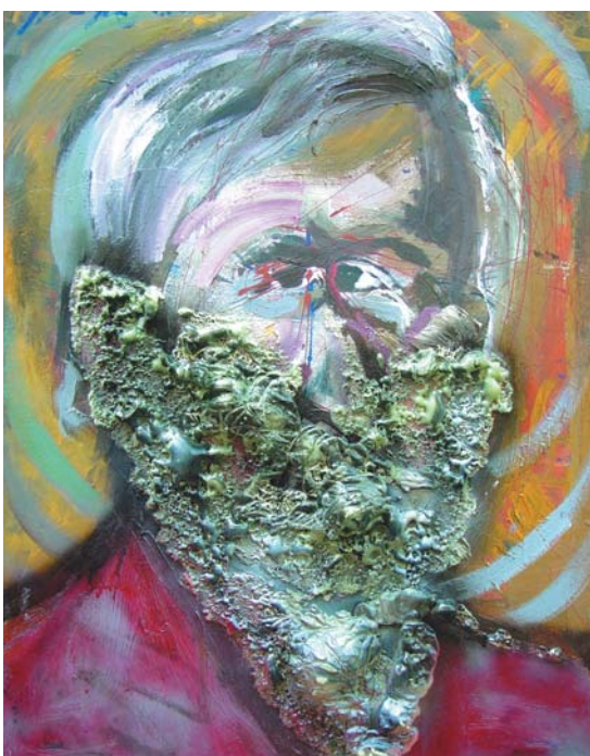
ZÖLDSZAKÁLLAS FÉRFI, 2001 olaj, karton 82x59 cm, j. n. Green-bearded Man, 2001, oil on cardboard