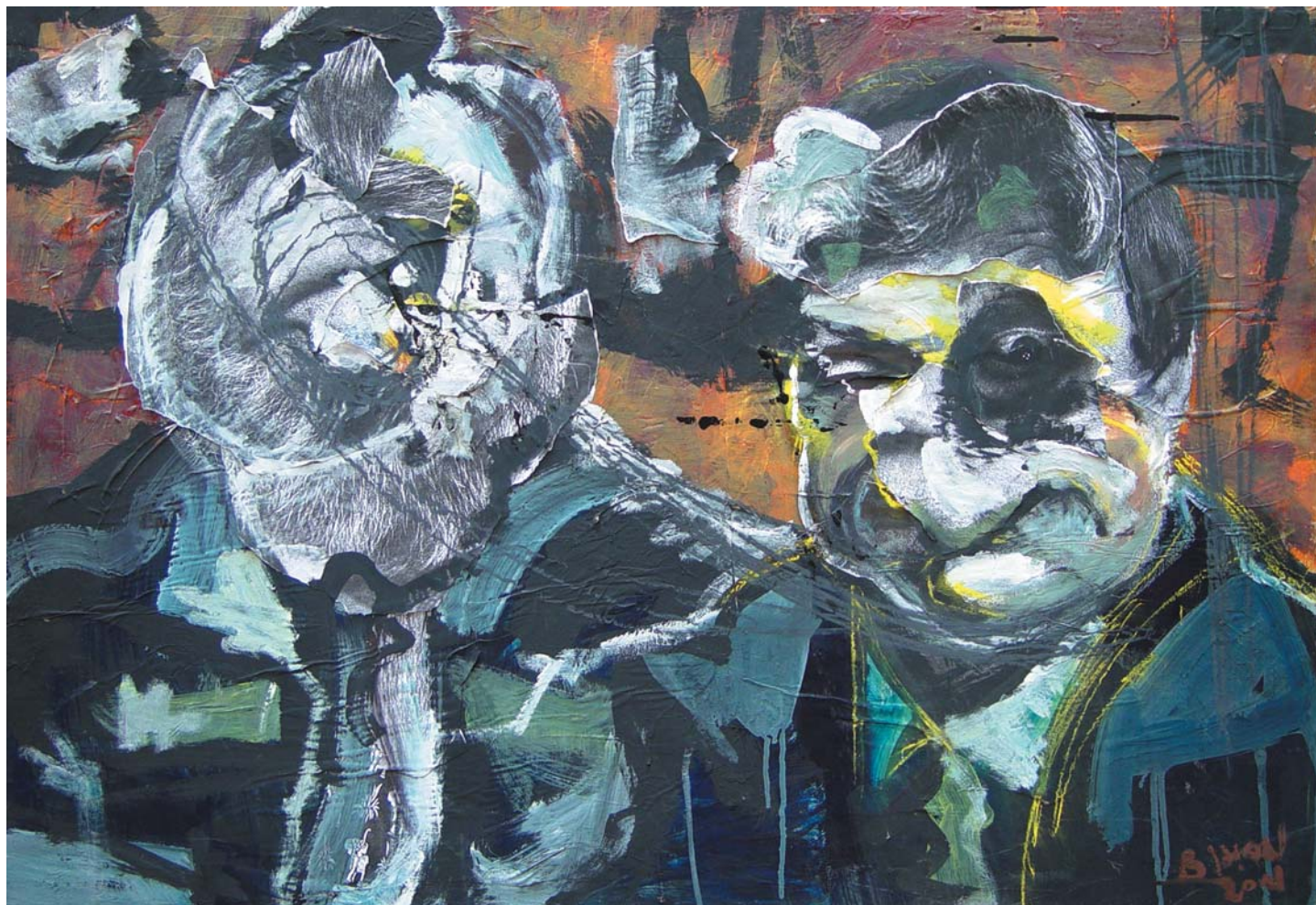
KETTESBEN, 2001 farost 70x100 cm, j. n. / Tete-à-tete, 2001, mixed technique, chipboard