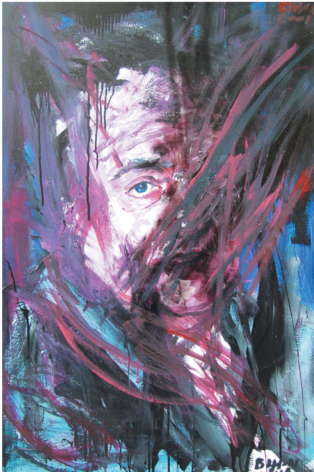
INDULAT II., 2001 olaj, farost 100x70 cm, j. I. Bihon 2001/ Impulse II., 2001, oil on chipboard