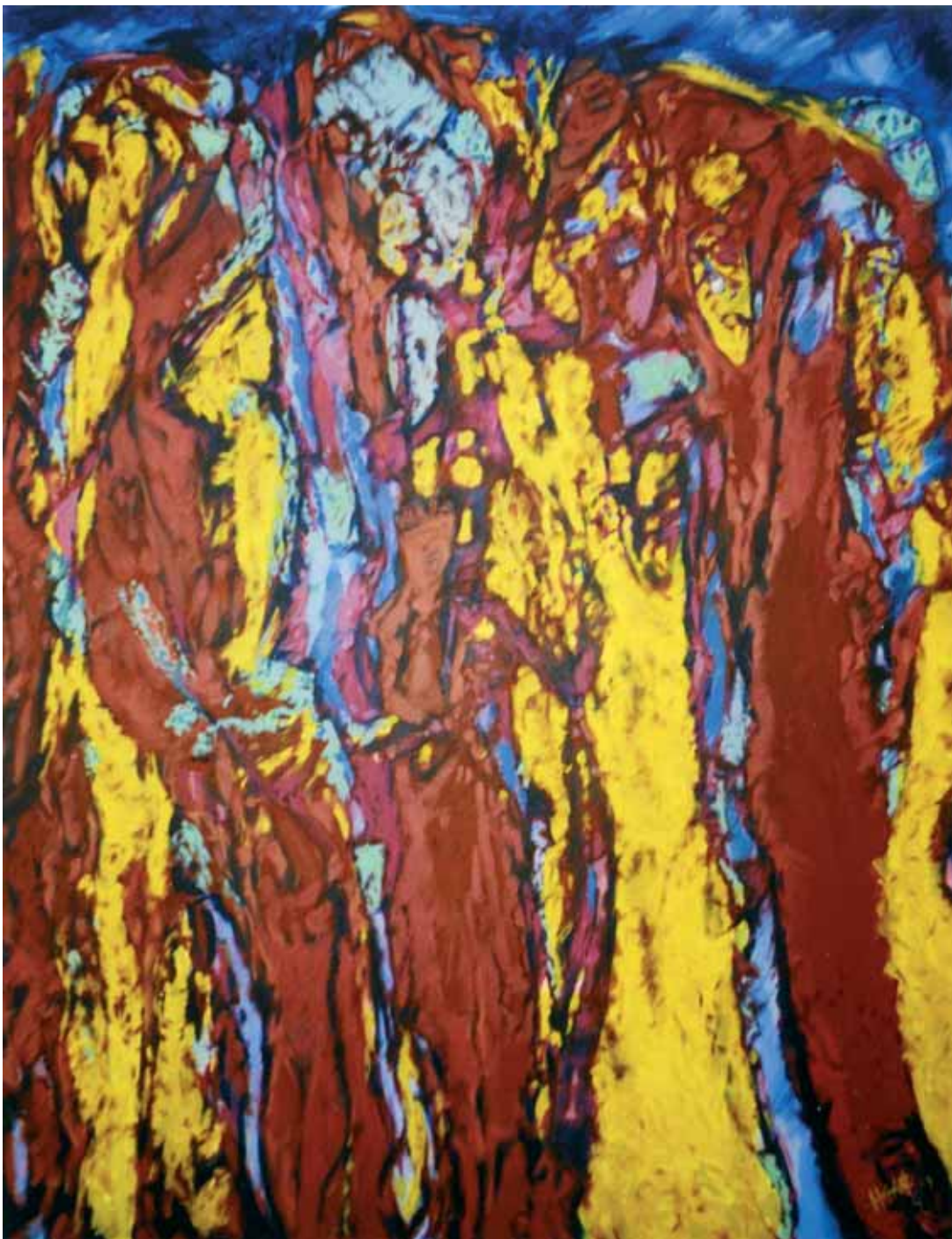
Darwin álma acryl, vászon, 150 x 120 cm, 2007