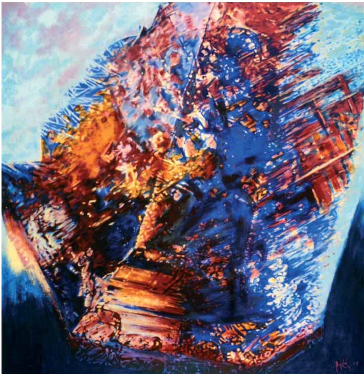
Gradáció acryl, vászon, 150 x 150 cm, 2007