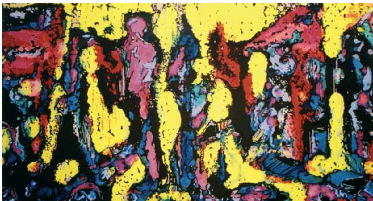
Az urak tánca acryl, vászon, 100 x 200 cm, 2007