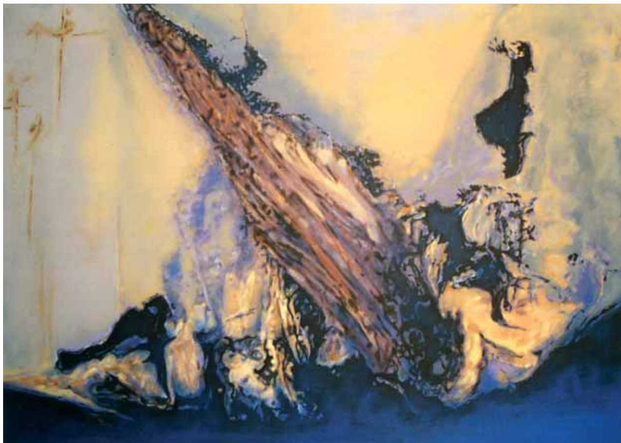
A zuhanó angyal acryl, vászon, 100 x 150 cm, 2006