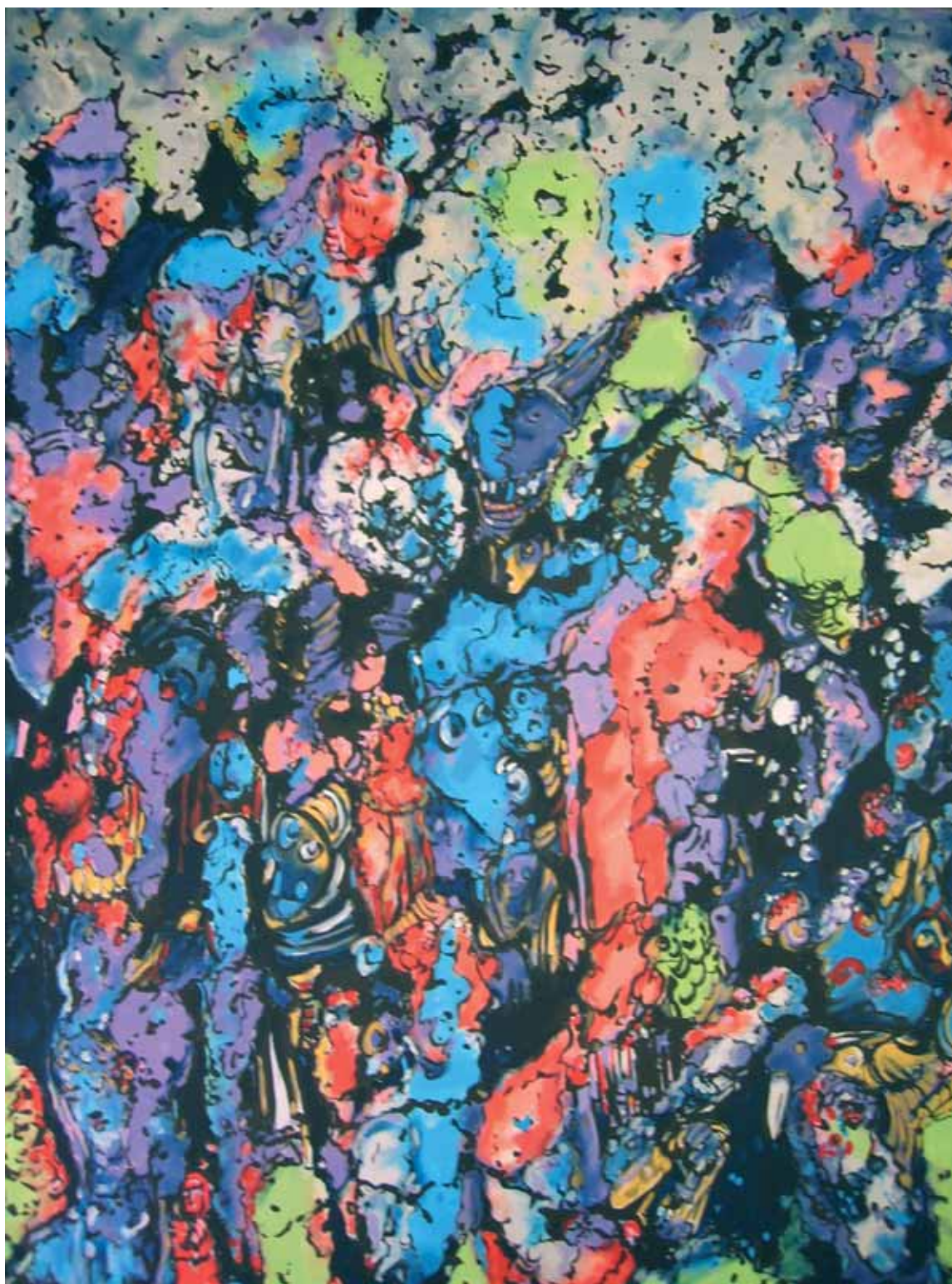
Sabbath – Boszorkányok összejövedele acryl, vászon, 150 x 120 cm, 2007