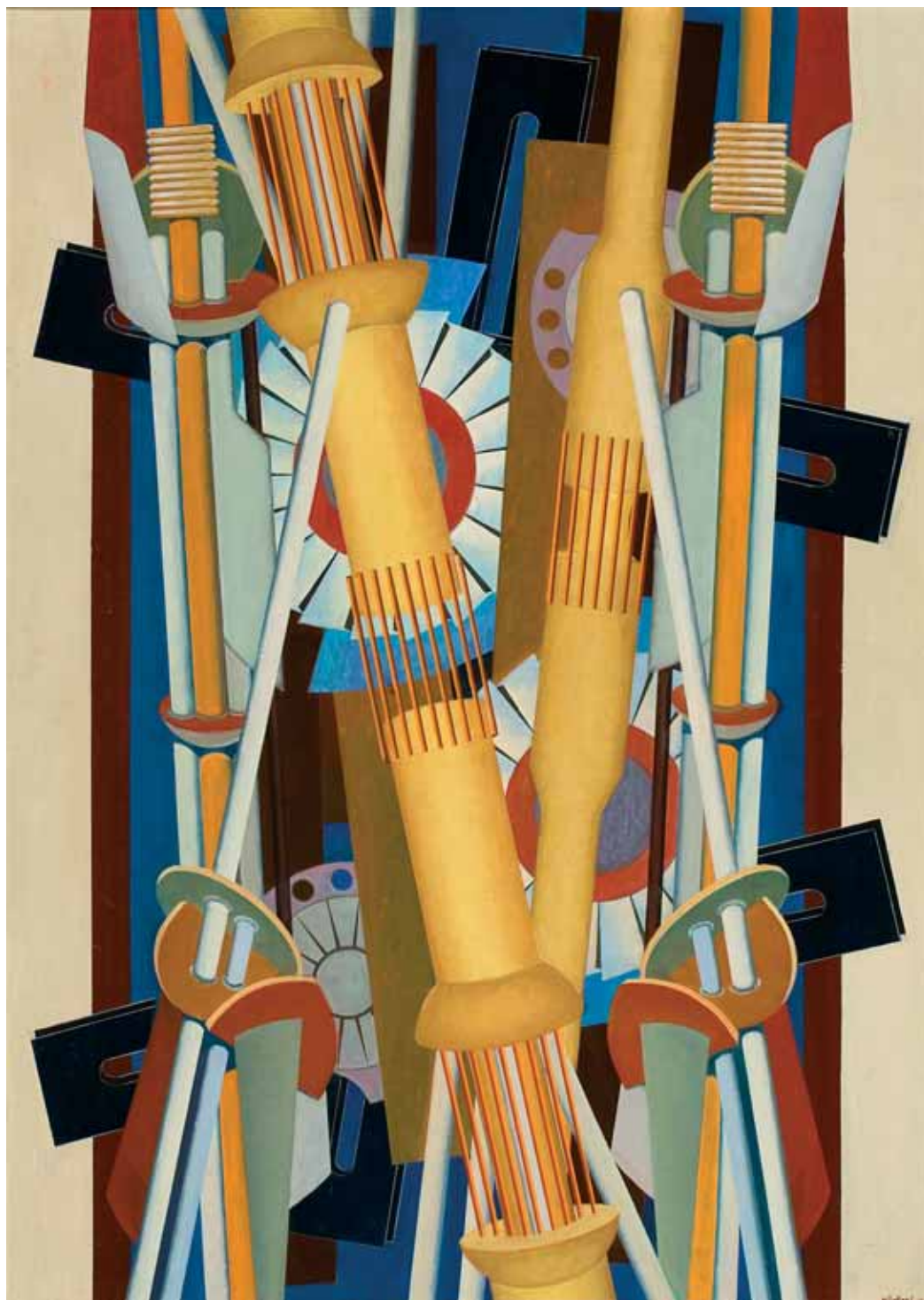
Gépi formák, olaj, vászon, 140 x 100 cm, 1970, j. l. Kántor L 970