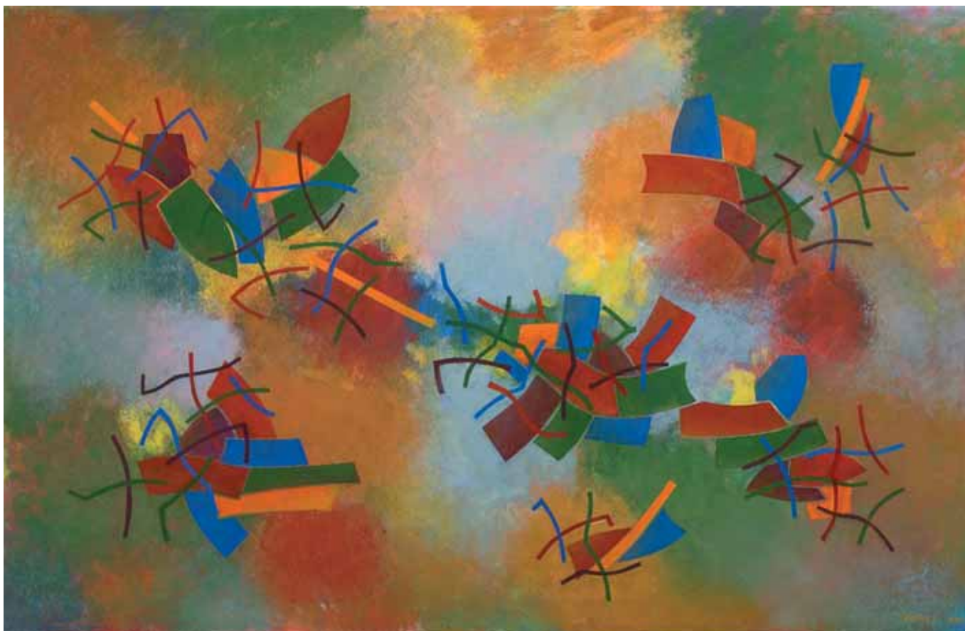
Melankólia II., olaj, vászon, 90 x 140 cm, 1990, j. I. Kántor L. 990.