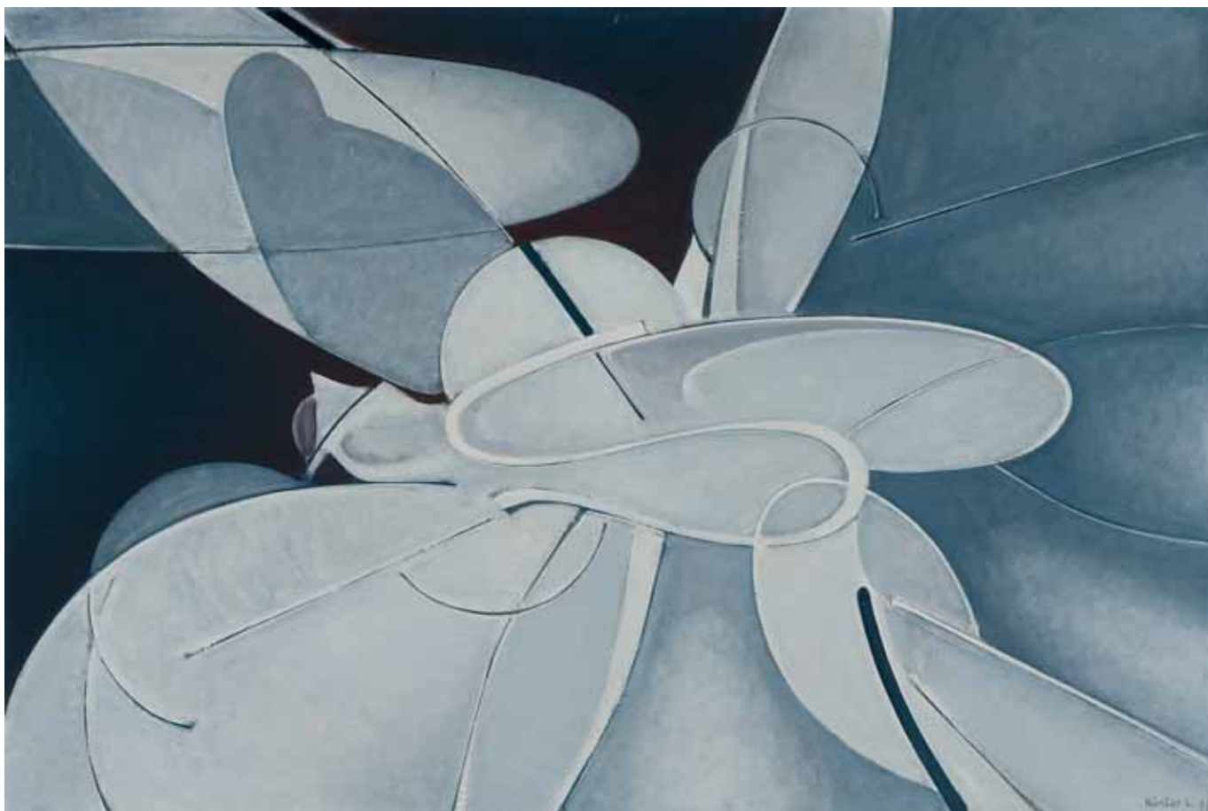
Gépi mozgásformák, olaj, vászon, 80 x 100 cm, 1973, j. I. Kántor L 973