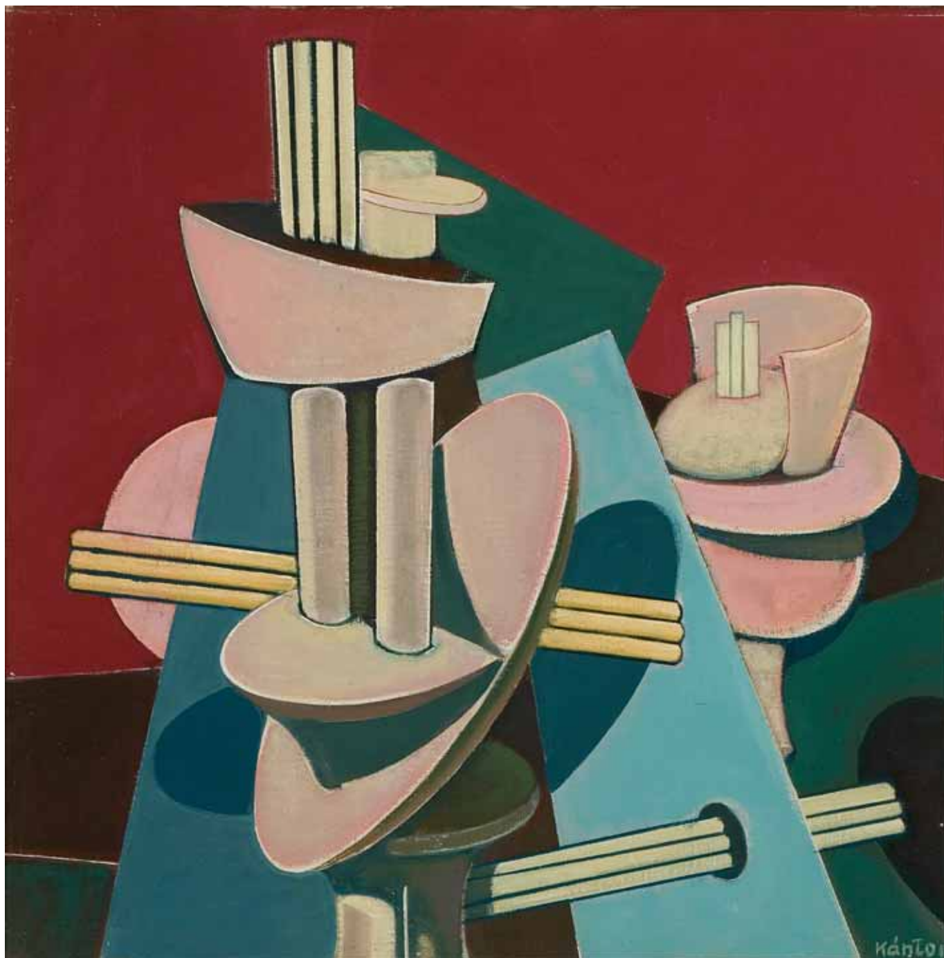
Gépi kompozíció, olaj, vászon, 50 x 50 cm, 1963, j. I. Kántor