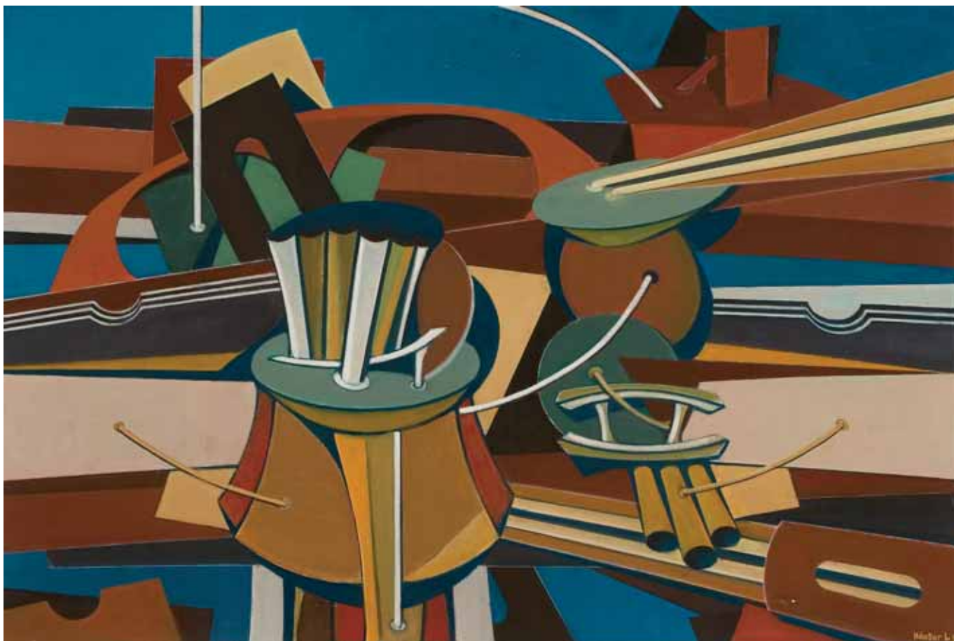
Üzemi csendélet, olaj, vászon, 80 x 120 cm, 1964, j. l. Kántor L 964