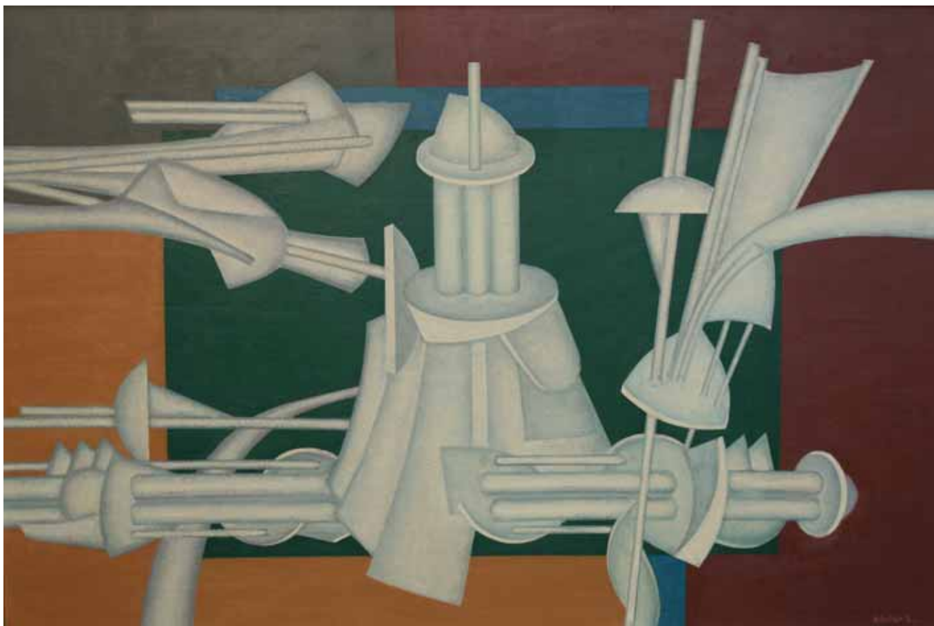
Fehér formák színes térben, olaj, vászon, 80 x 120 cm, 1967–68, j. l. Kántor L.