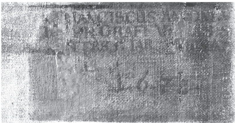
11. kép Felirat a főúri gyermek portréjáról

vehető a FRANCISCUS név, a GRAFF rangjelzés, az ábrázolt öt éves életkora, valamint egy évszám, amelynek első három számjegye biztosan olvasható: 167... , az utolsó számjegye pedig nagy valószínűséggel 8 42 (11. kép). Bár a felirat ezen töredékeinek alapján mindeddig nem sikerült megállapítani, kit ábrázol a festmény, az biztosan leszögezhető, hogy nem az 1671-ben elhunyt Zrínyi Pétert, akinek egyébként – ismert képmásai alapján – egészen sötét volt a hajszíne. Továbbá az is nagyon valószínűnek tűnik, hogy nem is egy Zrínyi gróf látható a képen, ugyanis a szóban forgó időszakban Ferenc nevű családtagról nincs tudomásunk. 43