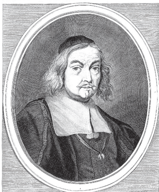
VINCISLAO PRINCIPE DI LOBKOWIZ, DVCA DI SAGAN, CONTE DI STERNSTEIN S. RO DI CHLVMIZ, E RAVDNIZ CAVALIERE DEL TOSON D'ORO, PRIMO CONSIGLIERO DI STATO, E MAGGIORDOMO MAGGIORE DI LEOPOLDO IMPERATORE . &