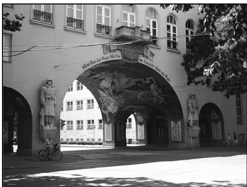
A Hősök kapuja

leverni ezt a freskót. Objektív káromkodás az, amit Krisztus alakjával elkövettek: olyan, mint valami abesszin herceg, rossz ránézni. Bütykös ujjai, kidülledt szeme, torz homloka sírásra fakasztja a négy éven aluli félénk kisgyermekeket. És azok az angyalok! Bizonyára a Csillag-börtönből hoztak ki néhány életfogytiglanit modellül. De még őket is eltorzítva festették oda.