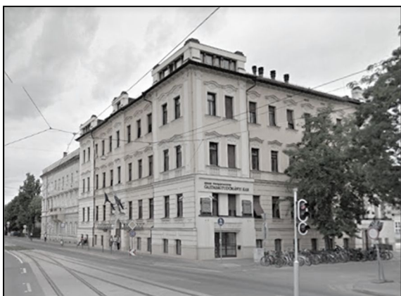
Az egykori jezsuita rendház ma

Olyan boldogan közeledtem a ház felé. Az volt a benyomásom, hogy egy fellegvár emelkedik előttem. Ezt az illúziót csak fokozták a tető balusztrád-díszzei s a kapu kiképzett alakja. Fellegvár! Isten elszórt erődítményeinek egyike. Az összeszorított-fogú, kemény jancsárok fellegvára. Mátyás király híres fekete-serege. Van abban valami nagyszerű: ide tartozni, ezt a természetfölötti erődítményt lakásul bírhatni.