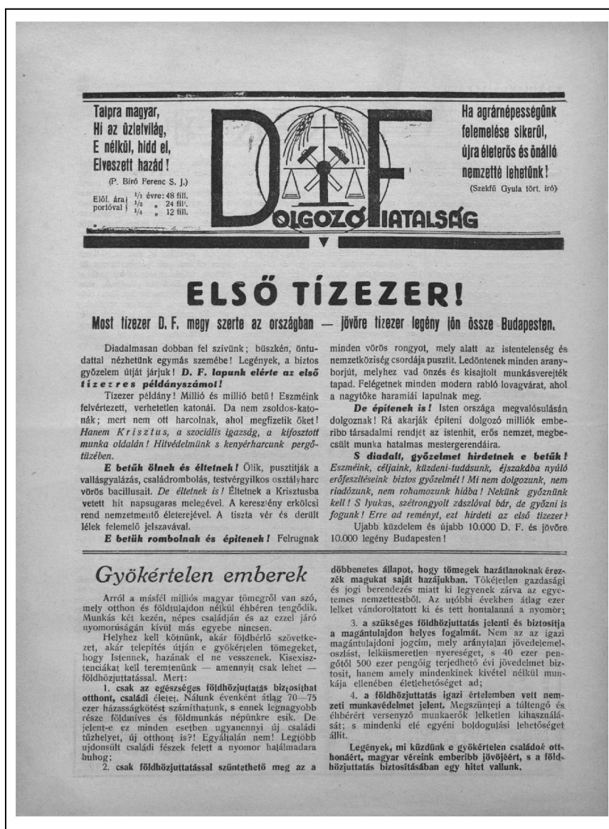
A "Döfi", azaz a Dolgozó fiatalosság, a KALOT havilapja

Ma 21 helyről 1110 új Döfi 130 rendelet hozott a Központba a posta!!!