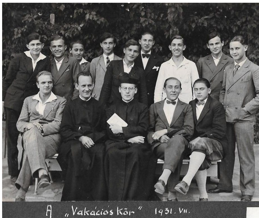
Magiszterként diákok között Kalocsán