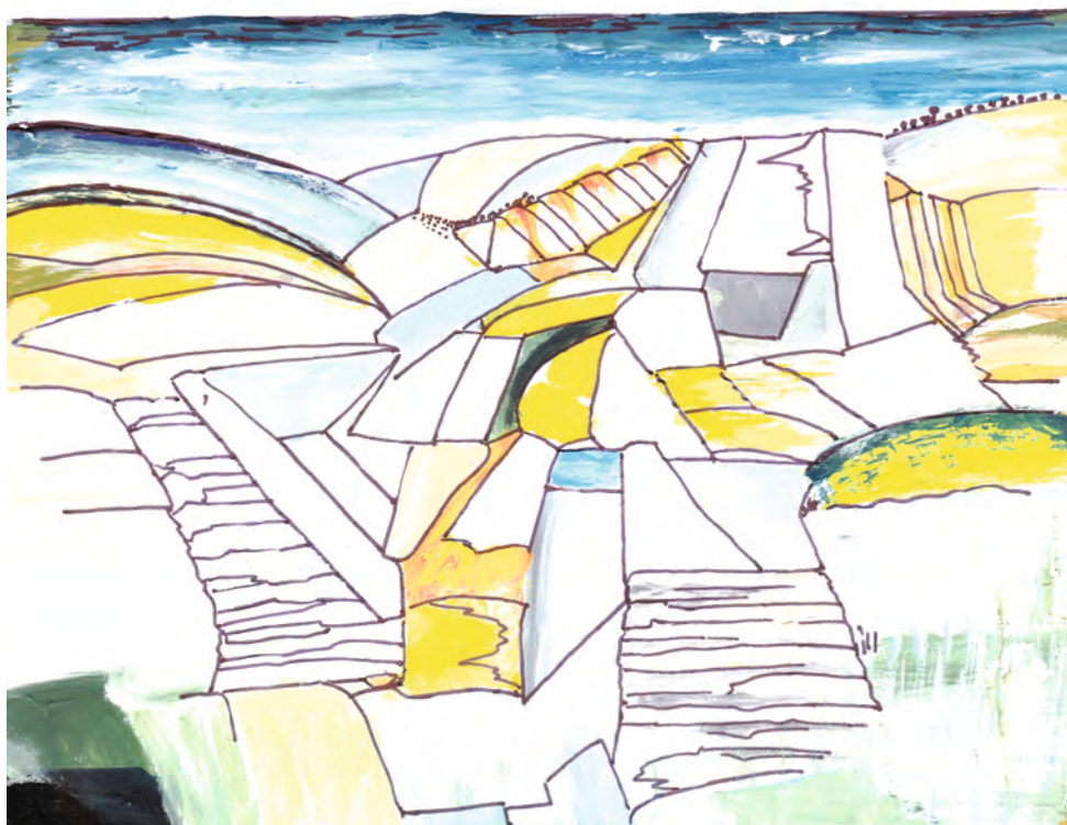
Este a parton