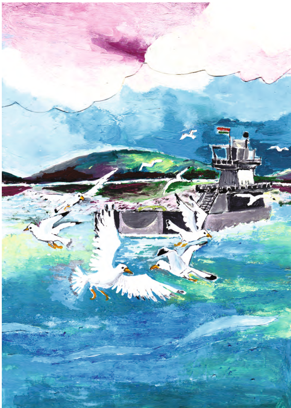
Sirályok a révnél