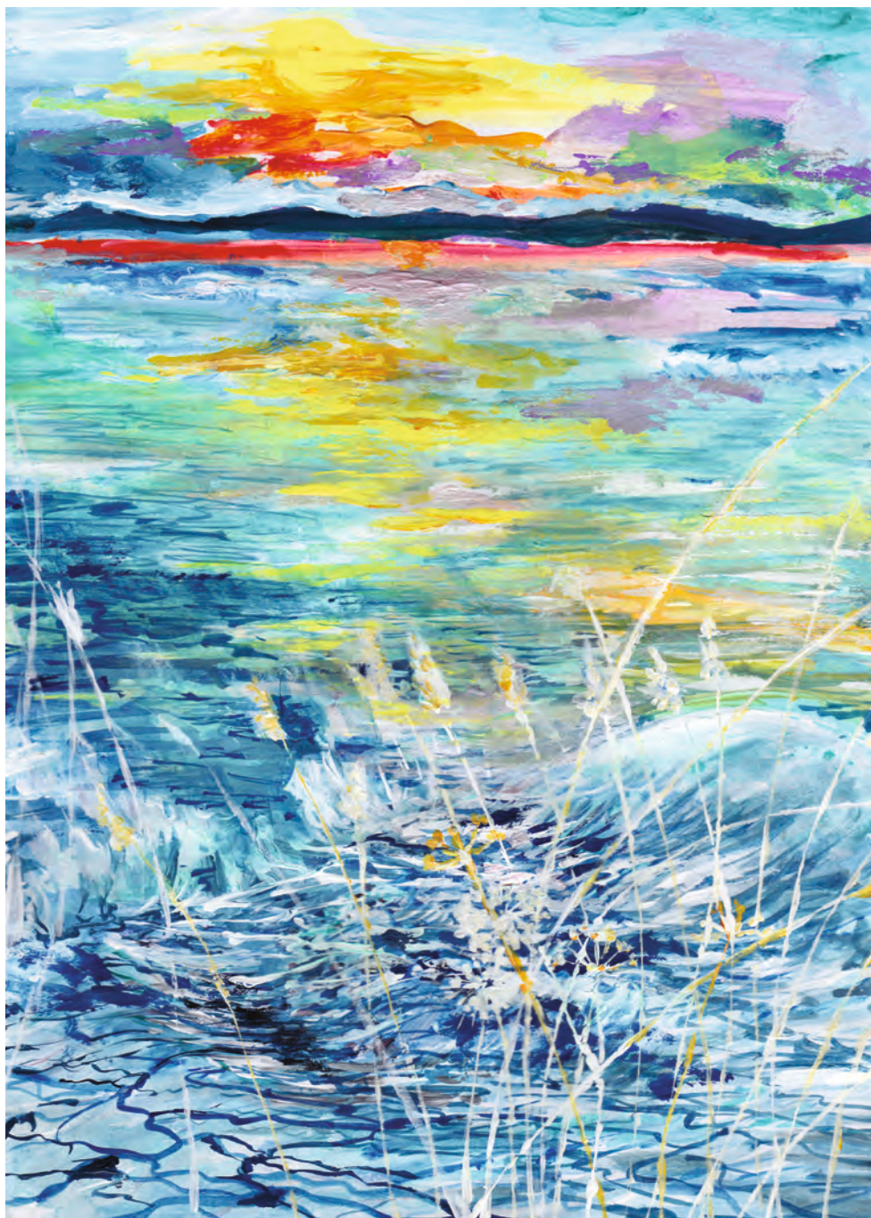
Fények a vízben