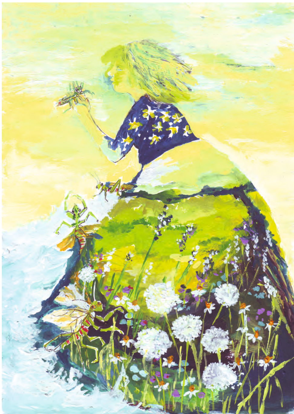
Sáska a vállamon