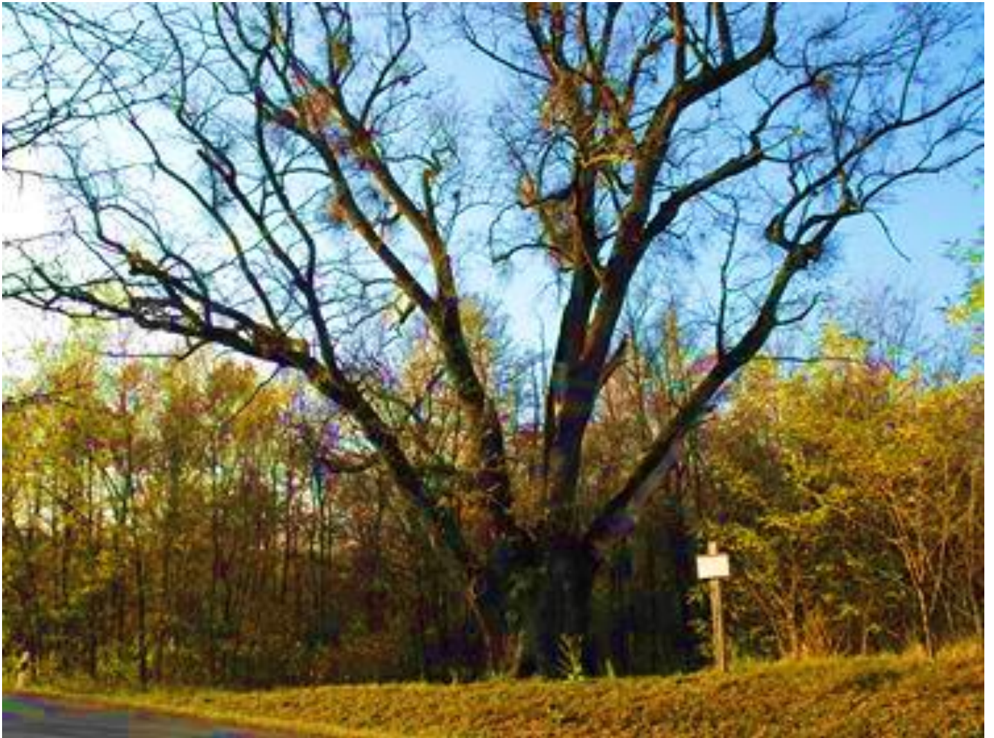
Fénykép: Varga Ferenc 2018. november.4..