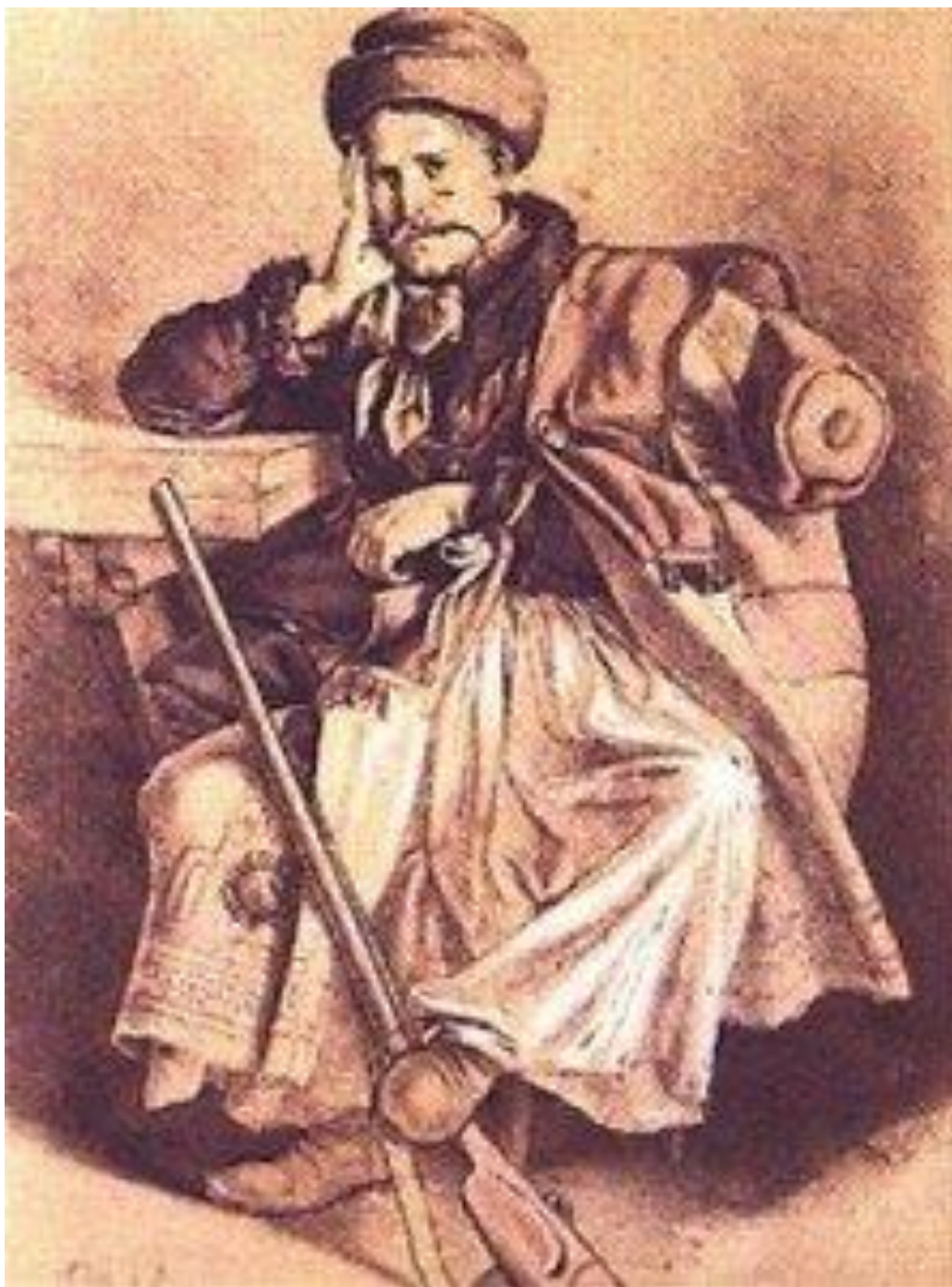
Patkó Bandi a betyár