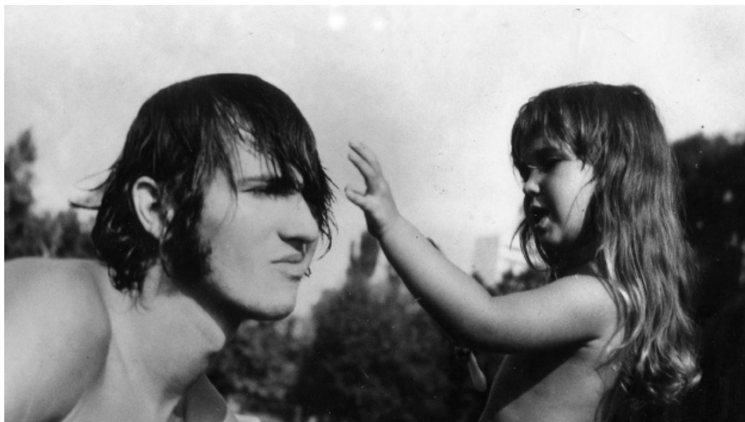
Legnagyobb fiam, mikor még a legkisebb volt