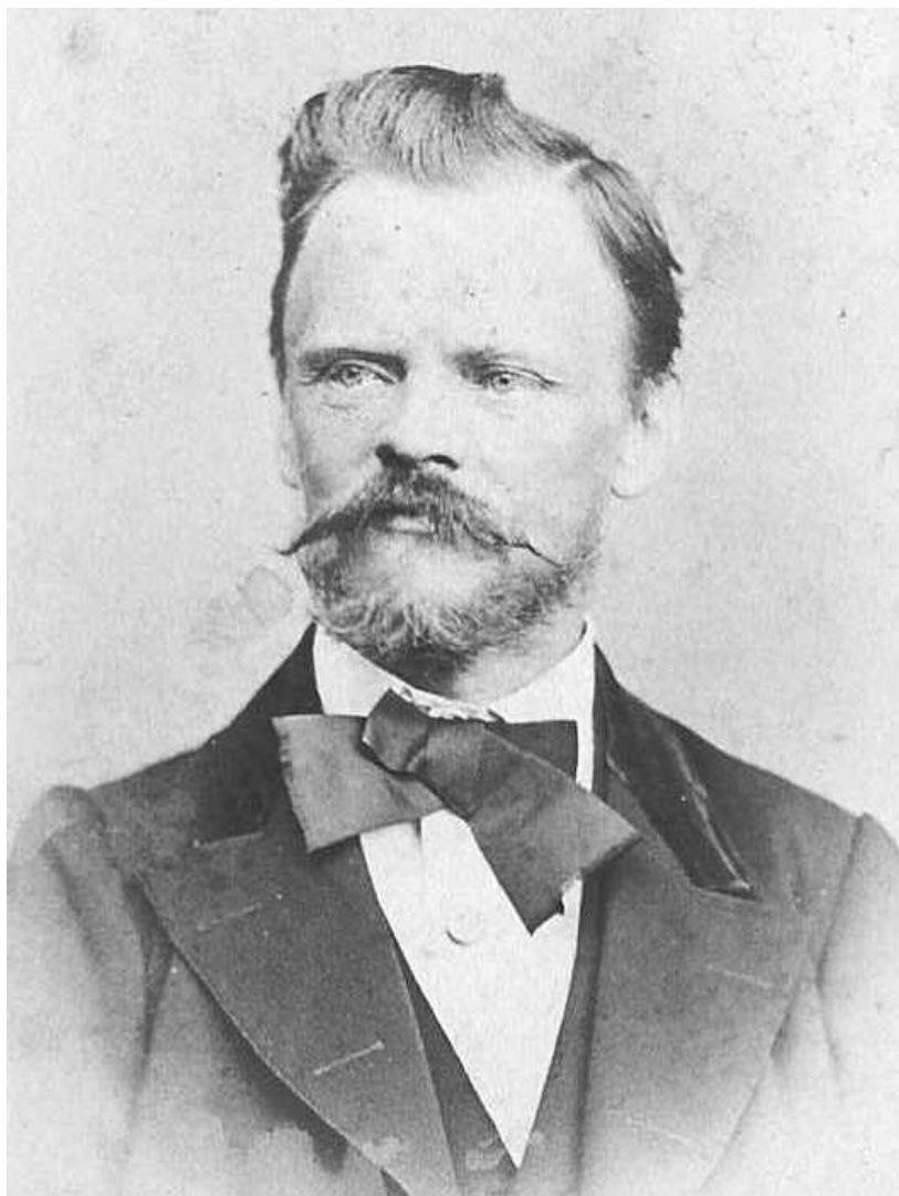
Wittich Lajos (1832 Szomolnok – 1904 Turia-Remete)

A tálas, korsós korongosok két kézzel nyomják össze, domborítják, homorítják, vonalzóval egyengetve az agyaggombócból kiformált valamit, melyből mégiscsak formás tál, szélke, csupor, korsó, bödön lesz.