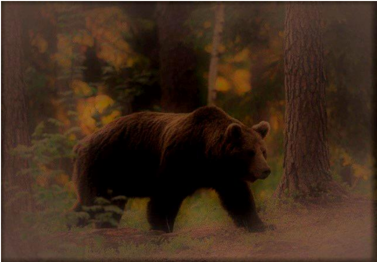
Magányos medve óvatosan lopakodik a Toldi kunyhóhoz

Pissz! Maradj csendben! A fenevad érzi, hogy bent vagyunk. – suttogta, miközben ő is egyfolytában remegett.