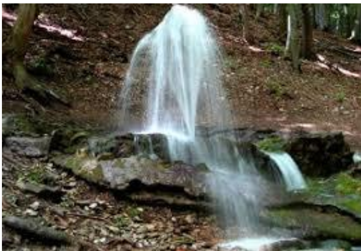
Az időszakos Vöröskő-forrás működés közben