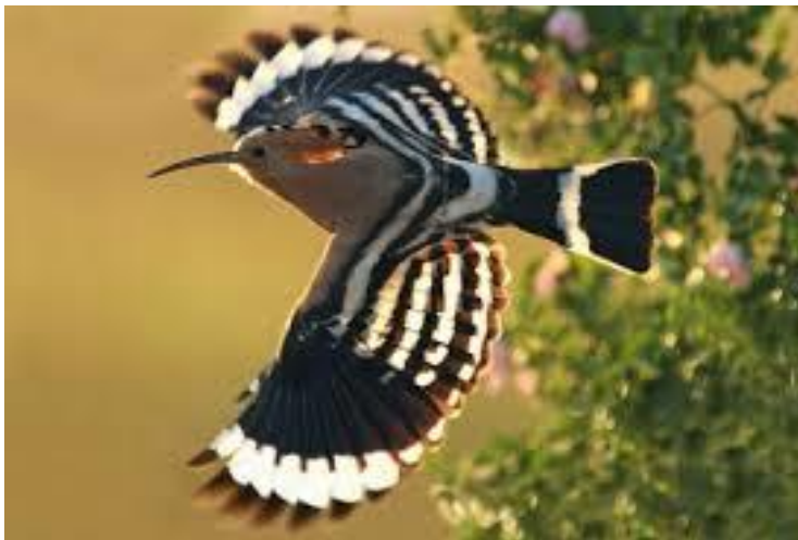
A káprázatos tollazatú búbosbanka libben a fák fölött

A délről visszatérő vándormadarak sokasága röpködött a tavasszal megújuló erdőben. Talán a tavalyi fészkeket keresték, melyeket a téli viharok megtépáztak annyira, hogy teljesen újjá kell építeni. Amelyik már elkészítette az idei fészket, a tojásokat bele tojva, nagy reményekkel ült a tojásain.