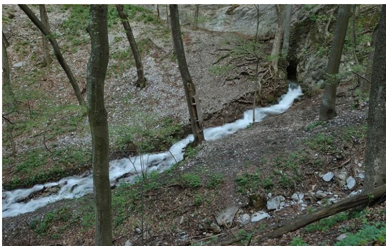
Az Imó-forrás távolról

Amikor beteltek a látvánnyal, felkapaszkodtak az Imó-kőre , hogy távolabb lássanak.