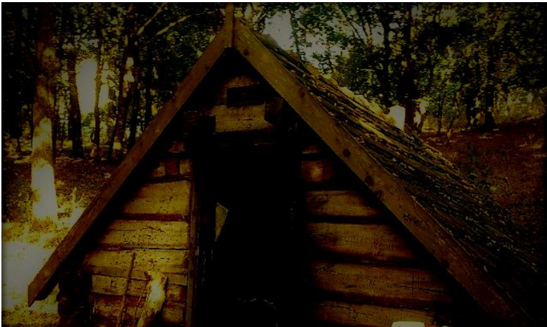
A Toldi kunyhó az esti szürkületben, közelről

A kunyhó egyik sarkában, a pókháló fogságában, egy csodálatos színekkel megáldott lepke verdesett kinyájában, melyre már a prédára leső pók szemet vetett és gyorsan közeledett feléje. A betolakodók megjelenése mentette meg a színes pillangó életét, akik saját gondjukat most feledve, kiszabadították a fogságba esett áldozatot.