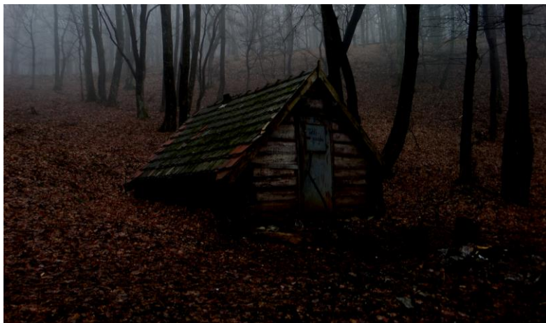
A viharban az esti homályba burkolózó Toldi kunyhót pillantják meg

—Gyertek! Gyertek! Igyekeztek minél gyorsabban, mert ott, kívül, az élet semmit sem ér!