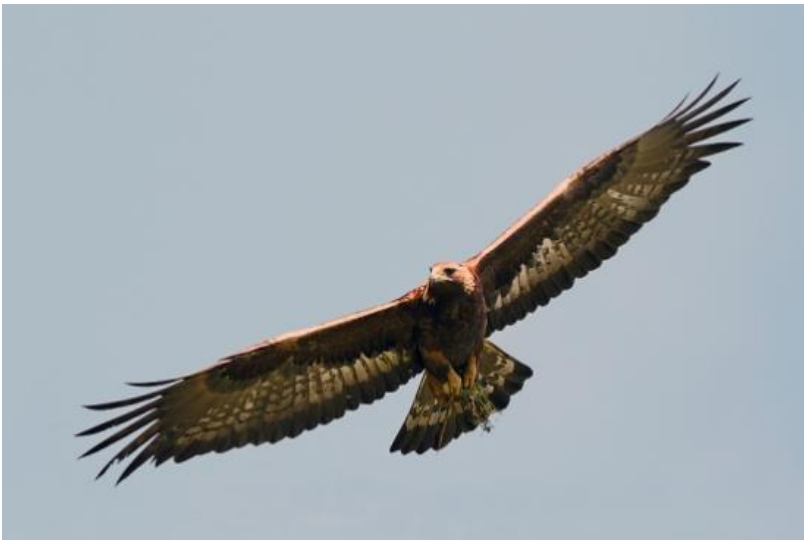
Vadászgató karvaly éberen köröz a légtérben

Megélénkült az itthon telelő madarak világa, akik a vándormadarak visszaérkezésével megsaporodtak. A busz ablakán kitekintve, a fák fölötti légtérben, karvaly körözött szélesre tárt szárnyaival. Éles szemeivel figyelte az alatta felbukkanható eleséget, hogy aztán hirtelen lecsapjon áldozatára.