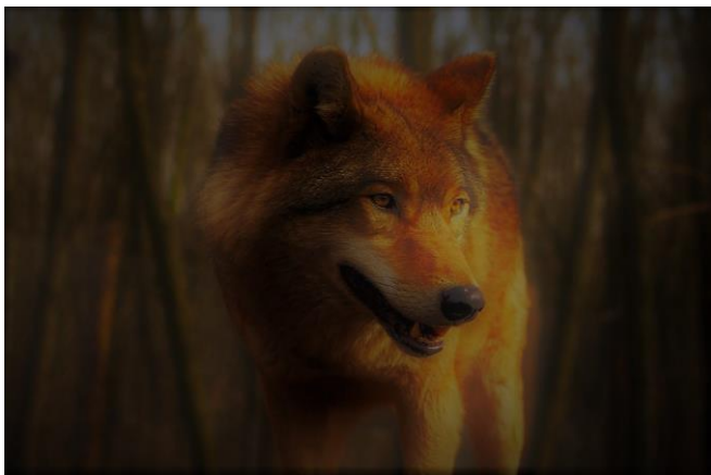
Magányos farkas érdeklődéssel figyeli a tévelygő turistákat

—Robi! Robi! Mi az ott a fák mögött? Talán egy farkas? – kérdezte Zsófi kétségbeesve és erősebben kapaszkodott szerelme karjába, mintha ő farkasokkal szemben megtudná védeni.