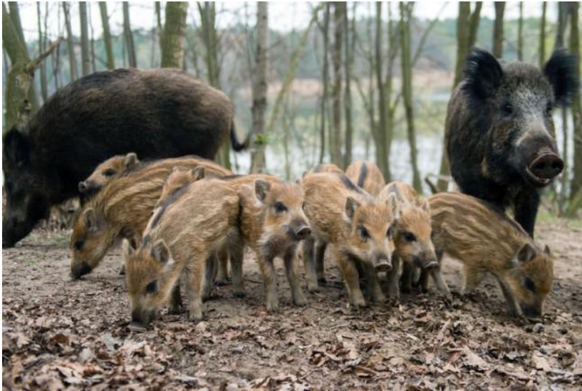
Vaddisznó konda éberrel figyeli a betolakodókat

emelkedője felé, elvonul a nyugalmaiban megzavart konda. Sok, csíkos kismalac volt látható a nyájban, melyeket több anyadisznó és néhány agyaras kan, haragos rőfögés mellett kísért az emelkedő felé. Nem tellett el ötpercnyi idő sem, amikor eltűntek a turisták szemei elől.