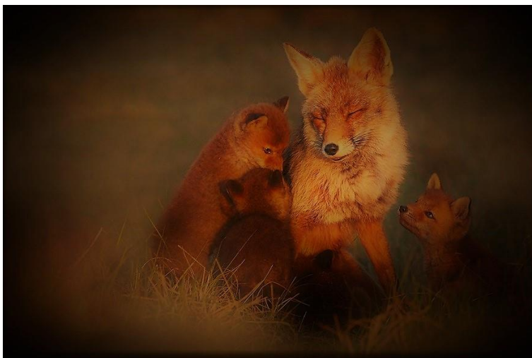
Az kotorékjába érkező rókát már az éhes kölykei várták

Az ijesztő fellegek oszladozni kezdtek, miután egy leheletnyi derengés látszott a kunyhó résein keresztül, a majdnem felhőket súroló fák fölött. Majd itt is-ott is egy-egy csillag jelent meg az égbolton, hiszen a nap végére már besötétedett az erdő még a zivatar nélkül is. Majd teljesen kitisztult az égbolt, amelynek boltozatáról néhány csillag elindult és hullott a semmibe, a határtalan Univerzumba, kisebb fénycsóvát festve maga után az ég kupoláján.