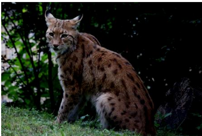
Prédára várakozó hiúz

Nem oly távolról bagoly huhogás hallatszott. Ez az ismétlődő huhogás tovaterjedt a hegyek között, vagy a bércekről visszaverődött. Így aztán ember legyen a talpán, aki megtudná mondani, valójában melyik irányból jönnek az eredeti hangok. A társát, akinek jelzett, már nem csapták be a hangokat visszaverő hegyek ormai. Pontosan tudta, hol vár rá a párja, akit a vihar szakított el tőle. A huhogást hallva, felröppent a fáról és az éjjel is látó szemei segítségével biztonságosan repült a besötétedet erdő sűrű fáinak között.