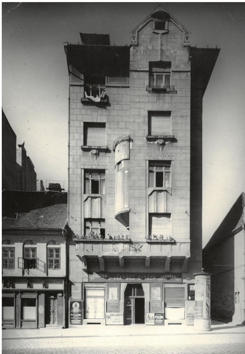
1. Budai Vár, Tárnok u. 8. a Radulescu család háza 1922-ig