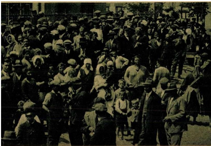
6-7. A rendőri és katonai bizottság megérkezik a dráma színhelyére