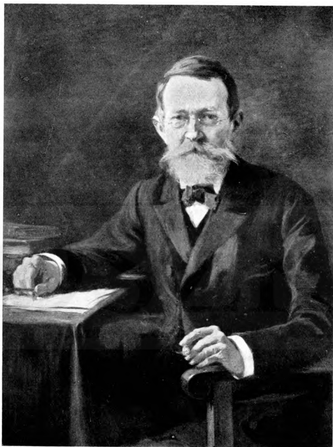
ID. SZINNYEI JÓZSEF a hírlapkönyvtár megszervezője és első igazgató-őre.