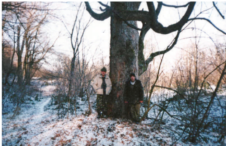
A nagy juharfa télen (bal oldalon a szerző)

Lassan kezdtem összeszedni gondolataimat, és szerencsére pillanatok alatt minden beugrott, már tudtam, hol vagyok és miért.