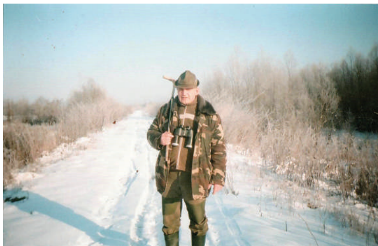
2013. március 17. Igen fagyos március volt

Megtapogattam a lámpámat, helyén volt. Bódultságom kezdett fölengedni, letettem puskámat, hogy elgémberedett lábaimat kissé megmozgassam, hogy a vér újra normálisan keringjen bennük. Ránéztem az órámra, negyed egy volt. Jót aludtam – gondoltam magamban. Éppen cigaretta után kutattam a zsebemben, mikor jobbra tőlem és a hátam mögött a gyümölcsös irányából ágrecsenést hallottam. Kézbe vettem a fegyveremet és a lámpát, s feszülten figyeltem. A zaj egyre erősödött. Arra gondoltam, hogy több disznó jön fölfelé a gyümölcsösből éjjeli portyájukról a biztosabb erdőbe. Megvártam, míg a zaj kiér az erdei útra, és akkor rákapcsoltam az elemlámpát. Míg a vad jött felfelé, én is féltérdre ereszkedtem, és bal kezemmel a csó alá szorítva a lámpát, rávilágítottam a vadra. Mondhatom, nagyon meglepődtem, mikor a vélt disznó helyett egy hatalmas medve körvonalait vettem észre.