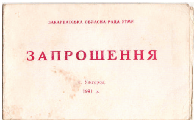
Az 1991. évi vadászkonferencia meghívója és a mandátum