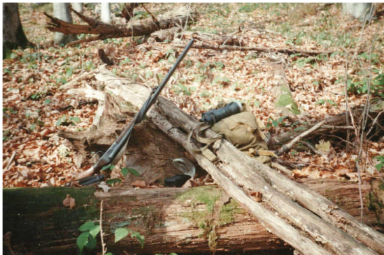
Hűséges társaim: az öreg tizenkettes, a gukkerom és a hátizsák

hogy neked is kellesz, ezért itt van neked is egy szál” – s a konyhasztalon álló vázára mutatott, melybe egy egész csokor tubarózsa volt helyezve. Megörültem a virágnak, melyből egyet leszakítottam, és beillesztettem a kalapom szalagja mögé.