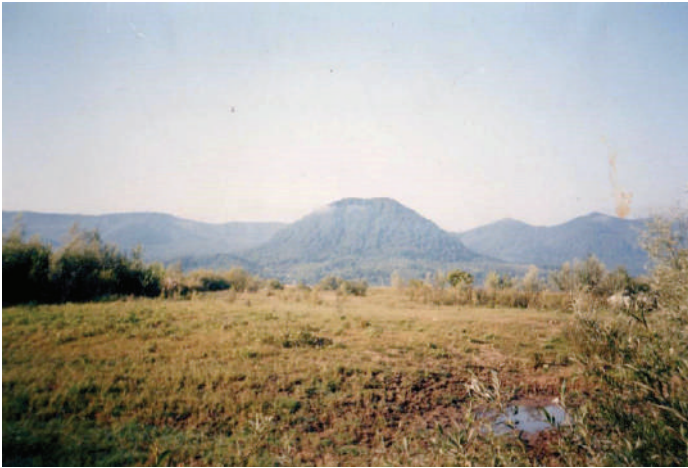
A Várhegy (Visk-várhegy) északkeleti oldala a Tisza partjáról fényképezve

Elég sokat jártam utána, végül is sikerült elkapnom. 2015. május 1-én már befizettük a kilövési engedélyeket őzakra, de még nem kaptuk kézhez. Ez nálunk ugyanis hosszabb huzavona. Úgy történik, hogy egy vagy több engedélyt adnak ki, brigádokra, tíz-tizenöt emberre. Mikor megkapjuk az engedélyeket, úgy osztjuk be, hogy akinek ideje van szombaton, vasárnap, vagy éppen nem dolgozik valahol külföldön, akkor az illető jelzi az illetékes személyeknek, hogy mikor és melyik területre kíván menni, lehetőség szerint a hozzá tartozó brigádba.