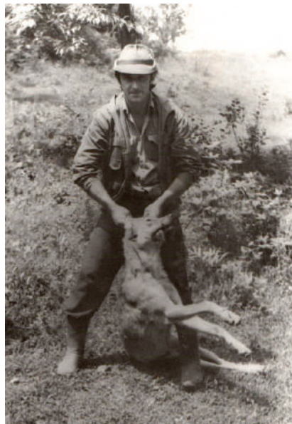
Farkasvadászat, 1989. június 2. Visk, Polján terület. Az elejtett vad 37 kg volt