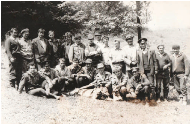
Farkasvadászat, 1989. június 2. Visk, Polján terület

Mivel 1982 novemberének elején engem választottak meg a Viski Vadászegyesület alelnökévé, szabad mozgásom volt vadászterületünk minden részén. Alapjában véve az alelnök töltötte be a vadászmesteri posztot, akinek szerveznie kellett a vadászatokat, a dúvadírtást, az etetők karbantartását, és háromhavonta jelentést kellett írnia mindezekről.