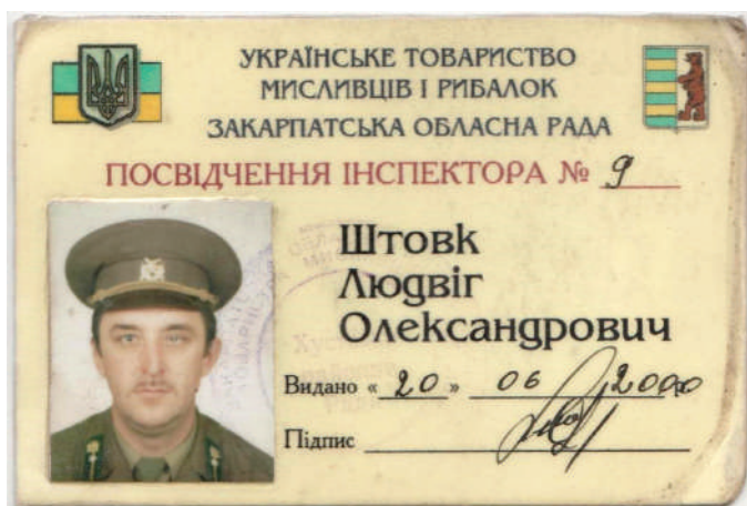
A szerző vadőri igazolványa Kárpátalja címerével, a medvével a jobb felső sarokban