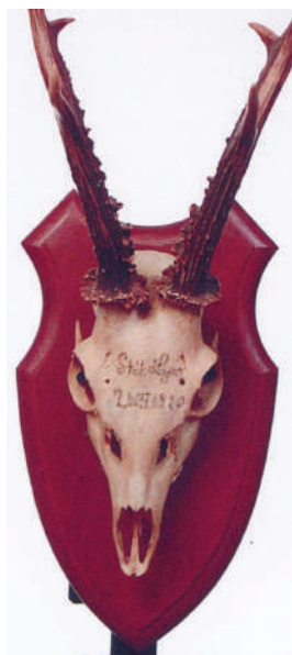
A várhegyi bak