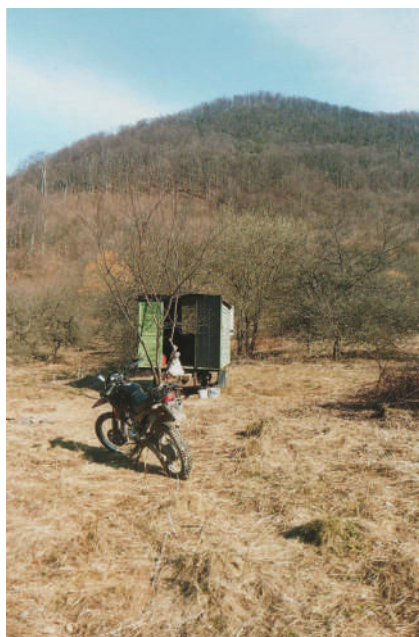
Bálint bácsi motorbiciklijé