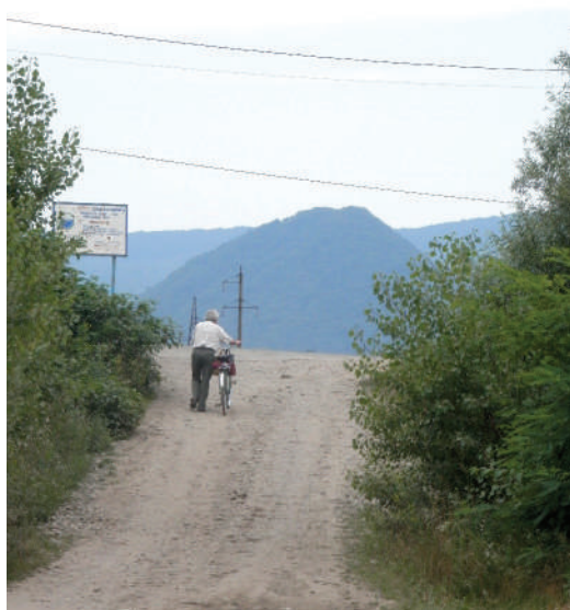
A Várhegy a Tisza-partról

emeltem a fegyvert, és amikor a vállamon volt, lassan jobbra fordultam. Megcéloztam a lapockáját, mert keresztben állt, és lőttem. A bak két hátulsó lábára emelkedett, nagyot ugrott előre. Nem futott, csak lépésben indult el, csak néhány lépést tett, és újra megállt. Rajta tartva fegyverem a balcsőből is tüzet nyitottam. Összeesett. Nem hittem a szememnek. Álmodom, vagy ez a valóság? Odamentem hozzá, s levettem a kalapomat. Le is vehettem, egy ilyen bak előtt ez a minimum, hogy a vadász leveszi kalapját, megadja a tiszteletet a vadnak. Ilyen egyszerű? Hány hajnalt, hány estét jártam utána, és még csak nem is láttam, csak hallottam.