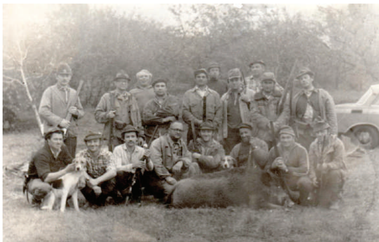
Egy emlékezetes vaddisznóvadászat

az idő, a hegy meg igen meredek volt. Odaértem a kitervelt helyemhez, egy a fák között keresztbedőlt tölgyfát néztem ki ülőhelyemnek. Ráraktam hátzszakomat, majd kényelmesen elhelyezkedtem rajta. Még igen korai volt az idő, a fák körvonalait tudtam csak megkülönböztetni. A puskámat mindig a térdemen helyezem el úgy, hogy a markolat minden esetben a jobb kezemhez essen, míg a csövet bal kézzel fogjam. Közben egyre jobban világosodott, már bármilyen vadat meg tudtam volna különböztetni. Jobbra nézve, amelyik irányból érkeztem, elállt a lélegzetem, a nyomomon keresztben állva egy hatalmas gesztenyebarna disznó állt, mereven, akár egy szobor. Azt hittem, álmodom. Csöndben megfogtam a puskámat, előre toltam a biztosítót, és mivel bal vállról nem tudok lőni, szép lassan áttettem a puska a jobb kezembe. Hiába volt hűvös a reggel, izzadni kezdtem. Már a jobb kezemben volt a puska, de nem tudtam, hogy emeljem vállhoz, és a vaddisznó kezdett fülelni, valami nagyon nem tetszett neki. Úgy döntöttem, hogy hirtelen fordulással fogok lőni, lesz, ami lesz. Így is történt.